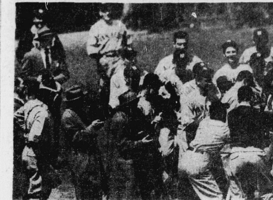
La scène se passe de nos jours, mais elle est une répétition du jour en 1927 quand BABE RUTH croisa le marbre au Yankee Stadium de New-York après son 60ème coup de circuit. Cet acte, filmé avant une joute entre les Yankees de New-York et les White Sox de Chicago récemment, sera compris dans un film intitulé "The Babe Ruth Story", avec William Bendix, jouant le rôle de Ruth.