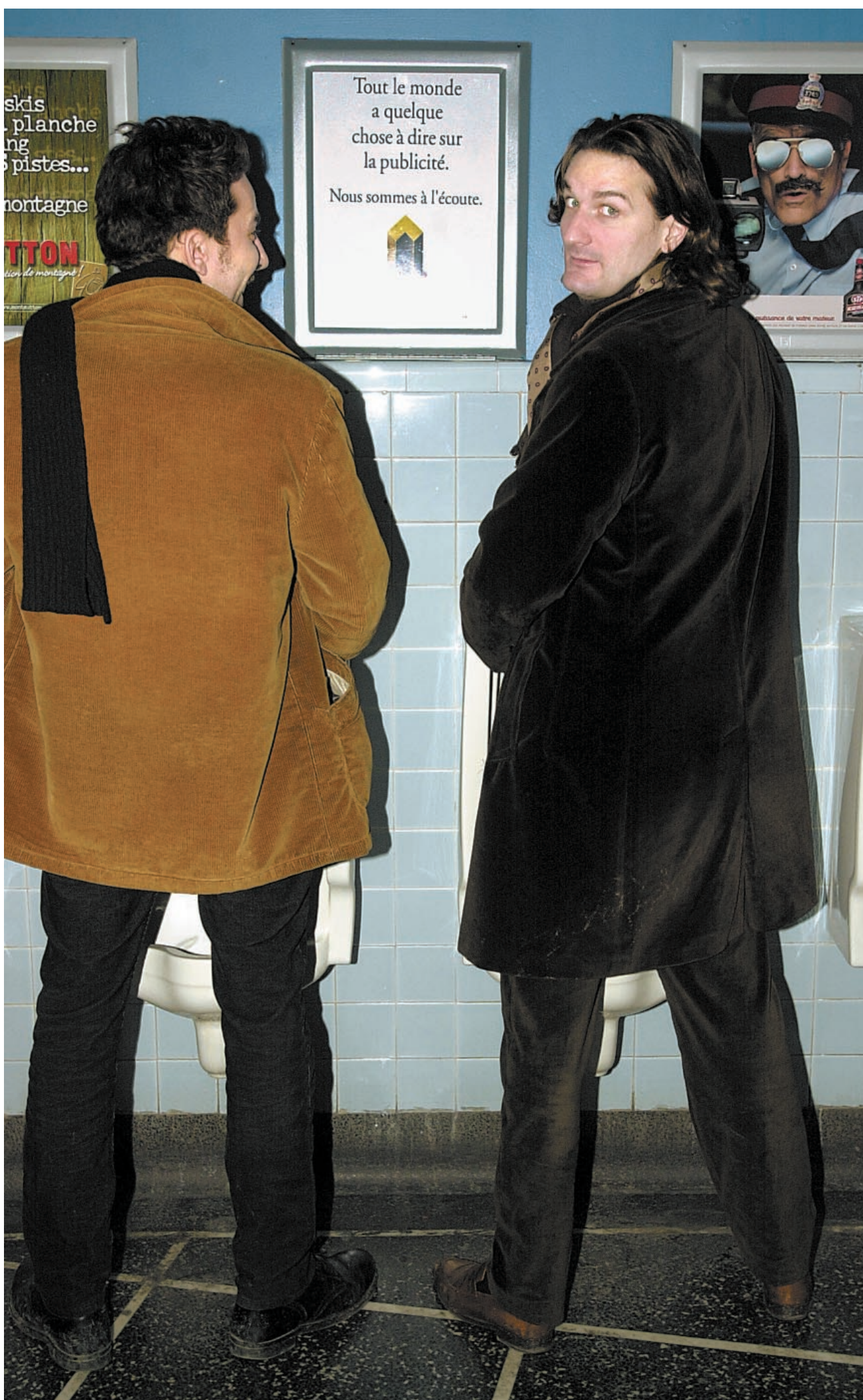
Frédéric Beigbeder (à droite) en entrevue avec notre journaliste.

De l'intérieur, par contre, les réactions n'ont pas été aussi positives. Loin s'en faut. Outre son congédiement de chez Young & Rubicam, Beigbeder s'est heurté à un mur de protestations chez les pros du milieu, qui ont très mal digéré