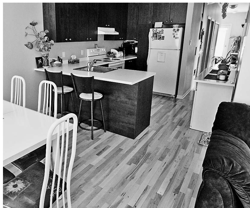
Cette aire ouverte, à plafonds hauts et généreuse fenestration, comprend la cuisine, la salle à manger et le salon, dont on voit ici un bout de fauteuil, sur la droite. Nous sommes au rez-de-chaussée du duplex terminé.

devant notaire, dans le duplex mitoyen, lui aussi construit par Habitat pour l'humanité Montréal, mais en 2007. Au rez-de-chaussée, ce logement occupe 2312 pieds carrés (1156 pi.ca. pour le rez-de-chaussée et 1156 pi. ca. pour la cave de béton non finie). Il a été évalué, par une firme indépendante, à 265 188$, et vendu en première hypothèque (voir l'encadré) à 217 000$, ce qui revient à 93,94$ le pied carré.