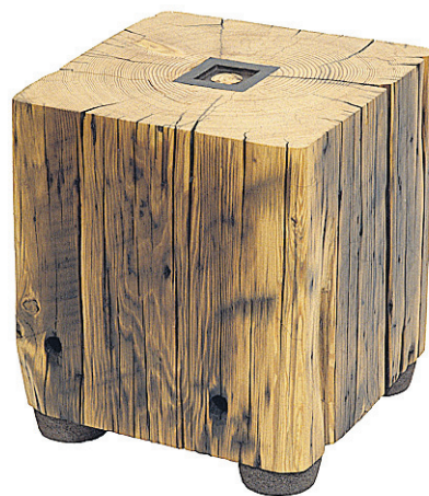
Un modèle populaire : table-tabouret Qin.

Érik Desprez a créé quelque 90 tables pour décorer les chambres de l'hôtel Saint-Paul à Montréal.