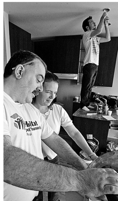
Chacun participe à l'aménagement intérieur, de la pose des lampes au maniement de la scie à onglets.