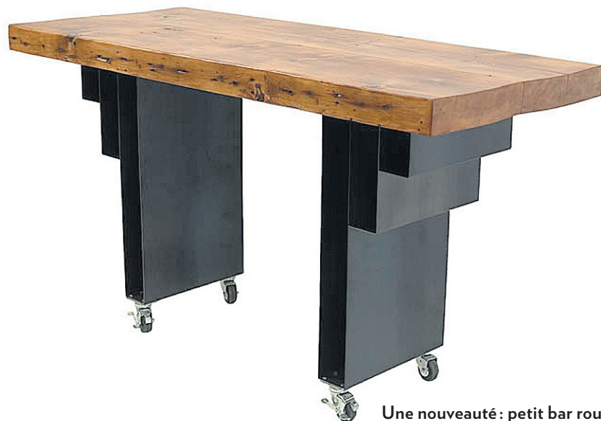
Une nouveauté : petit bar roulant Staccato.