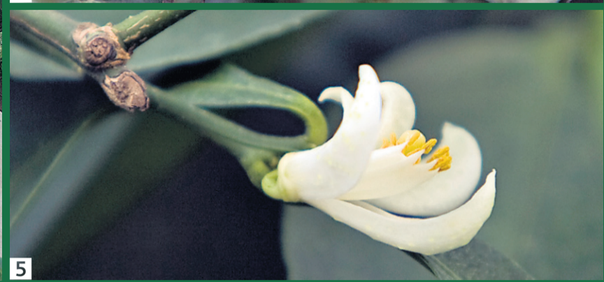
1 Une passerelle permet d'avoir une vue d'ensemble du jardin réaménagé. 2 Le café est d'abord un fruit rougeâtre et ce sont ses graines qui servent à faire le célèbre breuvage. 3 Le papayer est déjà en production. 4 Le carambolier, actuellement dans toute sa splendeur, dans la nouvelle serre des plantes alimentaires tropicales du Jardin botanique. 5 Fleur de tangelo, un citrus issu du croisement entre le pomélo et la tangerine.