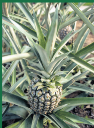
6 On trouve plusieurs plants d'ananas dans la nouvelle serre.