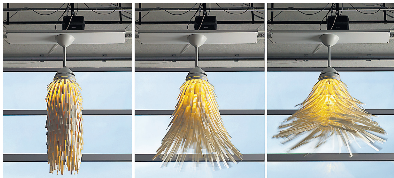
Lampe Derviche : plus la lampe tourne vite, plus il y a de lumière.