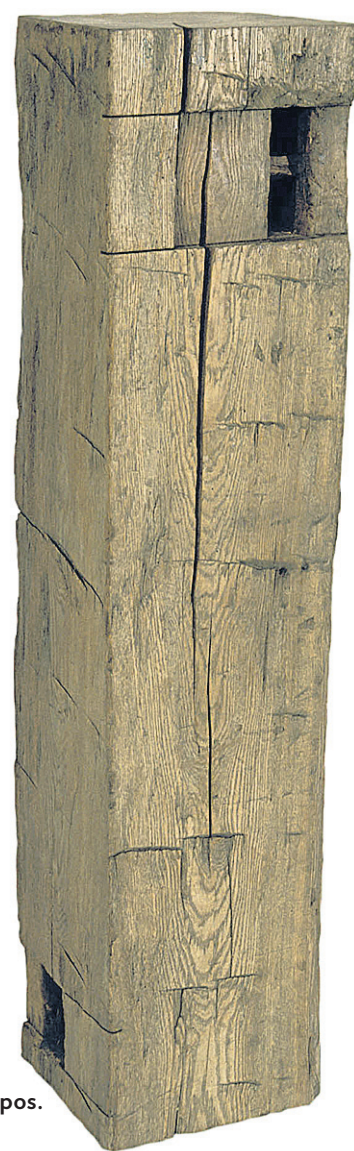
Colonne-sculpture de la collection Anthros.