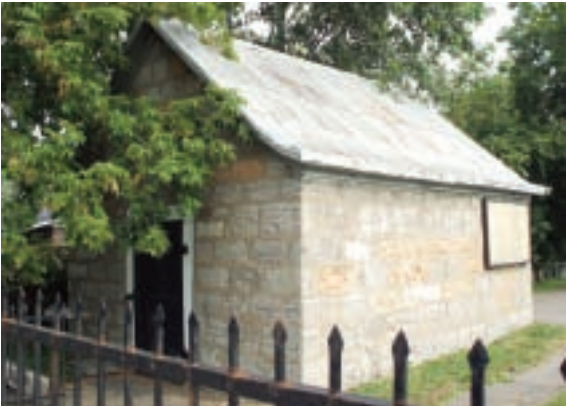
Charnier du cimetière