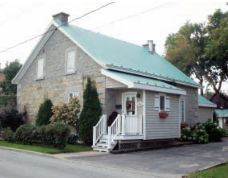
Ancienne résidence David aujourd'hui

La caractéristique principale de cette maison est la différence des pierres utilisées dans sa construction. En effet, les chaînages d'angle des murs sont en pierre de taille. On retrouve du calcaire dans le haut des murs; puis, dans le bas, de la dolomie de Beekmantown, sorte de pierre jaunâtre couleur chamois qui compose également le charnier du cimetière, les murs latéraux de l'église et quelques autres bâtiments du Vieux-Sainte-Rose. La dolomie de Beekmantown se trouve uniquement dans l'ouest de l'île Jésus, où il y a très peu de potentiel rocheux, ce qui explique la rareté de cette pierre et l'intérêt de la résidence. Remarquez la précision de la taille dans les pierres d'angles, qui démontre la solidité de la maison.