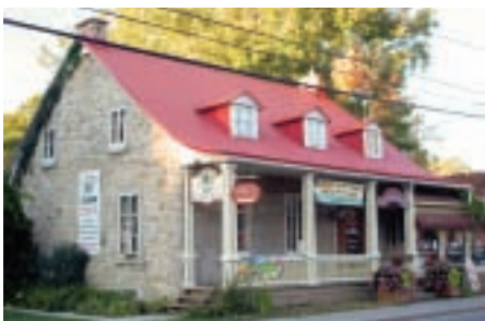
Résidence Ouimet aujourd'hui