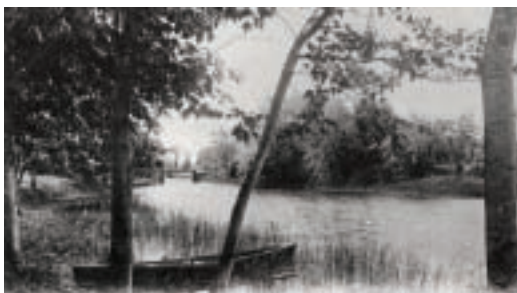
Plan d'eau au début du XX e siècle

À l'arrière du bâtiment se trouve la berge du Garrot, d'où l'on accède au parc de la Rivière-des-Mille-Îles. Les activités nautiques qui y sont offertes permettent de découvrir la biodiversité de la faune et de la flore. Vous êtes invités à poursuivre votre excursion afin de découvrir ces paysages riverains, que nos ancêtres ont, eux aussi, pu apprécier.