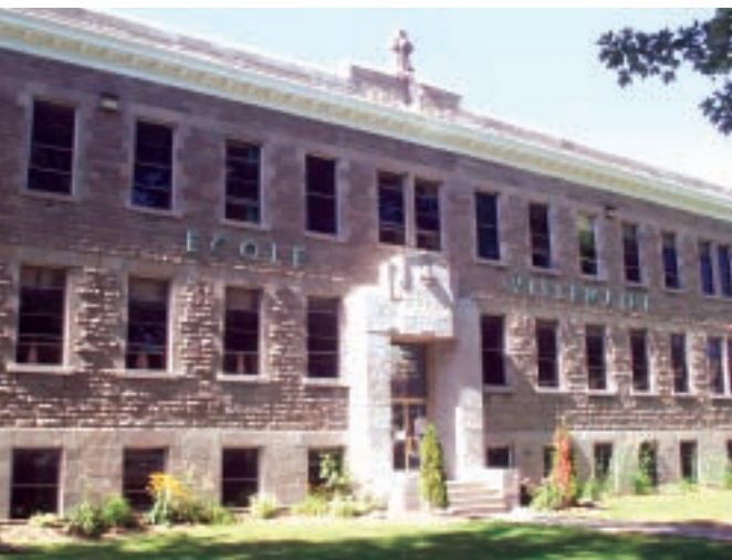
Ancien collège des Frères de Saint-Gabriel