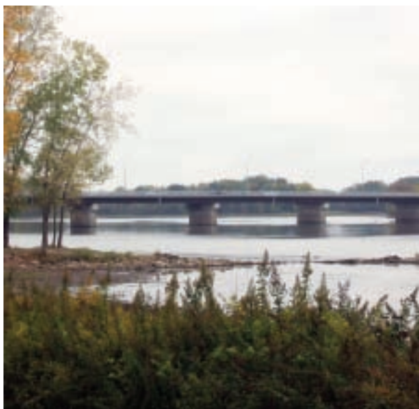
Pont Marius-Dufresne en 2007