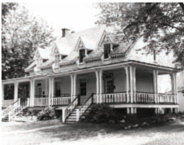
Ancienne résidence de la famille de Clarence Gagnon

Cette résidence demeure la propriété de la famille de l'artiste-peintre Clarence Gagnon jusqu'à la fin des années 1880.