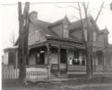
La Banque Provinciale en 1914