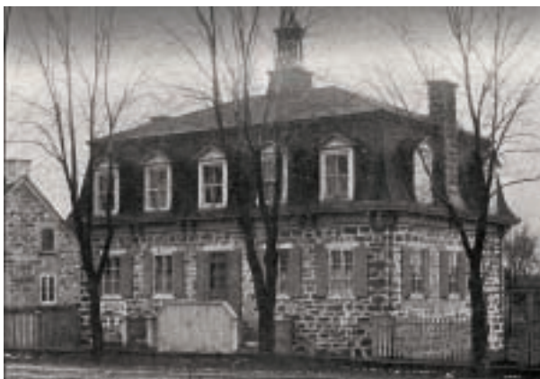
École du village après les premières transformations des années 1870

L'éducation semble tenir une place primordiale dès la fondation de Sainte-Rose. Entre 1814 et la construction de l'école de la fabrique, c'était un prêtre ou un maître d'école qui enseignait aux élèves, dans une salle vétuste du presbytère. Le bâtiment du 214, boulevard Sainte-Rose est construit vers 1831 pour loger une école de fabrique. Cette dernière est administrée par la Fabrique de Sainte-Rose tout en restant indépendante du clergé. Elle est ensuite administrée conjointement avec la commission scolaire, lors de la création de celle-ci au début des années 1840.