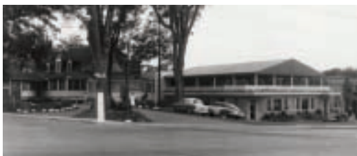
Château Sainte-Rose, vers 1950