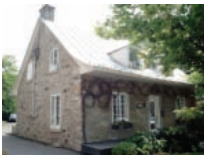
Maison du bedeau aujourd'hui