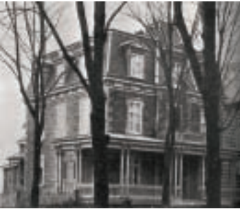
4 e presbytère de la paroisse en 1900