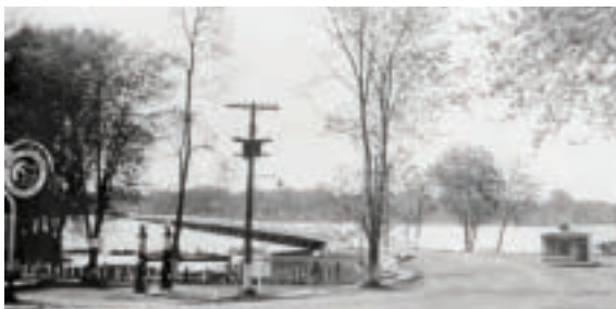
Entrée du pont Plessis-Bélair, côté de Sainte-Rose vers 1943

Le nouveau pont est construit en 1854 et porte le nom de Plessis-Bélair, en l'honneur de la famille qui en est propriétaire jusqu'en 1938. À partir de cette date, le pont est pris en charge par le gouvernement et son accès devient gratuit. Prolongeant le boulevard Curé-Labelle à peu près au même endroit que le pont actuel, il dévie cependant sur l'autre rive en diagonale, vers l'ouest. On en trouve toujours des vestiges du côté de Rosemère. Déjà à l'époque, le pont offre un point de vue privilégié pour admirer les activités sur la rivière.