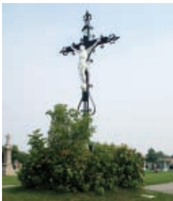
Calvaire au centre du cimetière