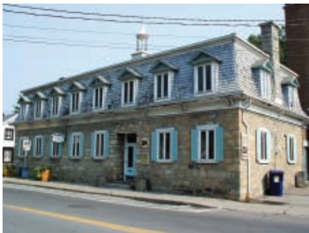
L'édifice tel qu'il est aujourd'hui

L'hôtel de ville déménage en 1965, suite à la fondation de la Ville de Laval. Peu après, le bâtiment devient la bibliothèque Sylvain-Garneau. Depuis la délocalisation de cette dernière, l'ancienne école conserve une vocation artistique et culturelle.