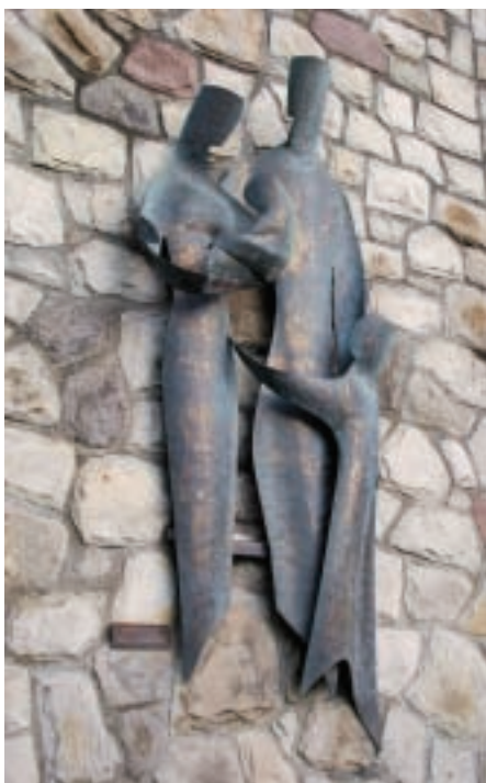
Vers l'avenir (1990), oeuvre de Gaëtan Therrien

Sur la façade de la caisse populaire, au 224, boulevard Sainte-Rose