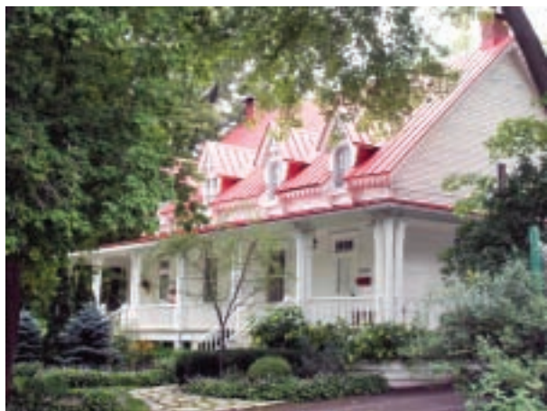
Ancienne maison Gagnon aujourd'hui

Cette résidence demeure la propriété de la famille de l'artiste-peintre Clarence Gagnon jusqu'à la fin des années 1880.