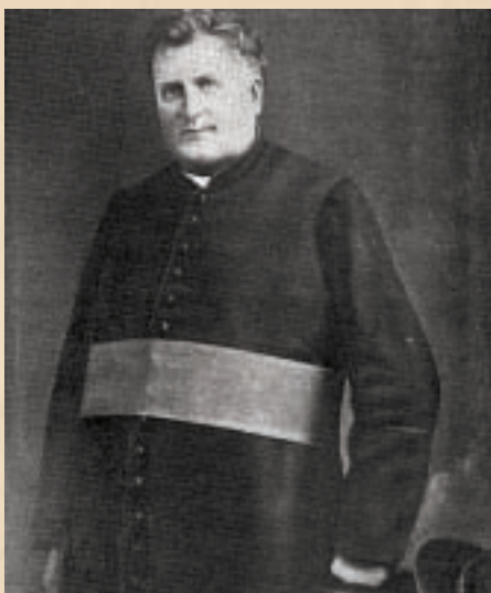
Le curé Labelle