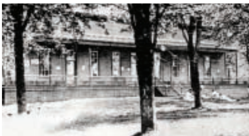
Club nautique, vers 1900-1910

À l'époque, le Sainte-Rose Boating Club est le club nautique le plus réputé de la région. Il est localisé juste à l'ouest du pont Plessis-Bélair (aujourd'hui le pont Marius-Dufresne), tout près de la rivière, sur le site de l'actuel Manoir Thérèse-Casgrain. Fondé vers 1889 par un groupe de vacanciers montréalais, le club est majoritairement formé d'anglophones. Les propriétaires aménagent bientôt des installations pour jouer au croquet et au tennis, puis construisent des quais pour faciliter l'accès à la rivière et aux activités nautiques. Le club organise également des régates et des tournois, de même que des soirées dansantes et des bals dans le bâtiment principal.