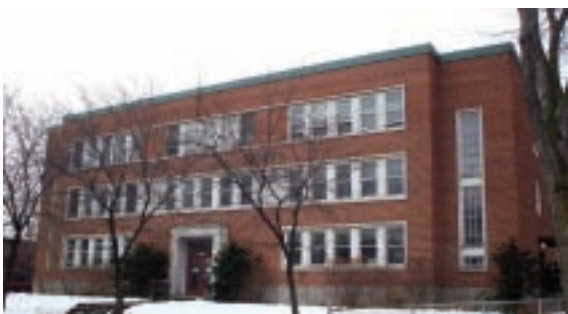
Ancien externat en 2008