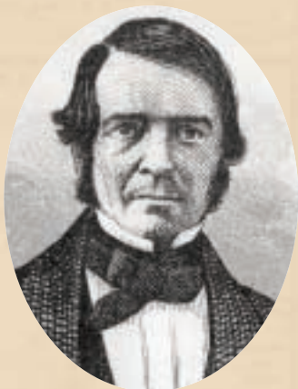
André Ouimet Collection SHGIJ.