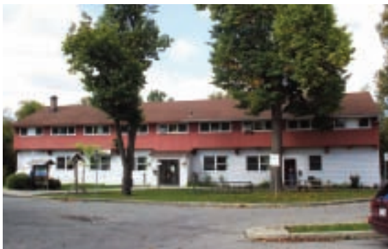
345, boulevard Sainte-Rose

Solitude , carte postale du photographe Pierre-Fortunat Pinsonneault. Collection Ginette Charbonneau, oblitérée en 1906.