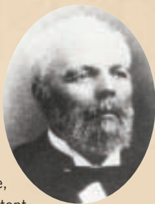
Gédéon Ouimet, défenseur de l'éducation

Gédéon Ouimet (1823-1905) est le vingt-sixième et dernier enfant de Jean Ouimet, cultivateur, et le frère cadet du Patriote André Ouimet. Né lui aussi à Sainte-Rose, Gédéon Ouimet s'illustre en tant qu'avocat et, plus tard, comme politicien. Député conservateur de Beauharnois (1858-1861), puis de Deux-Montagnes (1867-1876), il devient le deuxième premier ministre du Québec de 1873 à 1874. Il entreprend entre autres des mesures pour favoriser la construction des chemins de fer destinés à coloniser de nouvelles régions comme les Laurentides.