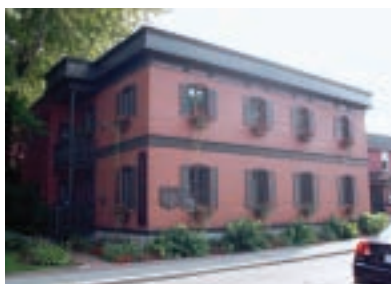
L'apparence actuelle du bâtiment