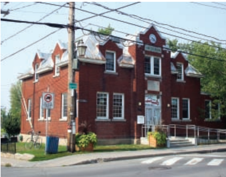
Ancien bureau de poste aujourd'hui

Ce bureau de poste confirme l'importance de Sainte-Rose comme grand bassin de population, surtout en période estivale, quand les vacanciers en provenance de Montréal ou d'ailleurs s'ajoutaient à la population locale. En 1931, 3034 personnes habitent Sainte-Rose. Dix ans plus tard, on en dénombre 3918, soit près de 900 de plus.