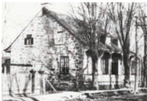
Résidence Ouimet au début du XX e siècle Collection SHGIJ.

Vers 1935, les propriétaires ajoutent une annexe latérale, où ils tiennent une petite mercerie. Vers la fin des années 1970, une seconde annexe, bâtie en pièce sur pièce, est ajoutée à l'arrière. Cet ajout contemporain n'a en rien compromis l'intégrité de la maison. À l'intérieur, on ne peut être qu'ébloui par toutes les boiseries, moulurations et poutres apparentes sous les combles. Toutes les moulures intérieures et extérieures sont en pin, un bois grandement utilisé dans la construction de maisons à cause de sa disponibilité.