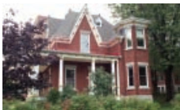
14, rue Cantin