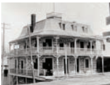
Hôtel Cyr, au nord du boulevard Sainte-Rose, au coin de la rue du Pont (aujourd'hui le boulevard Labelle) en 1910