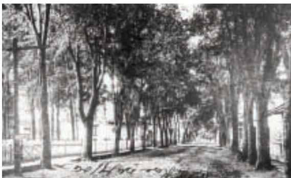
Ormes sur le boulevard Sainte-Rose au début des années 1900

Sur la façade de la caisse populaire, au 224, boulevard Sainte-Rose