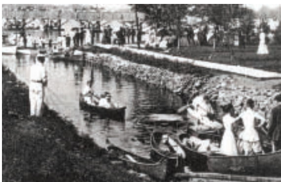
Canal, au Sainte-Rose Boating Club, vers 1911