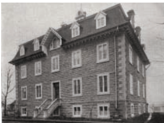
Couvent en 1900

Ce bâtiment a été réalisé par l'architecte Victor Bourgeau, qui a également dessiné les plans de l'église actuelle. L'architecte choisit de donner au bâtiment un style néo-classique, tout en s'inspirant du Second Empire européen très à la mode à l'époque. On le voit grâce au toit mansardé qui comporte plusieurs lucarnes et un clocheton délicat placé au sommet de l'édifice. Sous le brisis du toit, on remarque un superbe travail de menuiserie avec la corniche à denticules à la grecque, très bel exemple de langage classique. Sur la façade principale, séparant le brisis du toit en plein milieu, se trouvent trois fenêtres à la mode palladienne démontrant encore une fois le caractère classique du bâtiment.