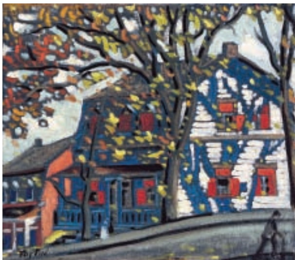
Marc-Aurèle Fortin, Rue Principale à Sainte-Rose, vers 1930

Clarence Gagnon passe une partie de sa vie à Sainte-Rose. Tout près de chez lui se trouve la maison natale de Marc-Aurèle Fortin, disparue au cours des années 1940. Fortin reproduit d'ailleurs les magnifiques paysages de Sainte-Rose dans nombre de ses oeuvres, avec ses grands ormes et ses belles villas d'été.