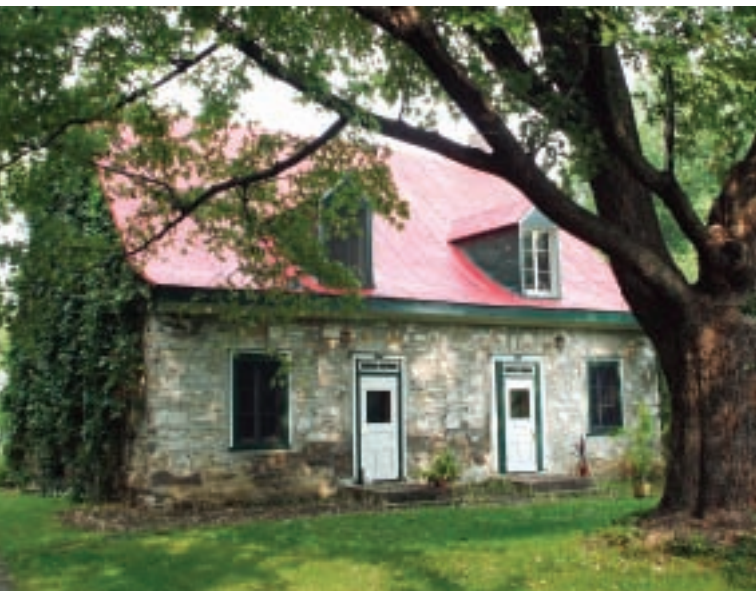
Ancienne résidence Desjardins aujourd'hui

Cette résidence a appartenu à la famille Desjardins pendant plusieurs générations.