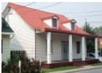
1125, rue des Patriotes

La version québécoise traditionnelle a été adaptée à notre climat rigoureux par les colonisateurs français. La pente du toit est légèrement galbée et le larmier se prolonge souvent en façade, de façon à couvrir la galerie et à protéger la charpente des murs des infiltrations d'eau. La maison québécoise comporte davantage d'ouvertures et certaines possèdent même des lucarnes au niveau du toit. On peut la reconnaître également par son dégagement du sol et par la présence de fondations plus profondes, deux facteurs qui assurent une meilleure isolation de la maison. Les plafonds bas permettent la conservation de la chaleur dans les pièces. Le style « québécois traditionnel » est donc né de cette adaptation.