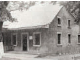
Bureau d'enregistrement du comté de Laval au début du XX e siècle

En 1857, on incorpore le village de Sainte-Rose à la Corporation du comté, car il a des intérêts et des besoins différents de ceux du reste de la paroisse. Ceci permet de donner un siège de plus à Sainte-Rose au sein de l'organisation. En 1918, le village de Sainte-Rose obtient son statut de ville, puis est reconnu comme cité de Sainte-Rose en 1958. Sainte-Rose est, par la suite, fusionnée avec les autres villages en 1965 pour former la Ville de Laval.