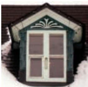
Détail des lucarnes de la résidence Joly-Vaillancourt