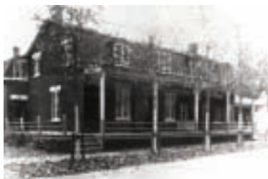
L'apparence d'origine de la maison qui a succédé à celle où est né le curé Labelle

À l'origine, cette maison possédait un superbe toit mansardé à deux brisis qui disparaît avec le rehaussement de la toiture effectué des années plus tard. Depuis, des travaux de rénovation ont été réalisés pour harmoniser son apparence extérieure, notamment en rajoutant des corniches ouvragées et en déplaçant des ouvertures en façade, de façon à les rendre plus régulières. Ce bâtiment témoigne d'une attention portée au détail dans la construction : les finitions et les joints sont d'une belle qualité.