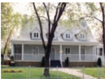
La maison en 1990 Collection SHGIJ