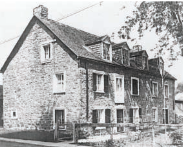
Ancienne auberge Tassé au début du XX e siècle