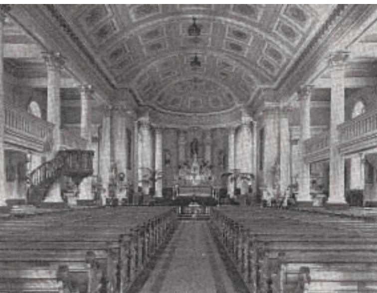
Intérieur de l'église au début du XX e siècle