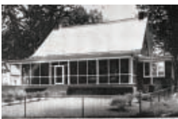
L'apparence de la maison Filiatrault-Latour, au début du XX e siècle

À l'origine, la maison devait avoir une tout autre apparence extérieure et sans doute des murs de pierre; ils sont aujourd'hui recouverts de crépi. Sur cette photo du début du XX e siècle, la façade est cachée par des moustiquaires qui ont été enlevés depuis. Le toit a manifestement été refait; son larmier déborde maintenant davantage pour couvrir toute la galerie. On constate d'ailleurs que les lucarnes actuelles n'y étaient pas à l'origine, ce qui modifie beaucoup l'allure de la résidence. Le cadre de verdure qui entoure la maison est superbe et rehausse indéniablement son cachet historique.