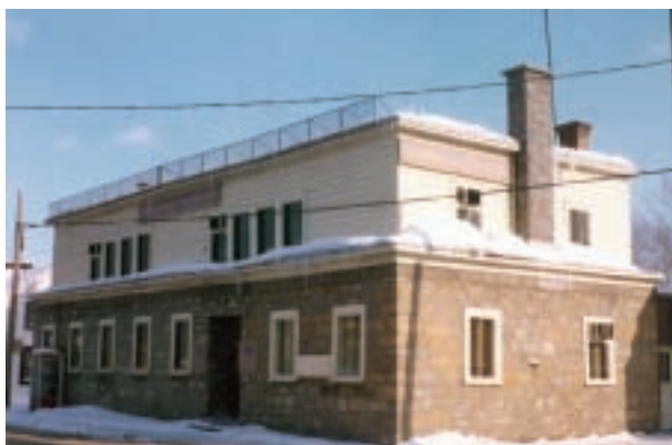
Après la transformation de 1949 Collection SHGIJ.

Aujourd'hui, après une restauration adéquate par la Ville en 1986, l'ancienne école du village a repris son allure d'origine après l'agrandissement de 1901, mais sans le petit portique.