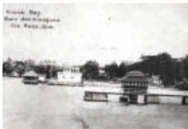
Baignoires de Sainte-Rose, sur la rivière des Mille Îles, vers 1900-1910