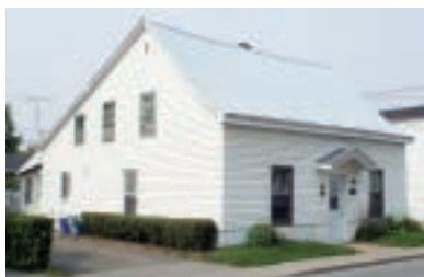
1365, rue des Patriotes