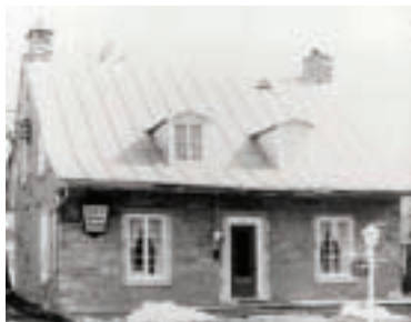
Maison du bedeau autrefois

Cette résidence traditionnelle québécoise est bâtie en 1859 avec la pierre et le bois réutilisés après la démolition de la deuxième église. Même si, à l'époque, on recouvre habituellement les murs d'une couche de crépi, ceux de cette résidence restent à nu. Les portes et fenêtres extérieures sont d'origine et très bien entretenues. Des lucarnes percent la toiture recouverte de tôle à baguette, un matériau de recouvrement très en vogue à l'époque.