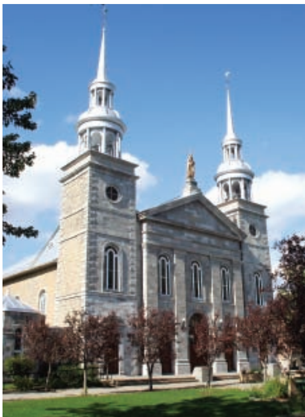
Église Sainte-Rose-de-Lima aujourd'hui

L'architecte Victor Bourgeau (1809-1888) a dessiné les plans de l'église actuelle, qui date de 1856. Celle-ci est la seule des trois églises de Sainte-Rose conçue par un professionnel de renom. Polyvalent, Bourgeau s'inspire au cours de sa carrière de différents styles architecturaux, dont le néo-classicisme, le néo-gothique et le néo-baroque. À cette époque, il est reconnu pour la simplicité et la facilité d'exécution de ses plans et devis, de même que pour sa capacité d'adapter ses plans selon les besoins et les moyens financiers des paroisses qui l'engagent. Il peut sans aucun doute être considéré comme le principal architecte du diocèse de Montréal et des églises québécoises.