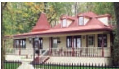
2, rue Cantin

Fait à noter : la résidence du 14, rue Cantin appartient aux Soeurs de Sainte-Croix de 1932 à 2002; on y dispense notamment à une époque des cours d'art culinaire aux couventines.