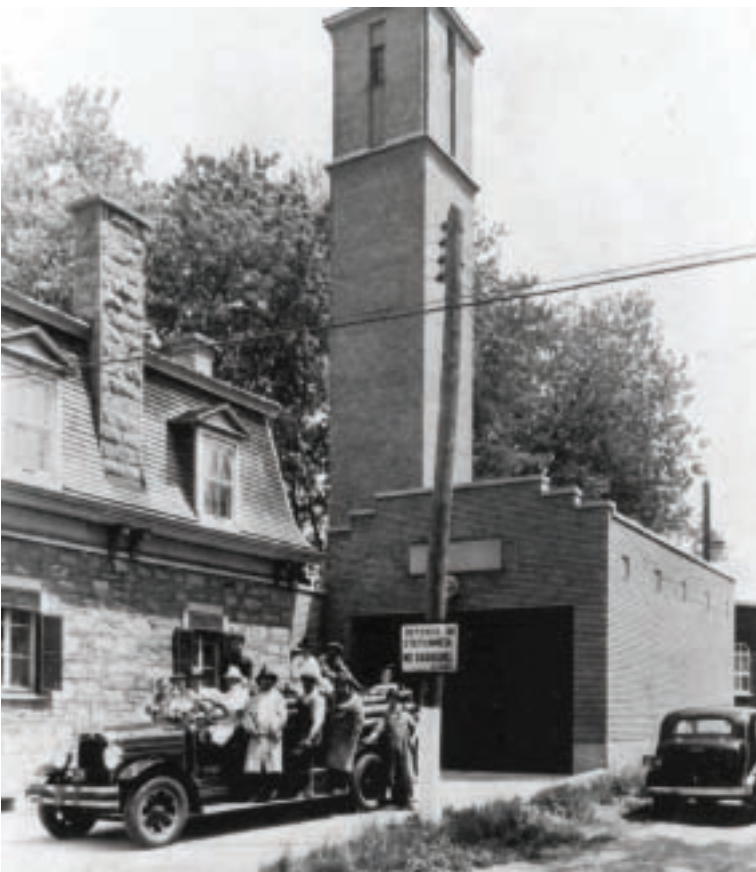
Première pompe à incendie en 1946

En 1930, une caserne de pompiers est rattachée à l'ancienne école. La tour qui la surplombe sert à suspendre les boyaux d'incendie afin de les faire sécher sans les endommager en les pliant. La présence de cette caserne dans le village est un signe de l'accroissement de la population de Sainte-Rose et de la nécessité d'offrir aux gens des services publics municipaux adéquats.