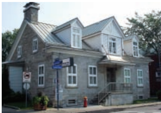
Résidence Longpré-Ouimet en 2008