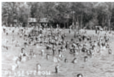
Plage Sainte-Rose en 1939