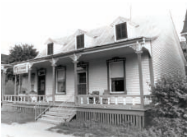
Résidence Joly-Vaillancourt, vers le milieu du XX e siècle