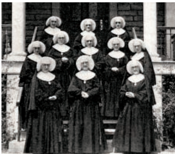
Les Soeurs de Sainte-Croix vers 1940

La pierre utilisée pour la maçonnerie provient des carrières de pierre de l'entrepreneur Félix Labelle de Sainte-Rose. Quant au portail de la façade, il est modifié au début des années 1900. On y ajoute un petit toit avec un fronton supporté par des pilastres s'inspirant du piano nobile , un rez-de-chaussée surélevé qui est mis en évidence à l'extérieur par la différence de taille de la pierre. Par ses différents éléments architecturaux, le couvent de Sainte-Rose ressemble beaucoup aux autres bâtiments conventuels construits à la même époque dans la région de Montréal.