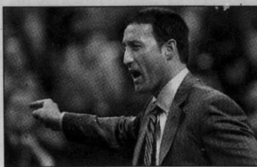
Le ministre des Affaires étrangères, Peter MacKay.

D'après la ministre responsable de l'Agence canadienne de développement international (ACDI), Josée Ver-