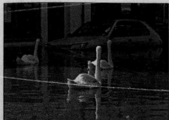
Des cygnes empruntent une rue d'Evesham, en Grande-Bretagne, l'une des localités touchées par les inondations des derniers jours.