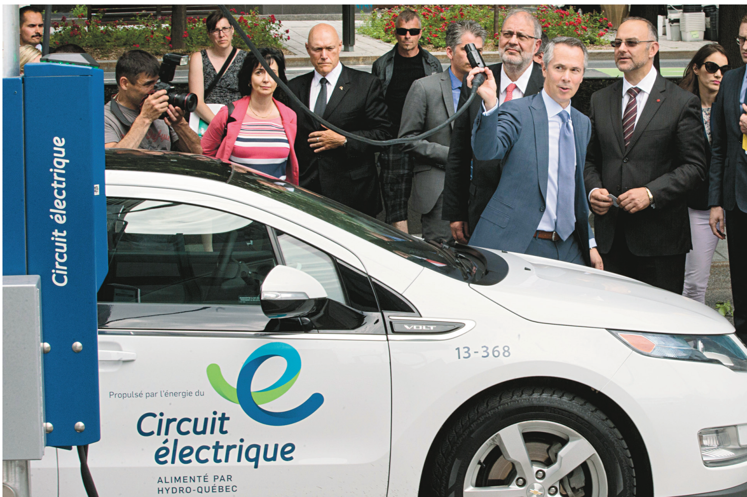
Le p.-d.g. d'Hydro-Québec, Thierry Vandal, a fait la démonstration du fonctionnement des nouvelles bornes de recharge accessibles à tous les types de véhicules électriques, mercredi à Montréal.