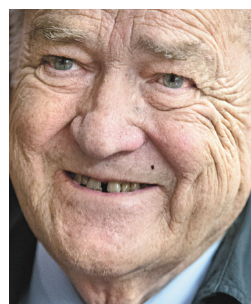
JACQUES NADEAU LE DEVOIR Jean Garon

J'écrivais récemment ceci dans le magazine littéraire Nuit blanche: «Souligner la largeur de vue de Jean Garon, ses qualités de travailleur acharné, ses débats soutenus avec autant de modération que de passion, ses combats menés avec autant de ruse que de droiture, ses importantes réalisations, toutes motivées par un sens aigu de son devoir de servir l'intérêt public, son inébranlable conviction de la nécessité de l'indépendance, sa critique du manque d'audace de ses compatriotes, de leur peur de s'assumer comme peuple libre et souverain, est encore n'avoir rien dit de la complexité de la pensée et de l'action de l'homme politique le plus