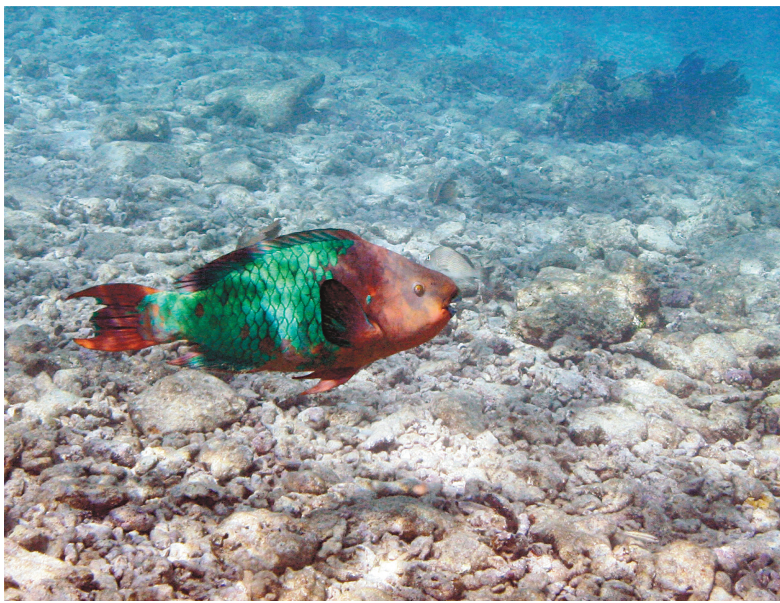
Un poisson-perroquet nage au-dessus de coraux morts au cœur du Florida Keys National Marine Sanctuary, près de Key West.