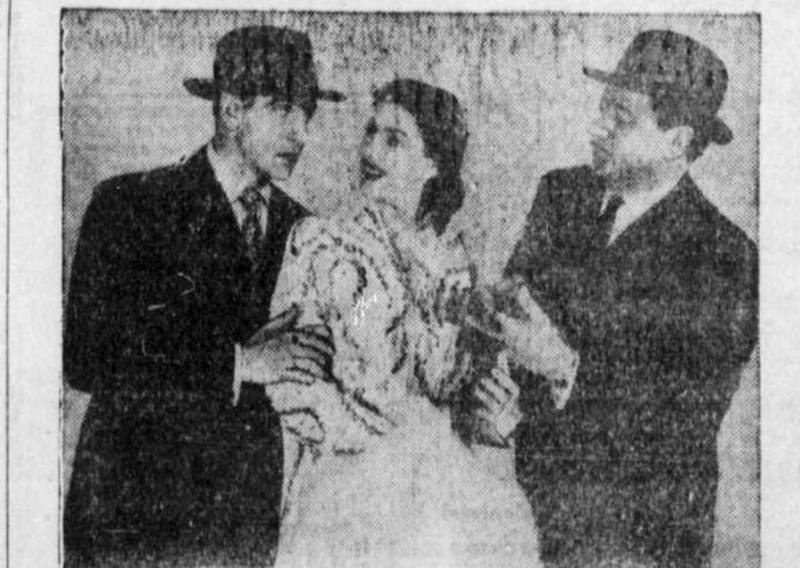
Une scène du film "BEDTIME STORY", actuellement à l'affiche du cinéma Capitol.

Billets en vente au Monument National — Plateau 9161