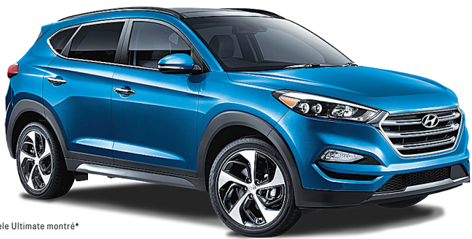
Modèle Ultimate montré*