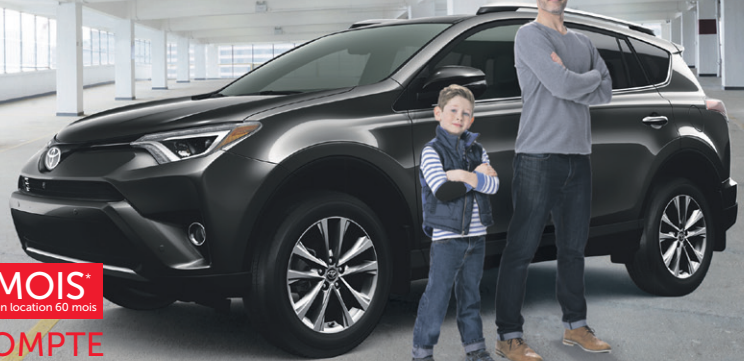
Modèle 4RM Limited illustré

RAV4 299$ MOIS* 2RM LE 2016 0$ D'ACOMPTE en location 60 mois Équivalent à 69$/sem.**