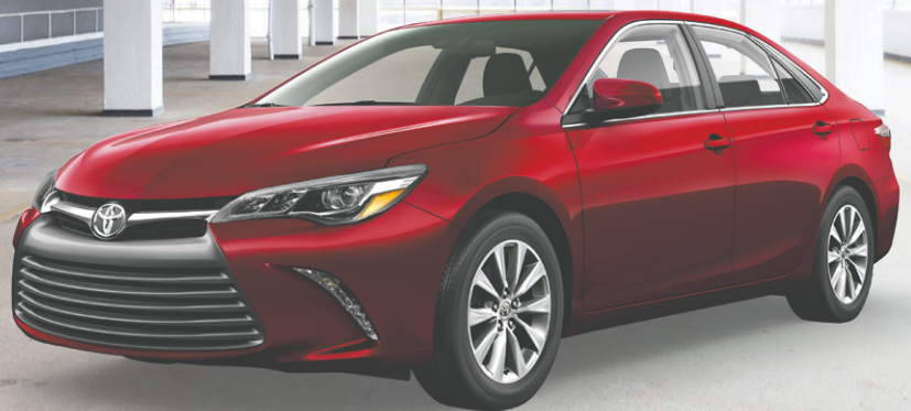
Modèle XLE V6 illustré