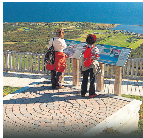
Une quarantaine de projets, réalisations et orientations de développement ont été présentés aux citoyens de Carleton-sur-Mer.