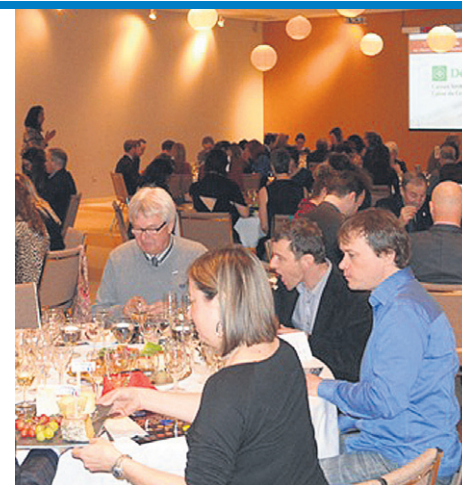
Une dizaine de personnes de plus que l'année dernière ont participé au Vins et Fromages de la CCBDC.

Le montant amassé cette année a été similaire à celui de la première édition. L'événement sera sans doute de retour l'an prochain.