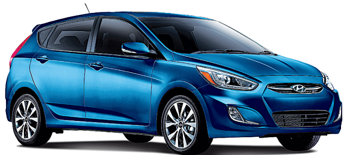
Modèle GLS montré*