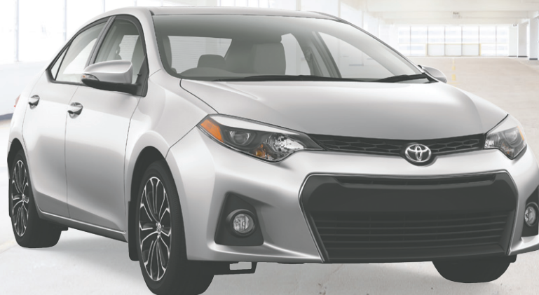
Modèle S illustré