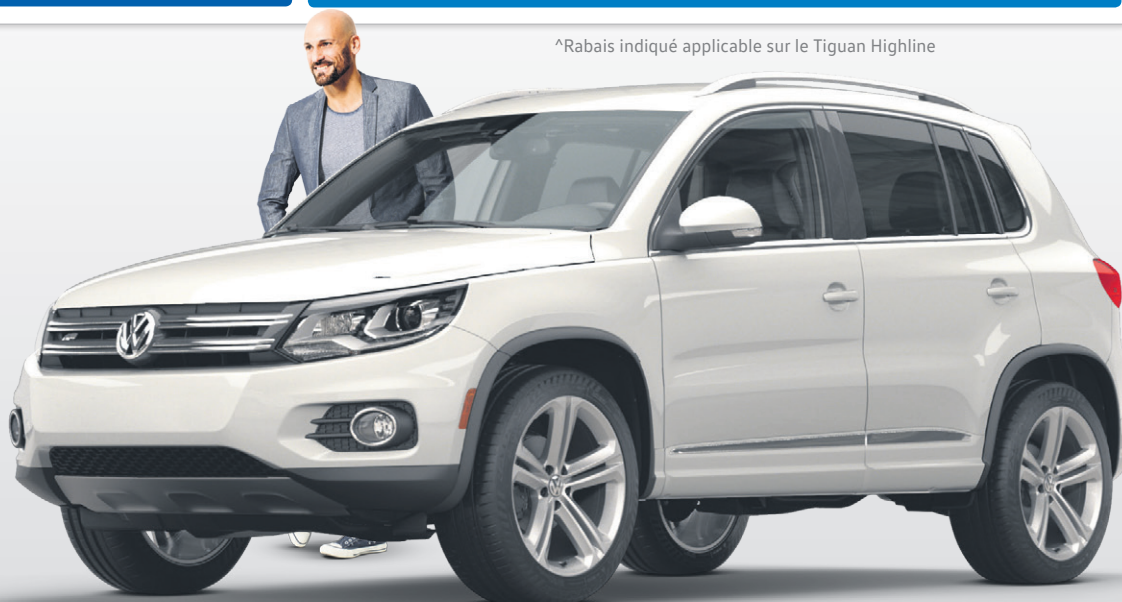
Modèle Highline illustré

L'exceptionnel existe, et il t'est accessible. Découvrez-le par toi-même sur offresvw.ca . Les offres se terminent le 31 mars.