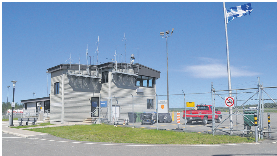
Selon Jean-Guy Poirier, les infrastructures de l'aéroport de Bonaventure seraient déjà adéquates pour accueillir de plus gros transporteurs, avec la piste de 6000 pieds, la possibilité d'atterrir aux instruments et les appareils météo. Des investissements de 1,1 M$ sont d'ailleurs en train d'être faits sur l'aérogare.

Quant à l'apport touristique qui pourrait en ressortir, M. Poirier est loin d'être convaincu. « Ici, nous avons un tourisme terrestre, basé sur le circuit de la route 132, qui permet de voir bien des choses. Arriver en avion dans Rocher-Percé : tu vois le trou dans le rocher et tu repars, tu n'as pas vu grand-chose », illustre-t-il.