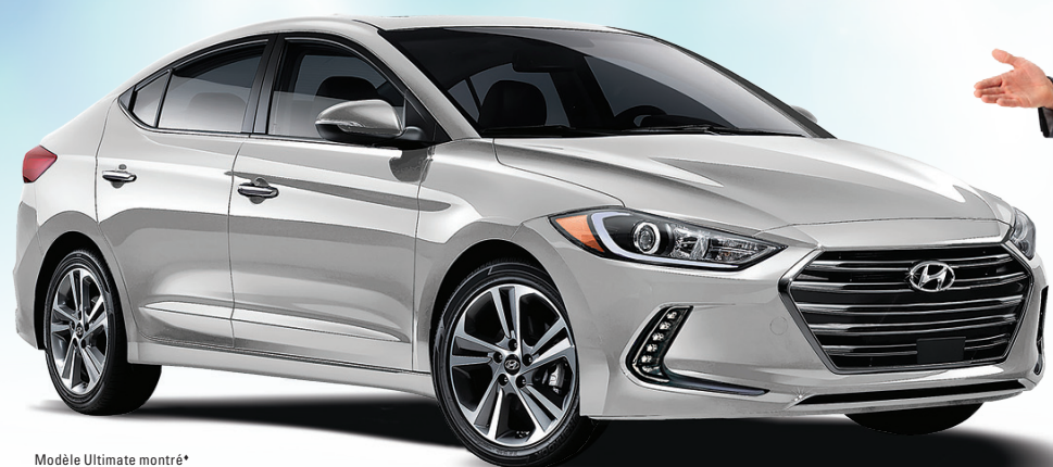
Modèle Ultimate montré*