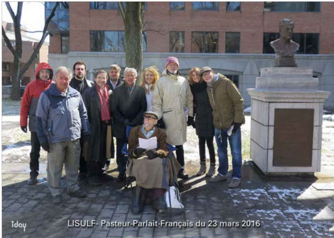
Fig. 1. Le 3 e à partir de la gauche. iday

Place Pasteur-Frappier. Tous les 23 mars à midi, ici commence la Journée PASTEUR PARLAIT FRANÇAIS de la LISULF.