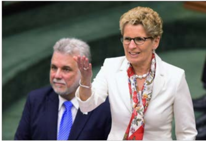
Fig. 2. À Toronto, le 11 mai 2015. Kathleen Wynne et Philippe Couillard après la prestation de celui-ci.