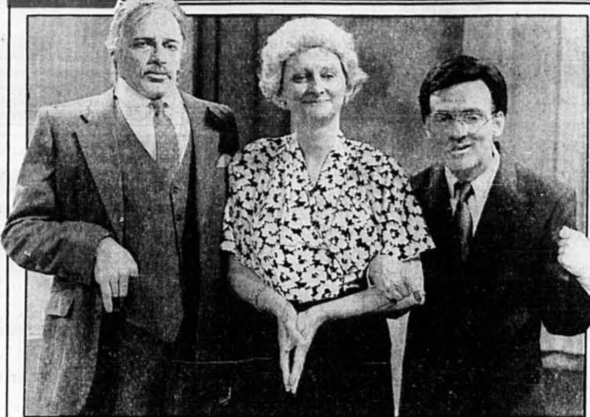
Jacques Parizeau, Mme Bacon et Robert Bourassa vus par Guy Richer, Pierrette Robitaille et Pierre Verville à Rira bien...