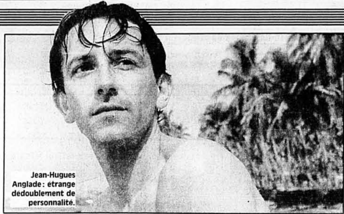
Jean-Hughes Anglade: étrange dédoublement de personnalité.