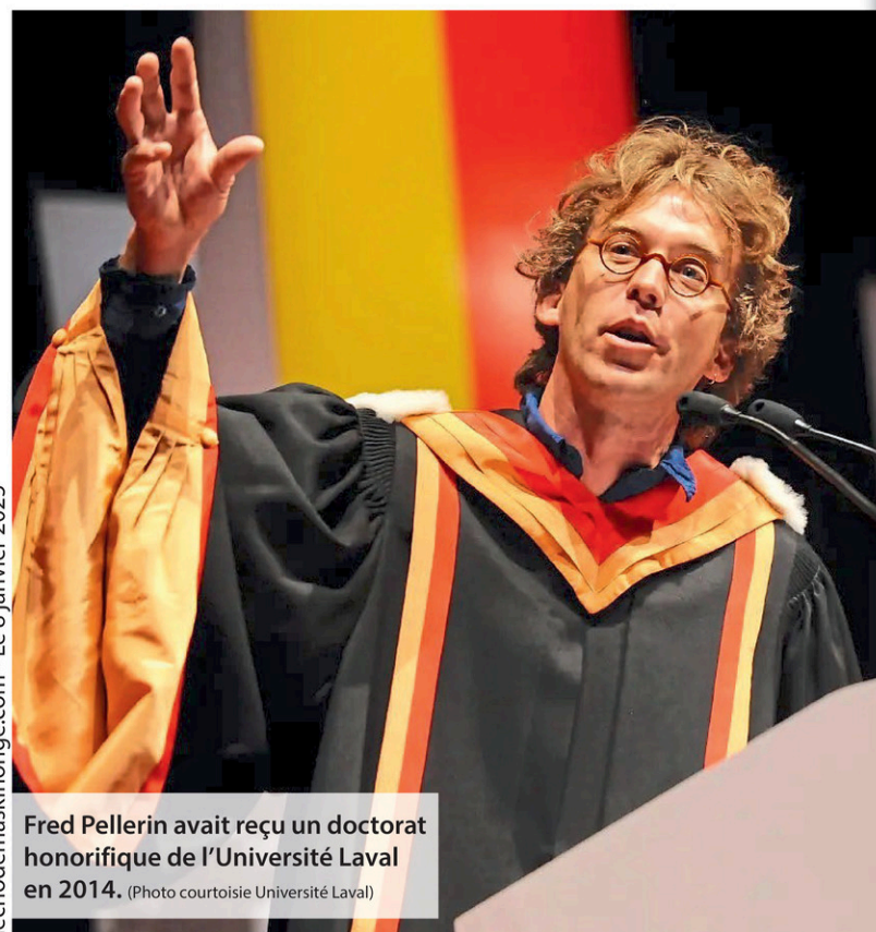
Fred Pellerin avait reçu un doctorat honorifique de l'Université Laval en 2014.

Toutes les histoires de Fred Pellerin font des aller-retour entre la réalité et la fiction note Martine Roberge. «C'est hybride, c'est entre le conte et la légende. La légende, parce que c'est ancré dans son village, un vrai village qui existe, des personnes, des personnages qui ont déjà existé ou en tout cas qui ont contribué, au fond, à les rendre des légendes.»