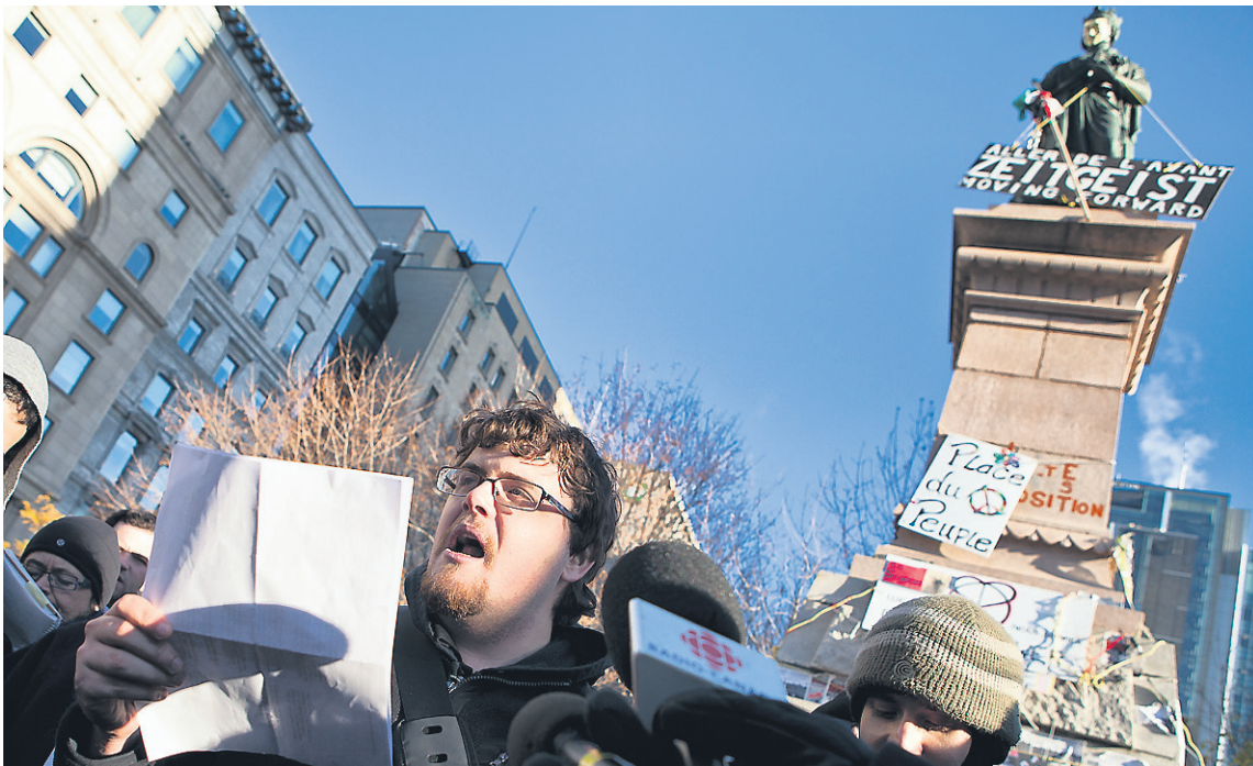
Lors d'une conférence de presse au pied de la statue de la reine Victoria, hier après-midi, une vingtaine d'occupants ont annoncé qu'ils entreprendraient cette semaine une série d'«actions pacifiques», sans en révéler davantage

Montréal n'a pas l'intention, pour l'instant, de lancer un ultimatum aux occupants pour qu'ils libèrent le square Victoria, rebaptisé place du Peuple le 15 octobre par les occupants. «C'est ce qu'on a évité depuis le début, c'est ce que je dis quand on veut faire les choses de façon différente. On n'est pas une ville comme les autres. On a respecté les indignés, on leur a donné la possibilité de s'exprimer. On a été peut-être une des seules villes qui a été tolérante. On a une occasion unique de démontrer au monde entier qu'on est