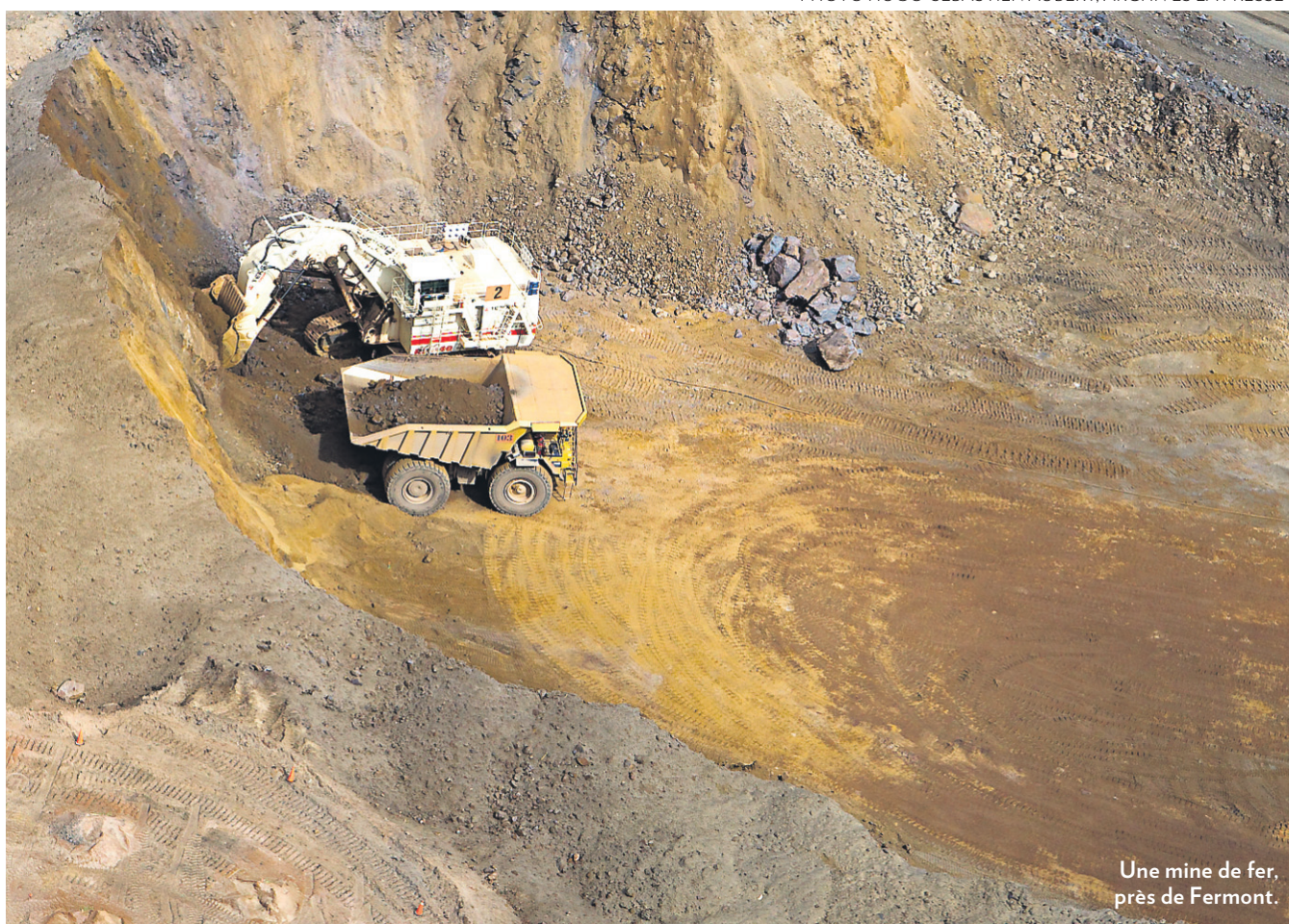
Une mine de fer, près de Fermont.