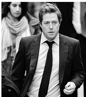
Hugh Grant

La commission d'enquête sur le scandale des écoutes au Royaume-Uni a entamé, à Londres, l'audition des victimes avec le témoignage émouvant des parents d'une adolescente assassinée, puis celui de l'acteur Hugh Grant, grand pourfendeur des dérives des médias. Ce dernier a aussi montré du doigt d'autres publications que celles du groupe Murdoch. — AFP