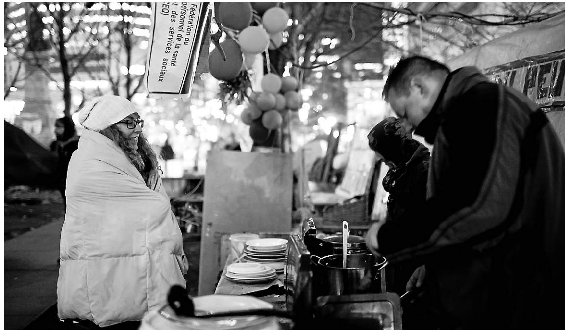
Distribution de nourriture au square Victoria. L'endroit occupé par les indignés d'Occupons Montréal est rapidement devenu le point de ralliement des sans-abris de la métropole.

Les indignés montréalais le savent, mais ils étaient un peu piégés. Piégés par la démocratie directe qui leur interdit d'imposer des décisions. Piégés aussi par la Ville de Montréal, qui a mis beaucoup