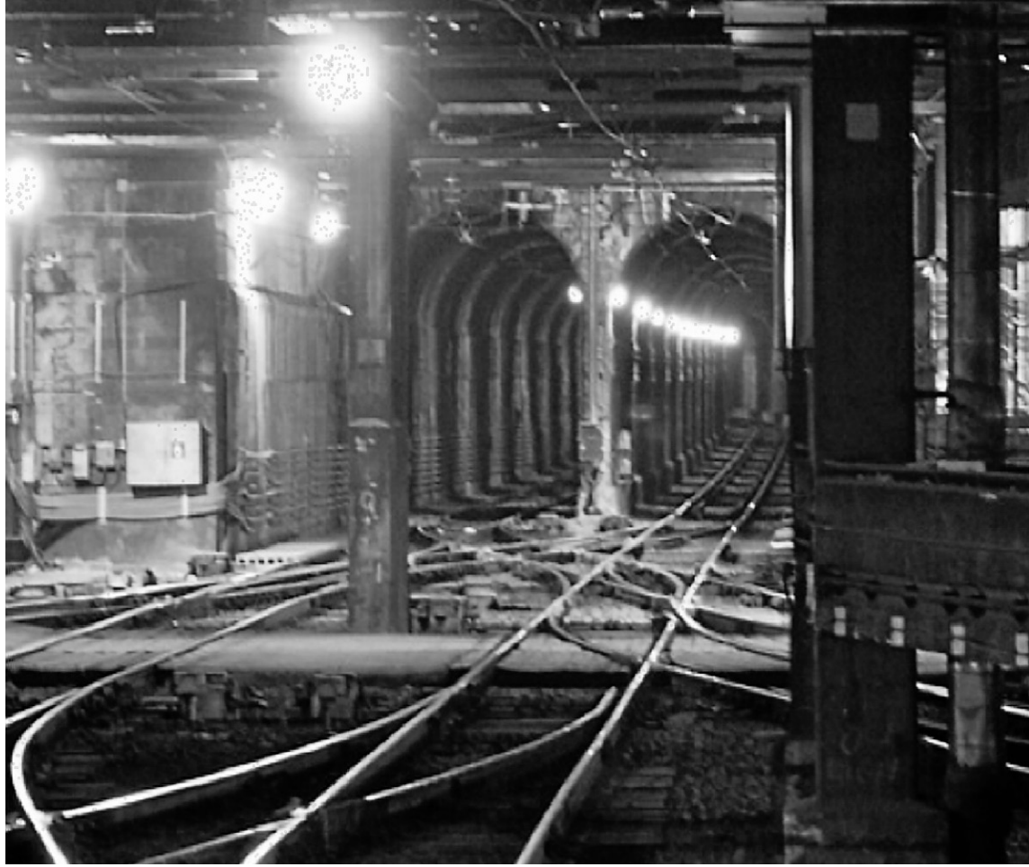
Selon le chef de Projet Montréal, Richard Bergeron, certaines sections du tunnel sous le mont Royal sont si étroites que les passagers ne pourraient pas sortir par les portes latérales en cas d'urgence.

Les locomotives bimodes, propulsées à l'électricité et au diesel, peuvent contenir jusqu'à 6800 litres de combustible extrêmement inflammable, a-t-il rappelé. Ouvert en 1918, le tunnel de 4,8 km sous le mont Royal a toujours été réservé aux locomotives