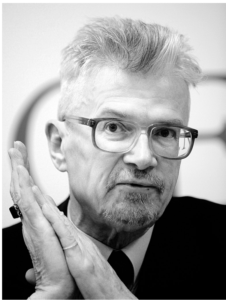
Édouard Limonov, hier, lors de l'annonce de sa candidature à la présidence russe devant une poignée de journalistes réunis à Moscou.

L'écrivain radical, fondateur du Parti national-bolchévique