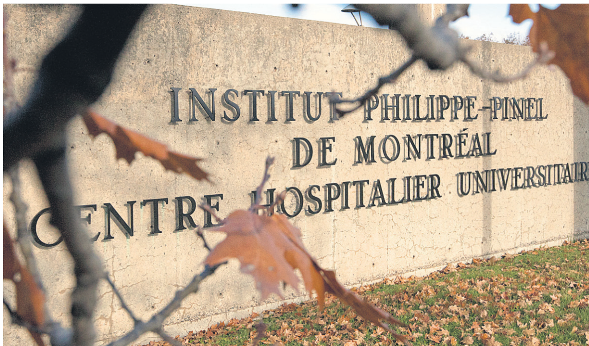
Le printemps dernier, l'Institut Philippe-Pinel a été le théâtre d'une prise d'otages. Depuis, la situation est relativement tendue entre la direction et le bureau de direction du syndicat des employés.

Parmi les nombreux employés qui s'étaient confiés dans le