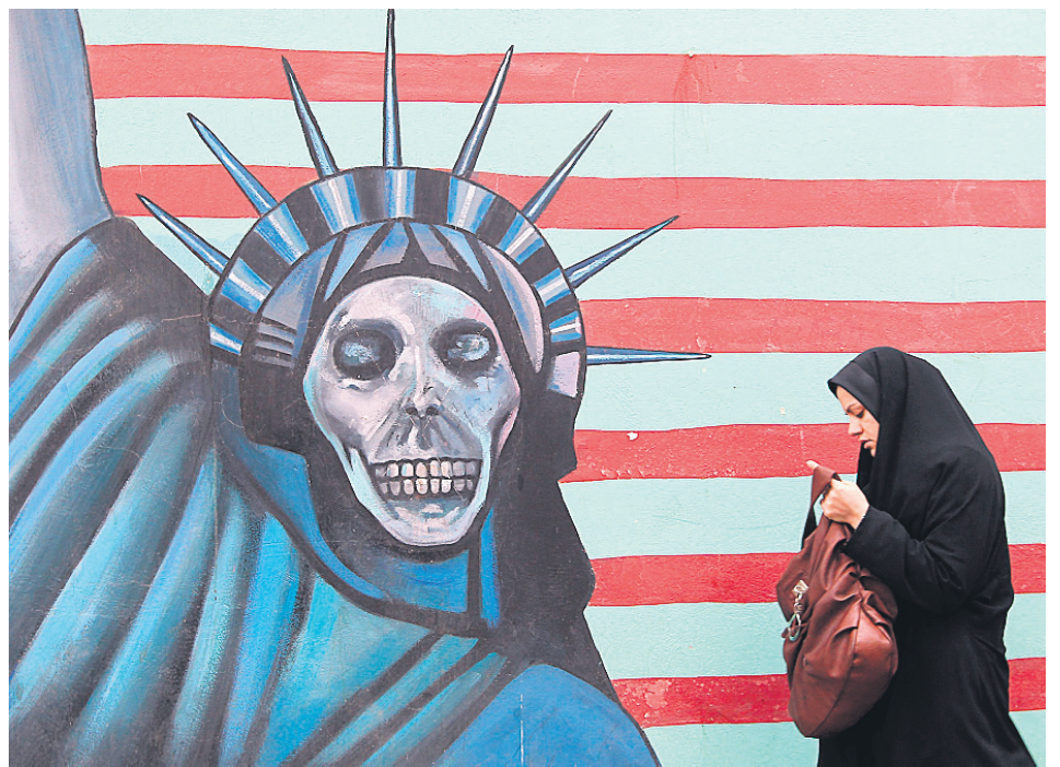
Une Iranienne passe devant une murale peinte sur les murs de l'ancienne ambassade des États-Unis à Téhéran. Les États-Unis, la Grande-Bretagne et le Canada comptent parmi les pays qui ont annoncé des sanctions à l'égard de la république islamique d'Asie.