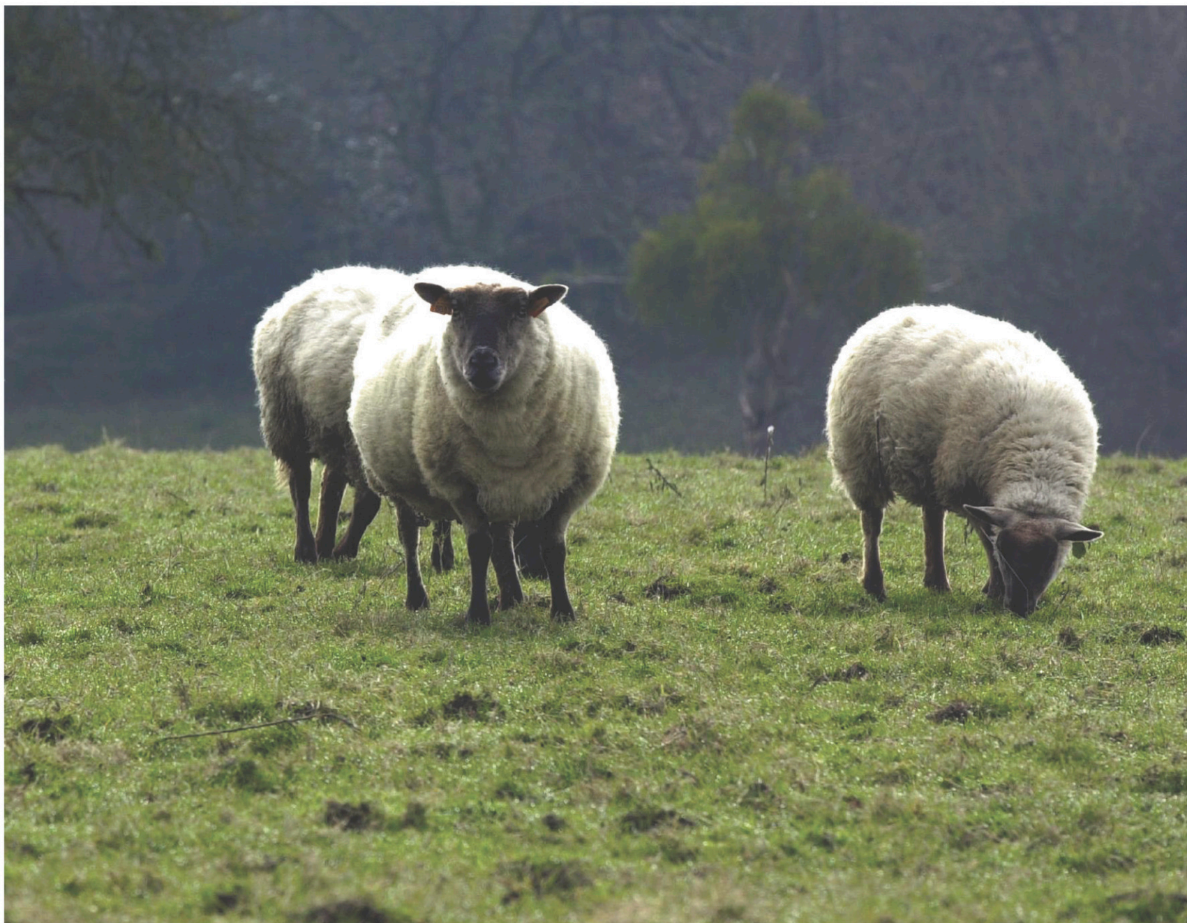
MICHELE DANIAU AGENCE FRANCE-PRESSE

chroniquefd@ledevoir.com Sur Twitter: @FabienDeglise