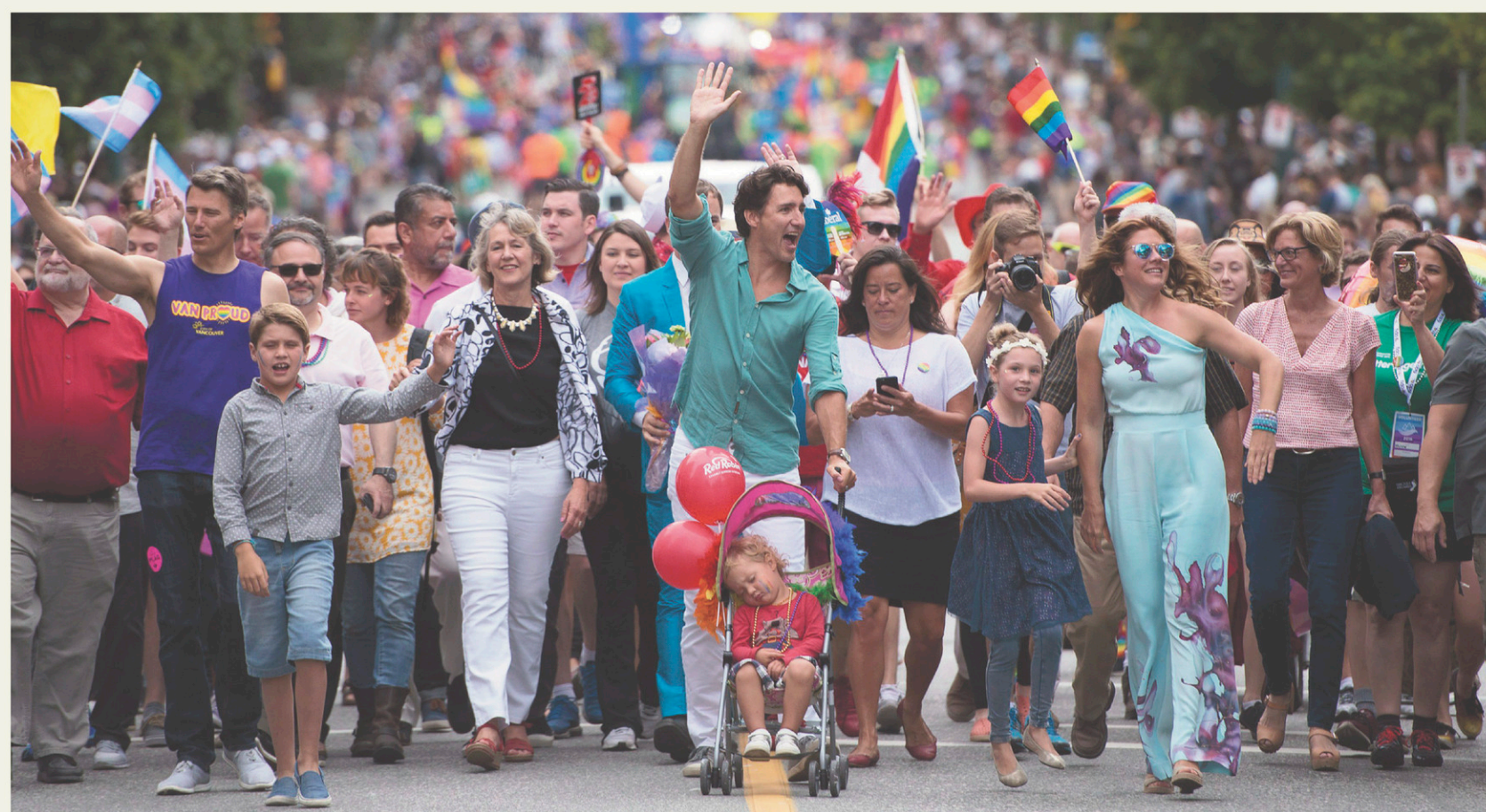
JONATHAN HAYWARD LA PRESSE CANADIENNE