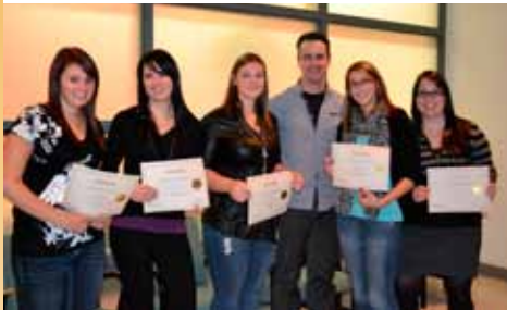
Gestion de commerces