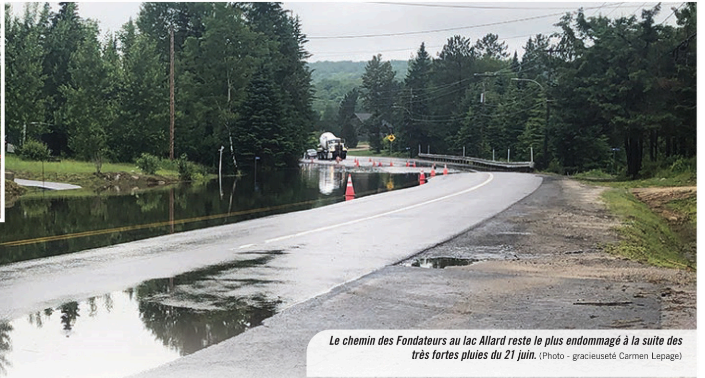
Le chemin des Fondateurs au lac Allard reste le plus endommagé à la suite des très fortes pluies du 21 juin.