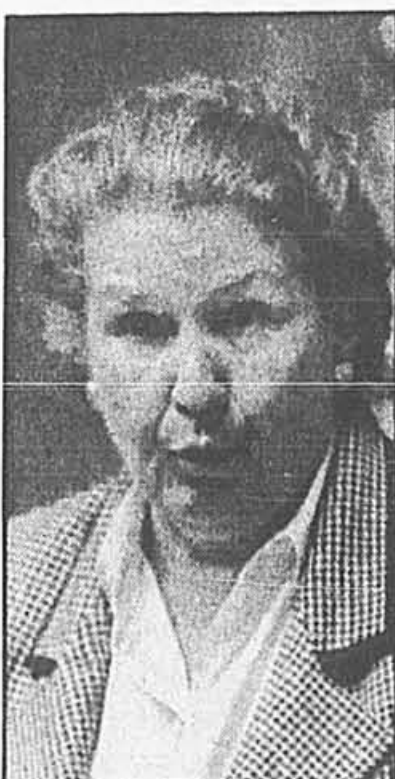
Le ministre de la Santé Thérèse Lavoie-Roux: des doutes sur les mérites de la privatisation