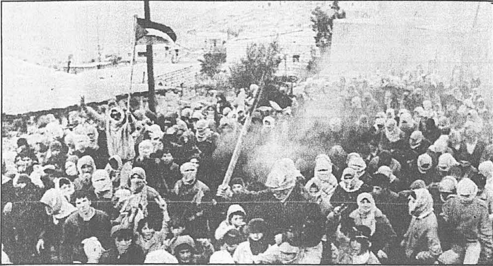
Des centaines d'habitants du village de Shuyukh ont envahi les rues pour protester contre la mort d'un jeune manifestant palestinien abattu par les soldats israéliens.

En outre, les dirigeants locaux ne semblent pas se préoccuper outre mesure de la situation dans les écoles, jardins d'enfants et universités. Leurs visites dans ces établissements « sont aussi rares que les apparitions du Christ », a noté avec ironie Ligatchev.