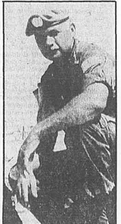
Richard Higgins PHOTO AP

À Jérusalem, des sources militaires israéliennes ont indiqué que sept miliciens de l'ALS ont été tués hier matin ainsi que quatre membres d'un commando chiite près de Jezzine. La patrouille de l'ALS a été prise dans une embuscade tendue par les miliciens d'Hezbollah, le Parti de Dieu, intégriste chiite, a-t-on précisé de mêmes sources.