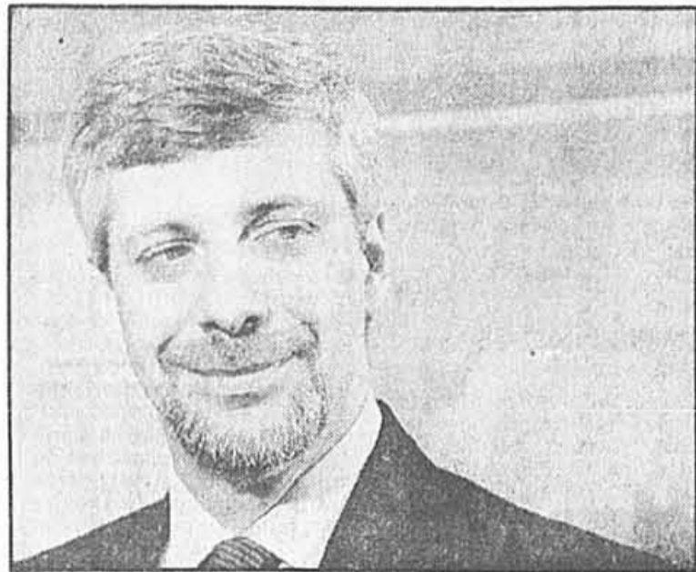
Pierre Marc Johnson