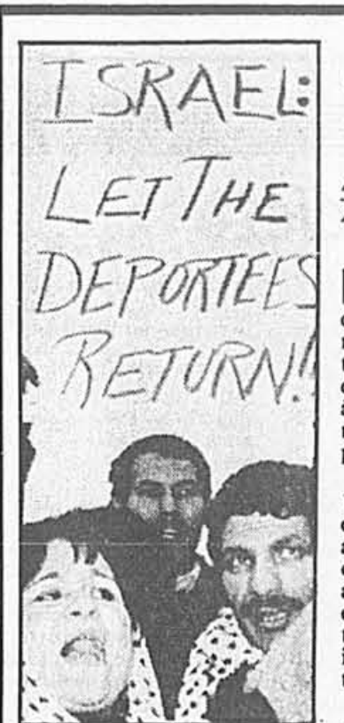
Des Palestiniens protestent devant l'ambassade américaine d'Athènes.

Dans l'ensemble, l'armée israélienne estime que l'intensité du mouvement d'insurrection commencé le 8 décembre a baissé depuis quelques jours, mais les notables palestiniens estiment qu'il ne s'agit que d'une pause: l'agitation devrait reprendre à un haut niveau à l'occasion de la visite du secrétaire d'État George Shultz, la semaine prochaine.