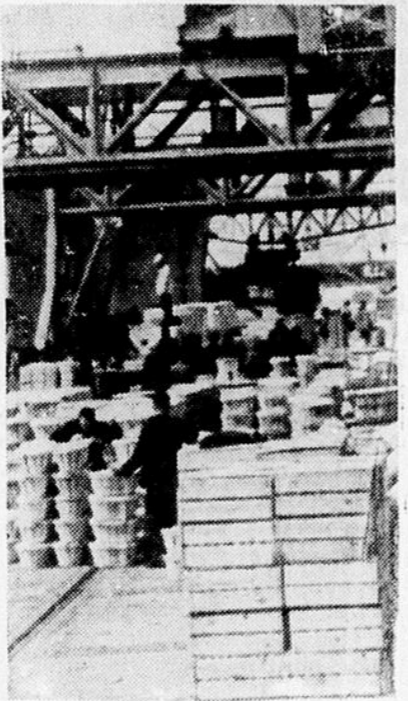
Sur les quais d'un port de l'Empire Français, embarquement des caisses de premiers à destination de la métropole.