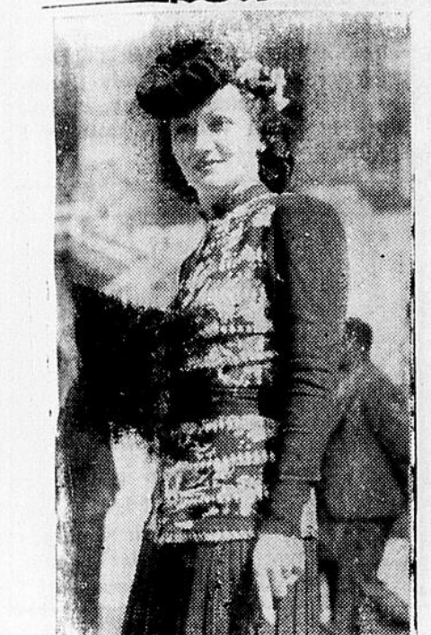
Mode française. Censure n° 81058