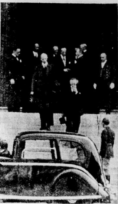
Conseil suprême à Paris.

Londres.—Bien des rumeurs de disettes ont fait naître dans la propagande allemande, toujours prête à accrocher ses espérances aux moindres balivernes, l'idée que l'Angleterre était au bord de la famine. A Londres, une vieille dame du meilleur monde a été très surprise de recevoir d'amis américains un colis de produits alimentaires; au second colis, elle a protesté; au troisième, elle a envoyé un télégramme. Que signifiait cette plaisanterie? Tout simplement que des amis américains avaient avalé la propagande de M. Goebbels. Il a fallu donner toute cette mangeaille inutile à une oeuvre de charité.