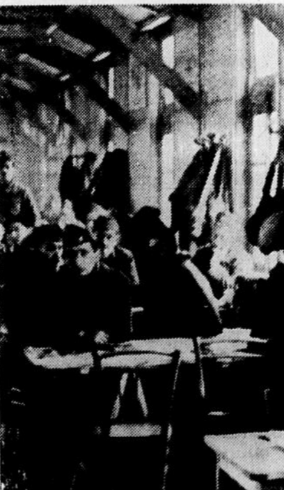
Dans une gare régulatrice française. En attendant le départ de leur train, les permissionnaires se reposent au foyer du soldat.