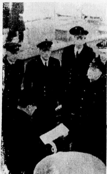
L'équipage d'un destroyer norvégien réuni sur le pont, écoutant les ordres communiqués par l'officier de service. Cliché O.C.P.I. Censure no A. 7310.

Nous sommes assurés qu'une si belle fête ne restera pas sans résultats heureux, pour le grand bien de la paroisse.