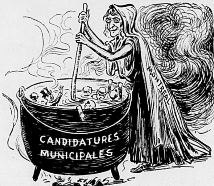
Scène que l'on voit de temps en temps.