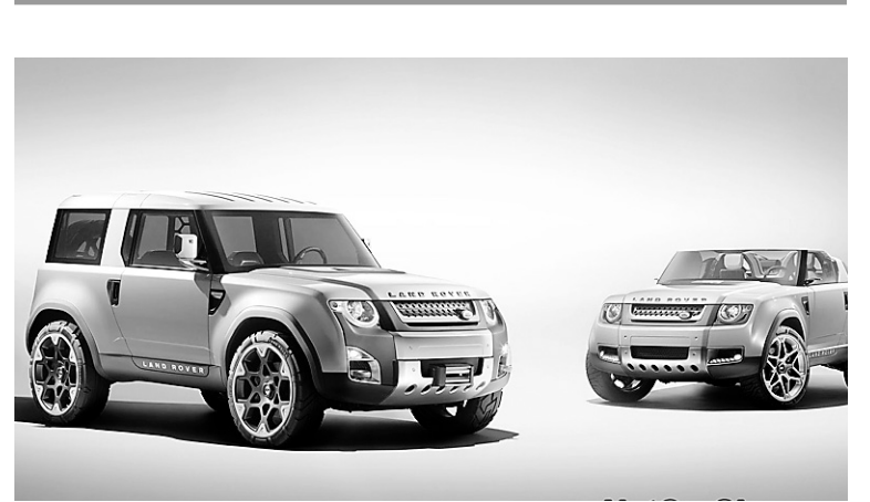
Les prototypes DC100 pourraient servir de base à de nouveaux Land Rover.