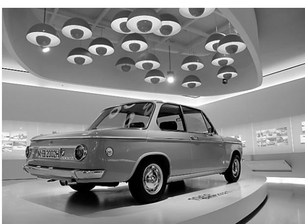
La BMW 2002ti de 1968 est le modèle qui a défini ce que le constructeur est devenu aujourd'hui.