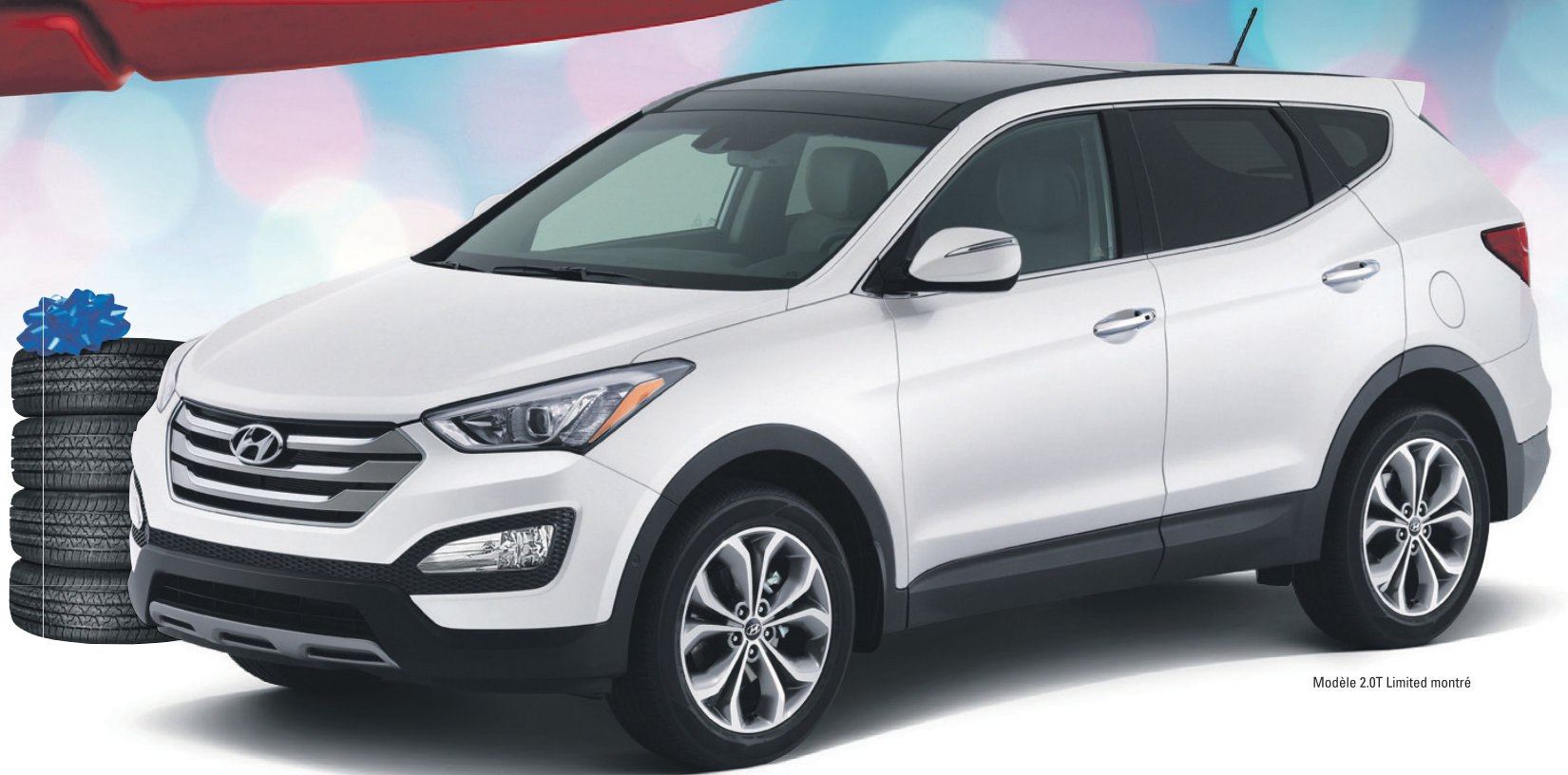
Modèle 2.0T Limited montré