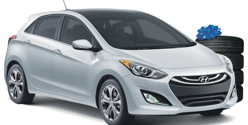
Modèle SE avec ensemble Tech. montré