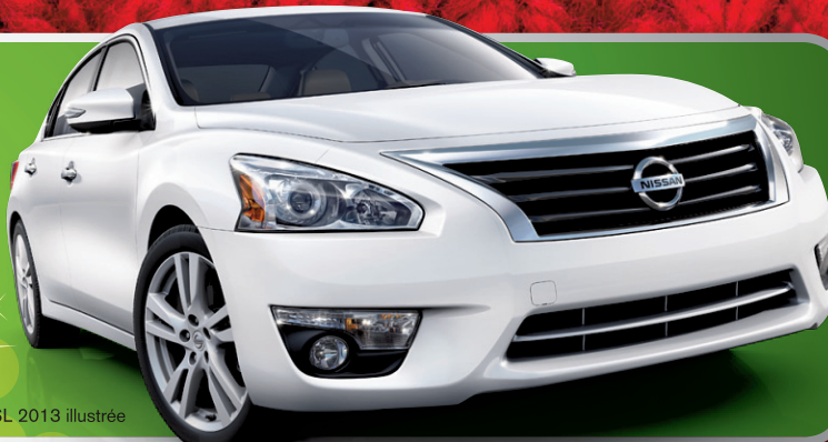
Berline Altima 2.5 SL 2013 illustrée

JUSQU'À 1360 KM SUR ROUTE AVEC UN SEUL PLEIN 3