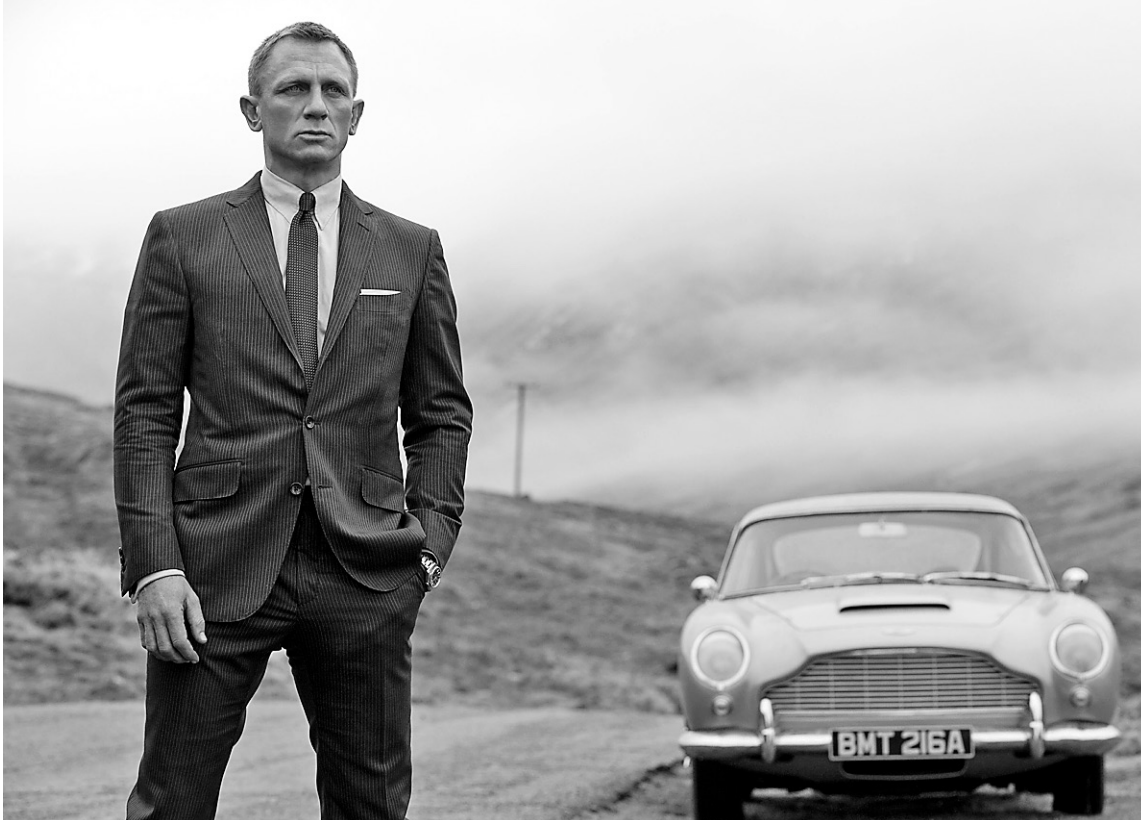
Daniel Craig, qui incarne James Bond, s'enfuit à bord d'une Aston Martin 1963 couleur argent dans Skyfall .

On vous laisse découvrir l'intrigue en voyant le film, mais dans Spyfall , Bond fuit avec sa patronne, la très matriarcale et autoritaire agente M (interprétée par