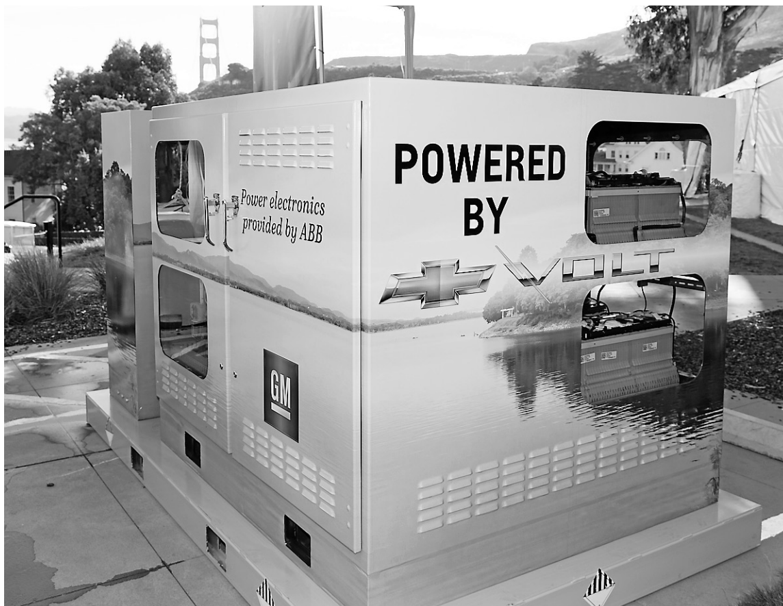
GM et ABB ont utilisé cinq batteries de Chevrolet Volt mises en série dans un prototype modulaire capable de fournir de l'électricité durant deux heures à un groupe de trois à cinq maisons unifamiliales moyennes aux États-Unis.

On n'en est pas encore là, mais GM et ABB ont quand même démontré la viabilité technique du concept en installant leur prototype entre la fin du réseau local et une maison située à l'extrémité d'une rue résidentielle de San Francisco. Quand on a coupé le courant en amont du système d'urgence, ses cinq batteries de Volt usagées ont fourni 25 kW de puissance et 50 kWh d'énergie, fournissant toute