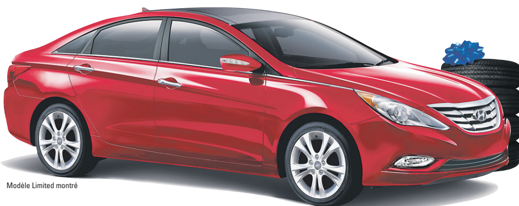
Modèle Limited montré

MEILLEURE PETITE VOITURE (DE PLUS DE 21 000 $)