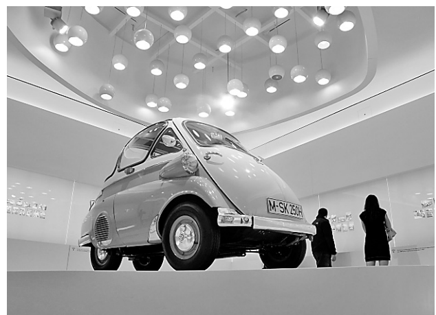
L'Isetta, produite sous licence par BMW à partir de 1955, a permis le sauvetage du constructeur allemand.