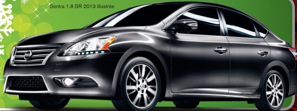
Sentra 1.8 SR 2013 illustrée

JUSQU'À 1020 KM SUR ROUTE AVEC UN SEUL PLEIN 3