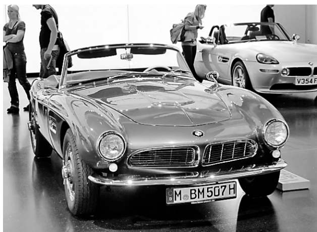
Le rarissime roadster 507 occupe le centre de l'étage inférieur du musée.

Plusieurs salles du musée BMW font une belle place à l'héritage du constructeur dans les sports motorisés.