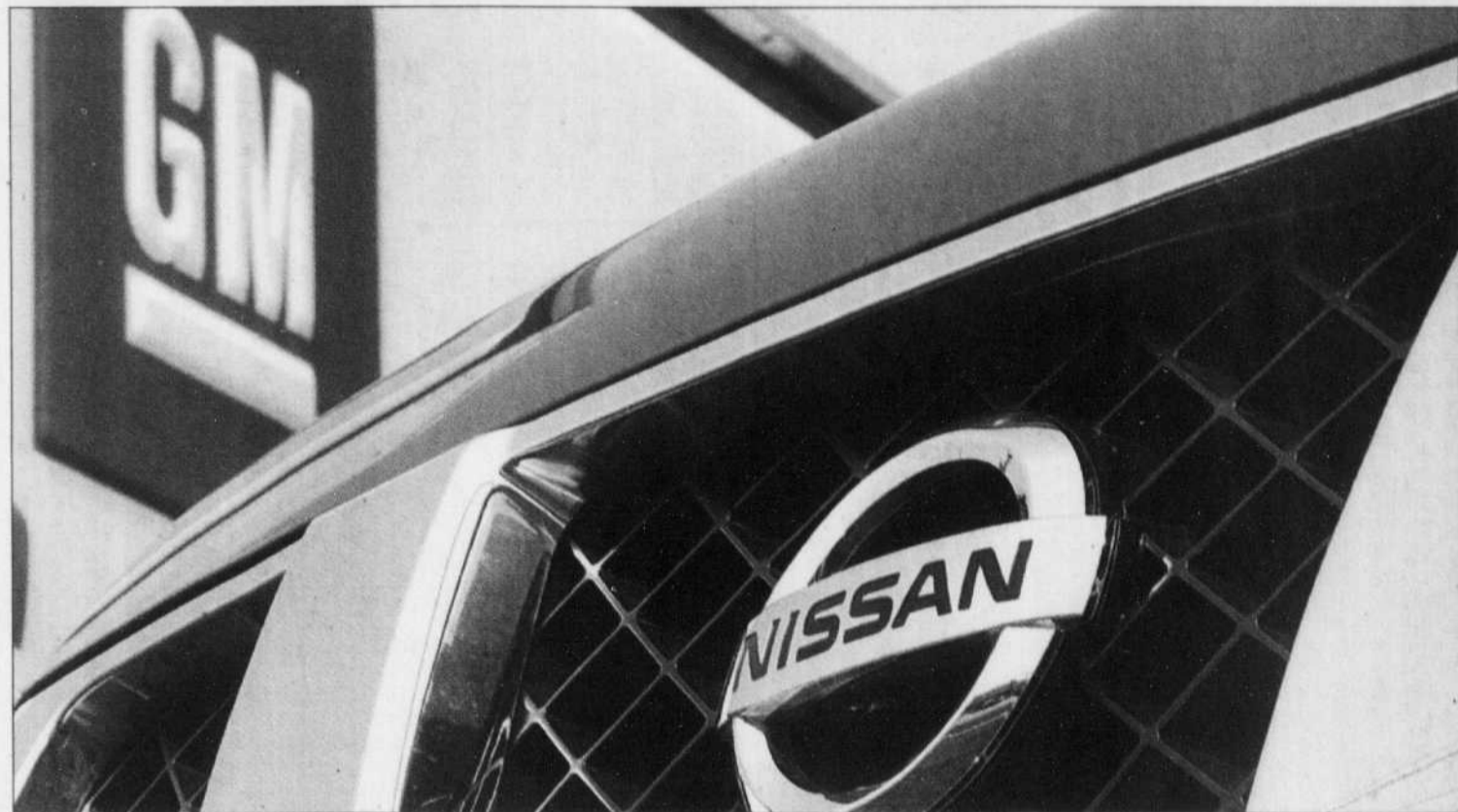
Le groupe Renault-Nissan estime que les conditions sont désormais réunies pour démarrer les «discussions exploratoires» sur une possible alliance avec l'américain General Motors.