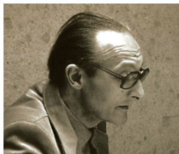
Le philosophe et journaliste français André Gorz (1927-2007), cofondateur du Nouvel Observateur , oppose au «capitalisme vert» un écosocialisme, également hostile au néolibéralisme et au socialisme autoritaire des modèles soviétique et chinois.

L'exemple de la filière des gaz de schiste est frappant à cet égard. Bien qu'elle semble procéder d'un choix technique, elle provient plutôt d'une orientation politico-économique: elle prévoit une croissance toujours plus élevée des besoins d'énergie (au lieu de programmes d'efficacité énergétique), privilégie la concentra-