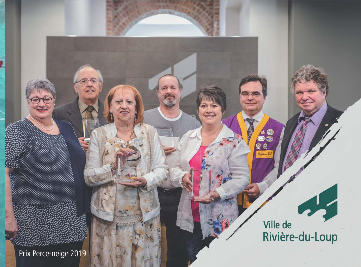
Prix Perce-neige 2019