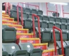
2 e phase (2019) — installation de rampes sécuritaires