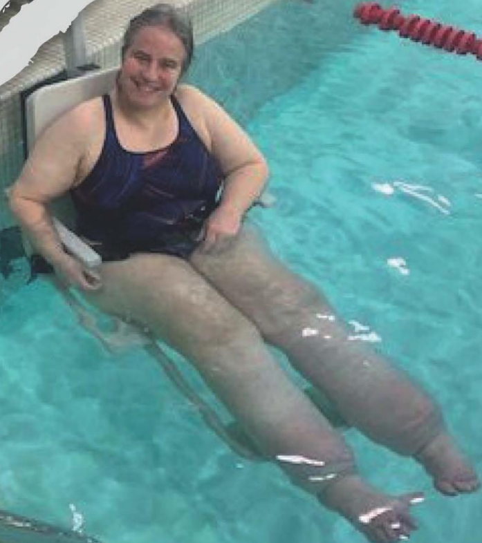
Lève-personne, Cégep de Rivière-du-Loup

Conformément à l'article 61.1 de la Loi assurant l'exercice des droits des personnes handicapées en vue de leur intégration scolaire, professionnelle et sociale