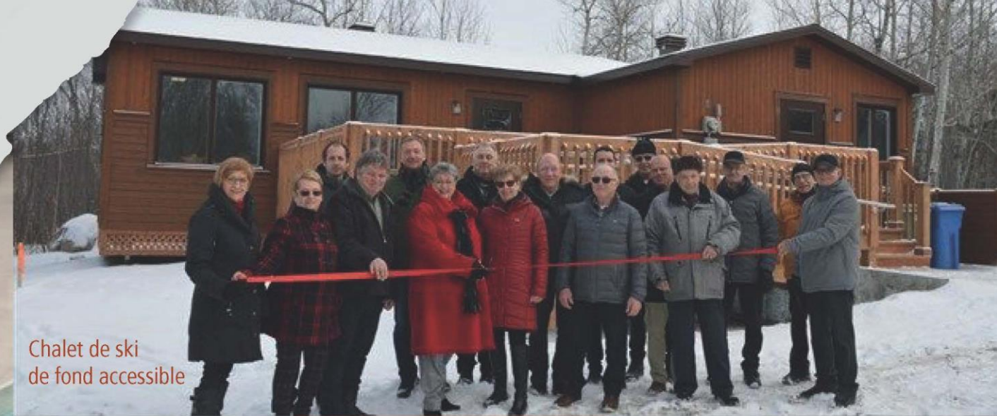
Chalet de ski de fond accessible