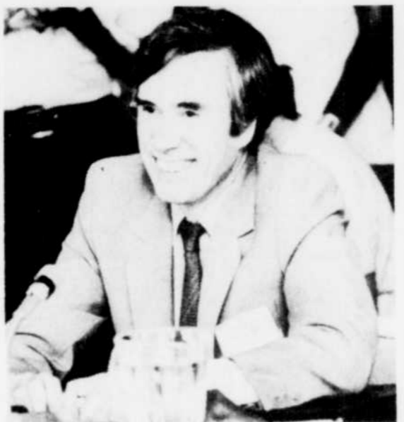
Le ministre canadien Mark MacGuigan

Le ministre des Affaires extérieures, M. Mark MacGuigan, est revenu enchanté de la réunion.