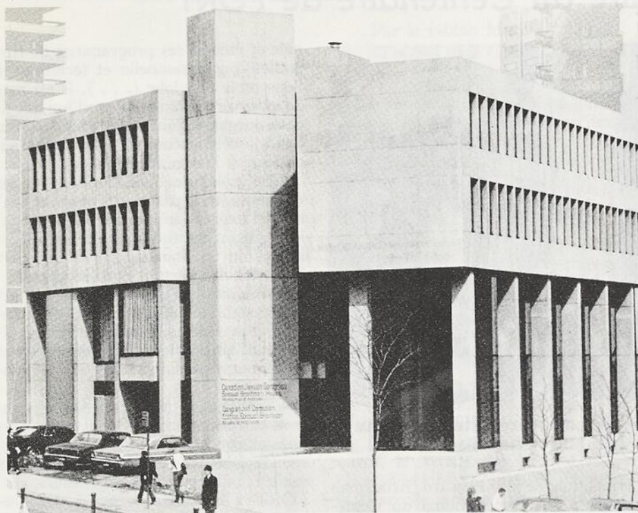
Samuel Bronfman House

pouvoir soumettre un mémoire au Gouvernement du Canada ainsi qu'à d'autres organismes et aussi à propos de la réunion de Madrid en 1980 lors de la Conférence sur la sécurité et la coopération en Europe (Accord d'Helsinki). Il ne faut pas également oublier de mentionner les activités régionales au cours des campagnes d'élection 1979-80.