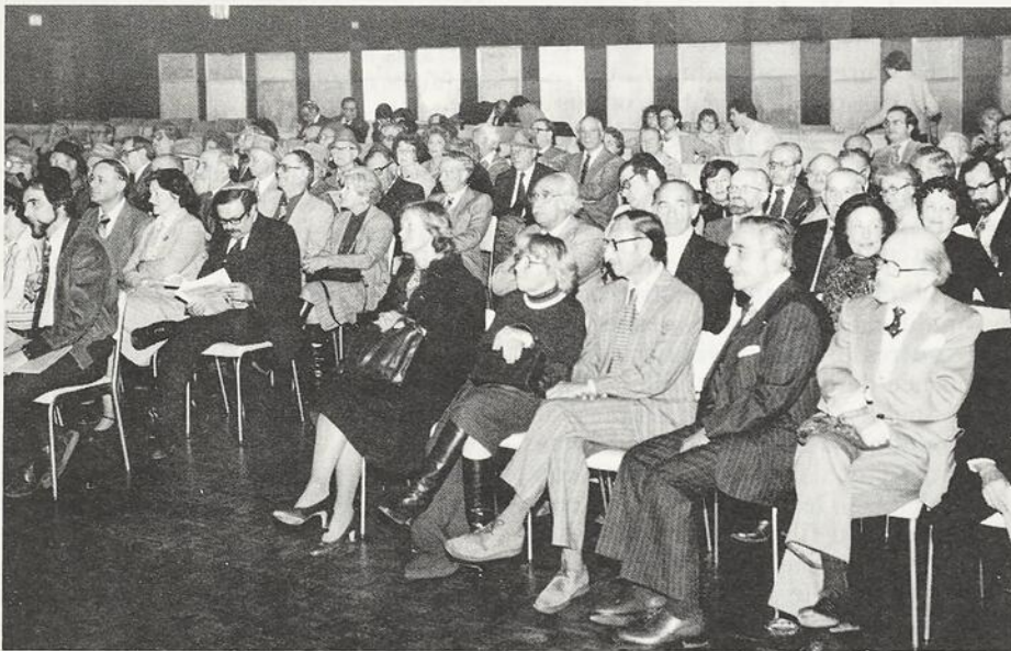
Vue d'ensemble de la salle lors de l'élection du nouveau Président, Région du Québec