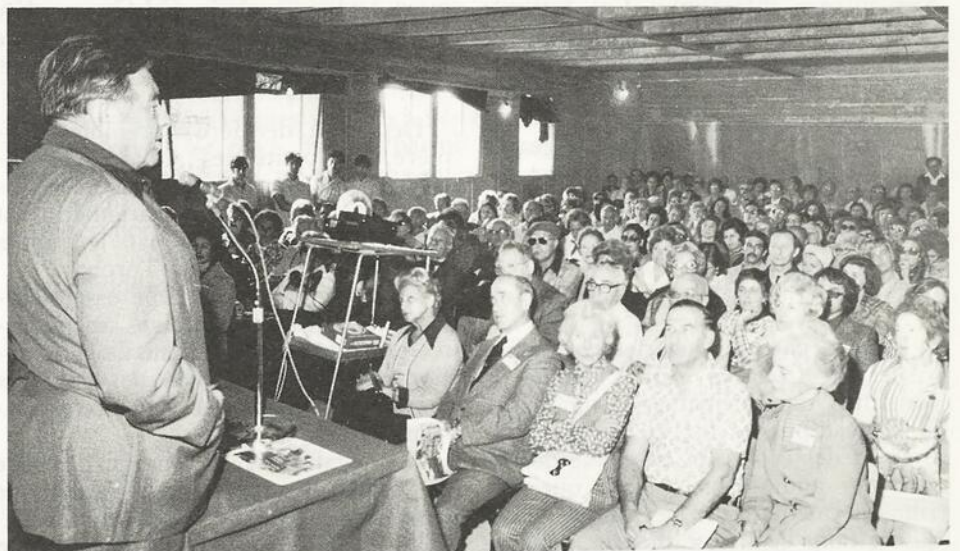
Cérémonie de participation des Canadiens dans le cadre de l'école des ingénieurs de l'ORT.