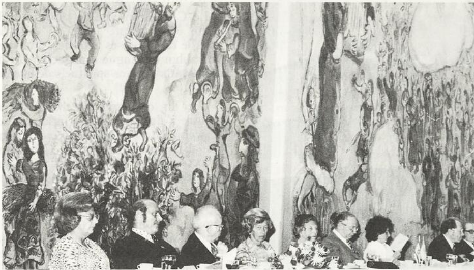
Membres de l'ORT en réunion. La toile de fond représente un tableau du célèbre peintre dessinateur et graveur Juif Marc Chagall.

Un siècle consacré à aider les gens en passant de la formation spécialisée à l'acquisition d'indépendance et à la contribution aux membres de la société, tel est le sceau de l'ORT : Organisation de Réhabilitation par la Formation.