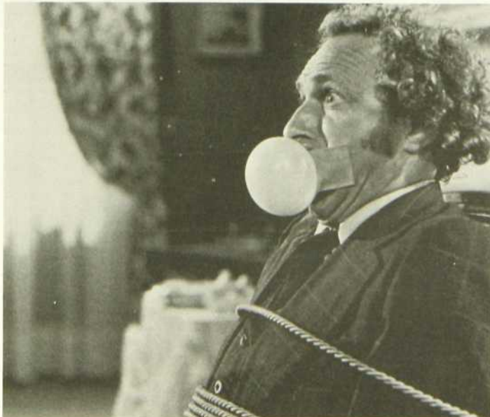
La Course à l'échalote

Ce programme est établi à l'heure locale