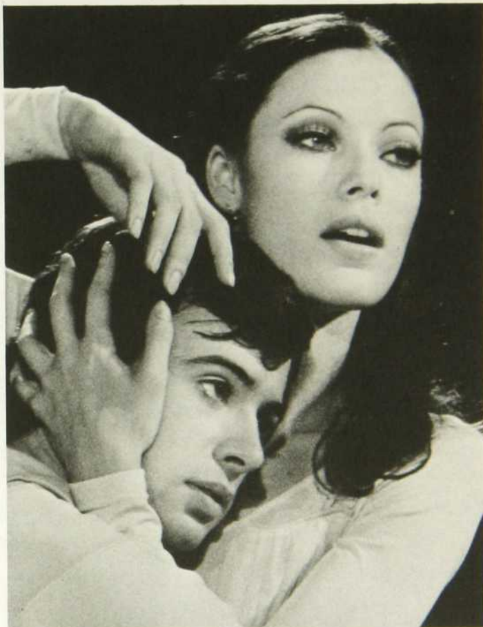
Karen Kain et Frank Augustyn

Dame-de-la-Garde, avant de visiter le port et d'entrer dans une classe de ballet où Karen Kain tient la vedette.