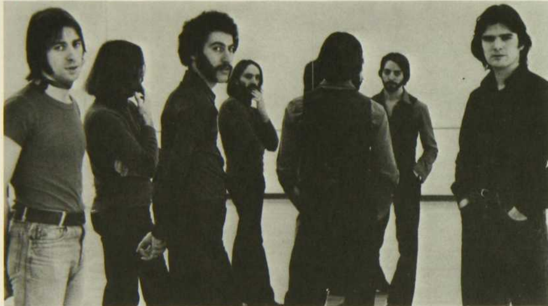
Le groupe Octobre