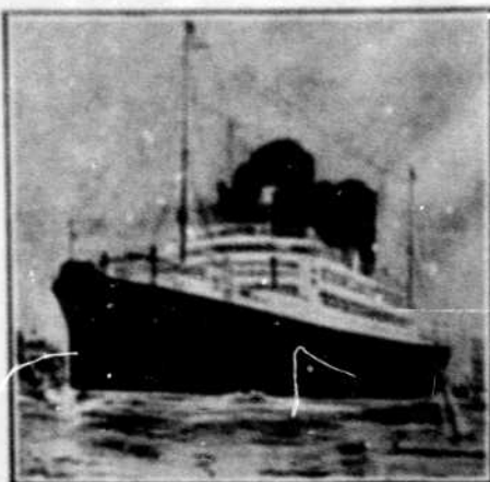
Le nouveau navire "Andania".

LIVERPOOL, Pier Head. LONDRES, 51 Bishopgate, E.C. 29 Cockspur St. S. W. PARIS, 37 Boul. des Capucins.