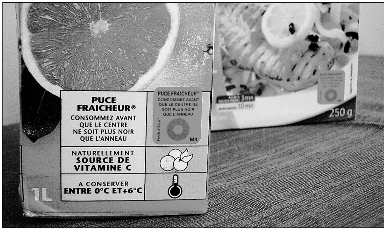
Les étiquettes de Temptime Corporation sont utilisées par la chaîne française de supermarchés Monoprix.

De son côté, Toxin Alert, une compagnie ontarienne, développe une sorte de test de grossesse... pour la nourriture. Son emballage est muni de capteurs biochimiques. Le capteur biochimique le plus connu des gens est le test de grossesse qu'on trouve en pharmacie.