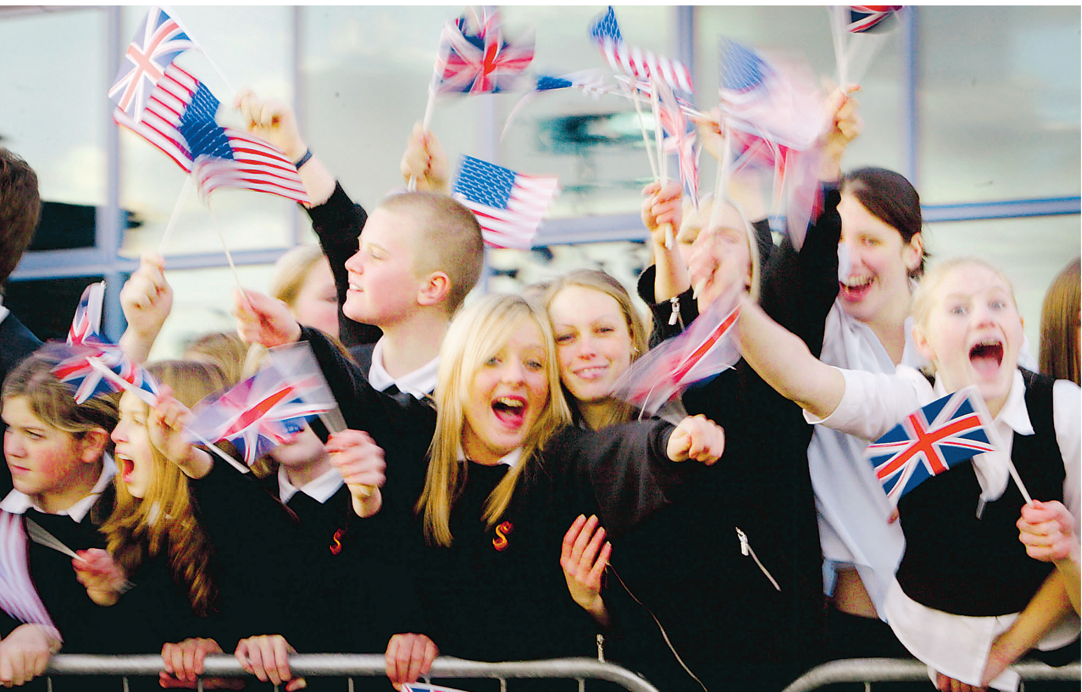
En juin, le groupe américain Silver Ring Thing entreprendra une tournée en Grande-Bretagne pour promouvoir l'abstinence sexuelle chez les adolescents.