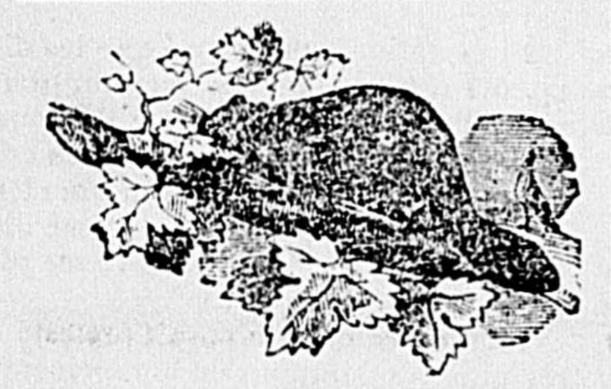
TROIS-RIVIÈRES, 20 FÉVRIER 1871.