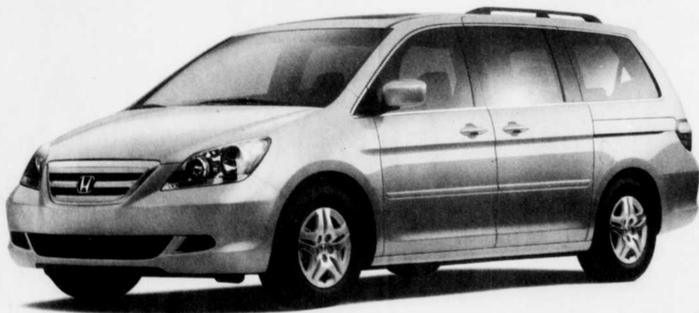
Odyssey EX-L illustrée

C'est vraiment le vaisseau familial par excellence – Guide de l'auto 2006