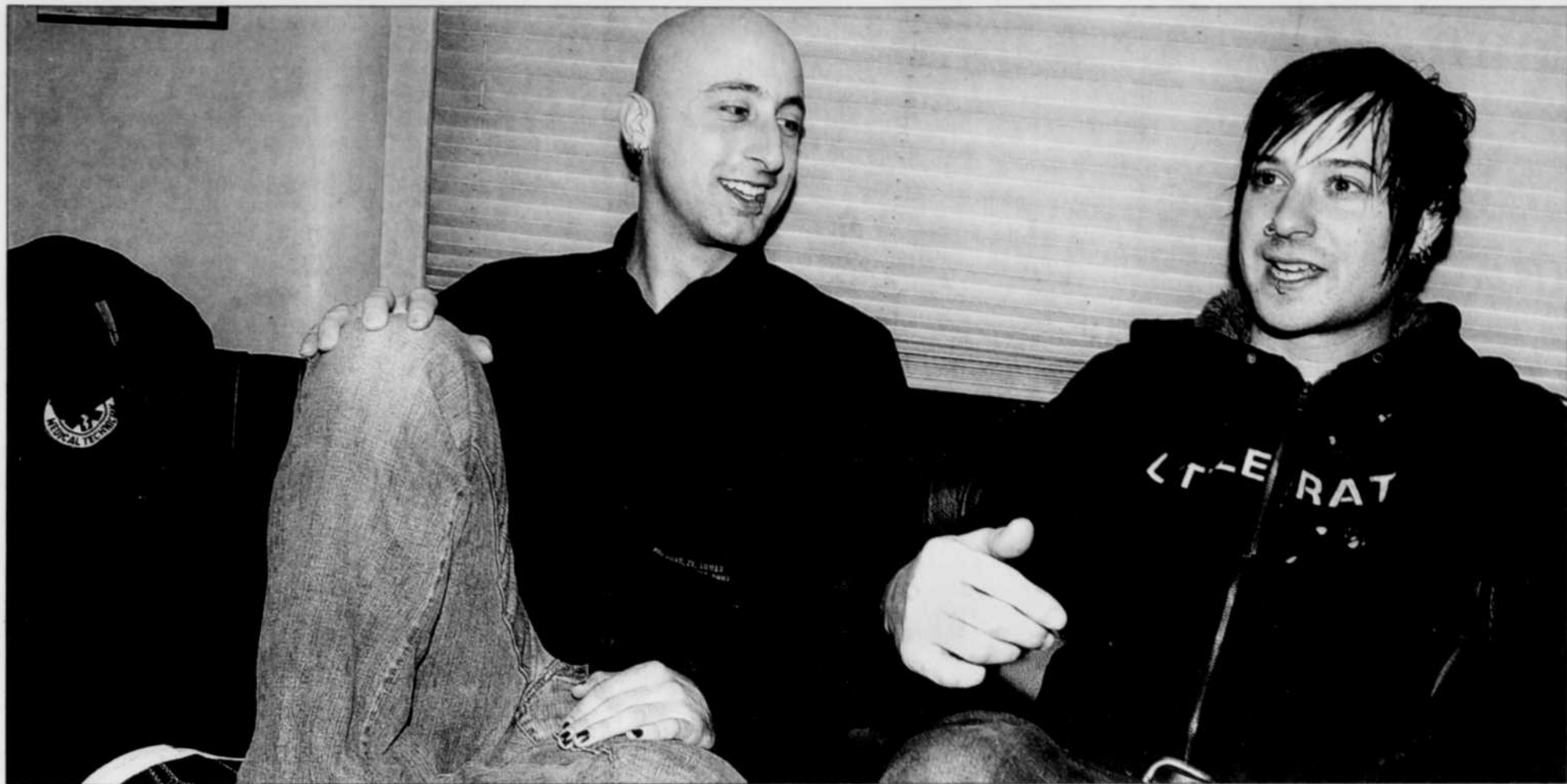
Après 15 mois de tournée passé à parcourir le monde, le guitariste Jeff Stinco et le bassiste David Desrosiers ne seront pas fâchés de revenir à la maison à la mi-décembre.