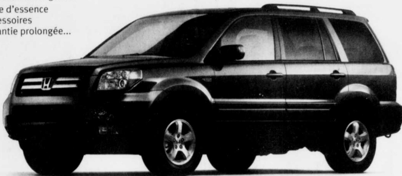
Pilot EX-L illustré

Bien équipée, beau comportement routier, habitacle spacieux et confortable – Annuel de l'automobile 2006