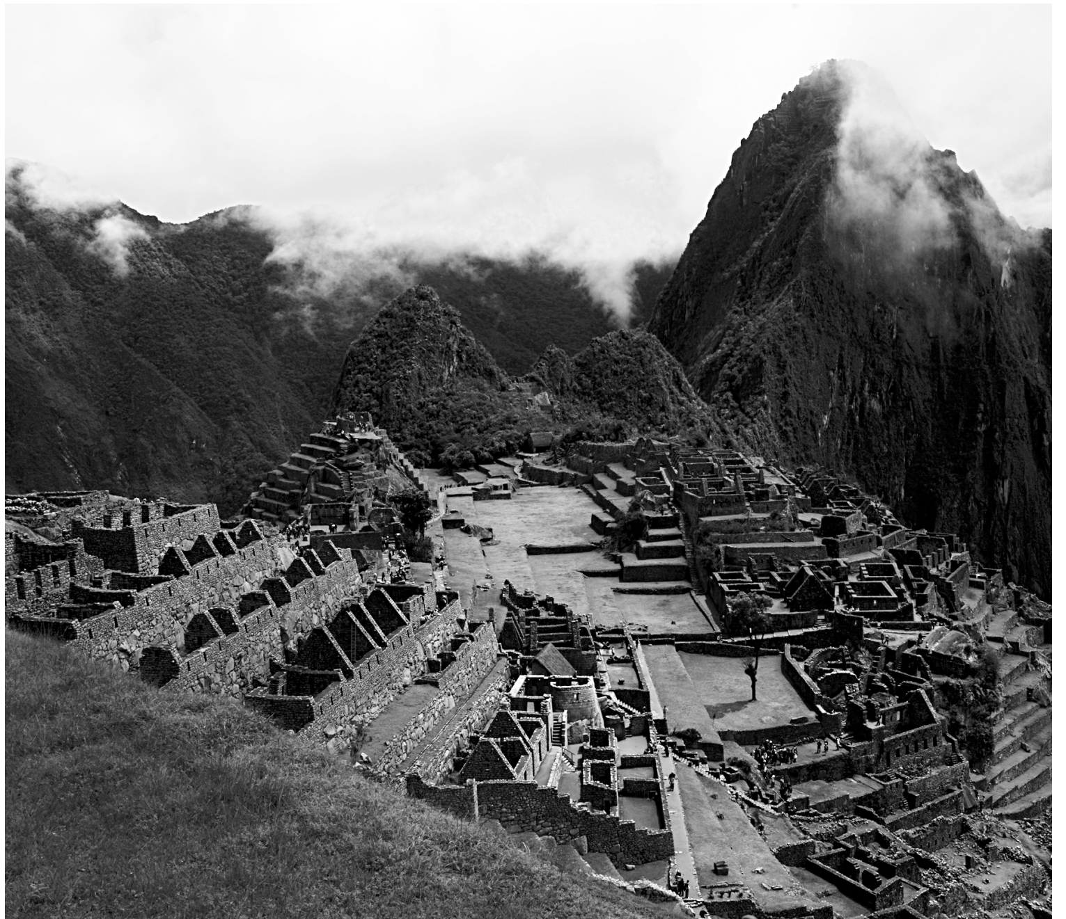
La citadelle de Machu Picchu, perchée sur un promontoire rocheux à 2430 mètres, est considérée comme une œuvre maîtresse de l'architecture inca du XV e siècle. Elle figure depuis 1983 au patrimoine mondial.