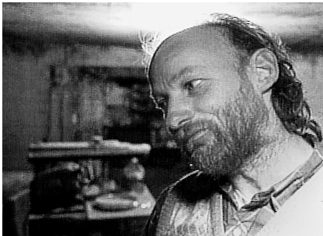
Pickton, un éleveur de porcs de Port Coquitlam, en Colombie-Britannique, a été reconnu coupable en décembre 2007 du meurtre au second degré de six femmes dans la région de Vancouver.

La défense de Pickton avait alors argué que la réponse du juge au jury laissait place à une condamnation de son client sans qu'elle ait la chance de le défendre correctement, puisque la poursuite de la Couronne repo-