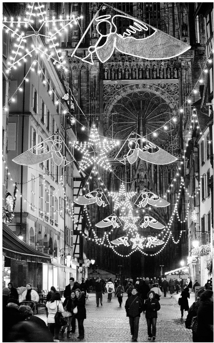
Strasbourg, en Alsace, s'autoproclame capitale de Noël. Et pour cause : son marché de Noël, qui regroupe en fait 11 marchés de denrées et d'objets autour de la cathédrale, fait courir les foules depuis 1570.