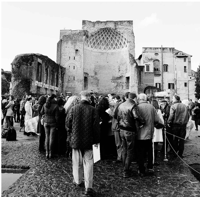
Le temple de Vénus et Rome, construit au II e siècle, se situe au cœur du Forum romain, près du Colisée.

Des statues gigantesques ornaient les deux temples : Roma faisait face au Forum, tandis que