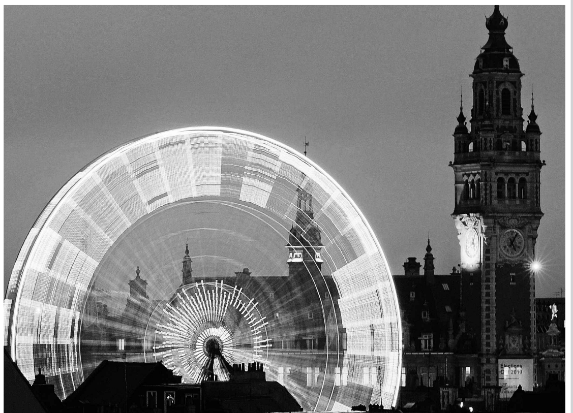
Dans le nord de la France, la ville de Lille déploie sa grande roue pour célébrer les Fêtes.

Des Champs-Élysées de Paris à l'Alexander Platz de Berlin, en passant par Bergen et Bucarest, les fêtes de fin d'année donnent lieu à des célébrations colorées en Europe. En voici quelques exemples.