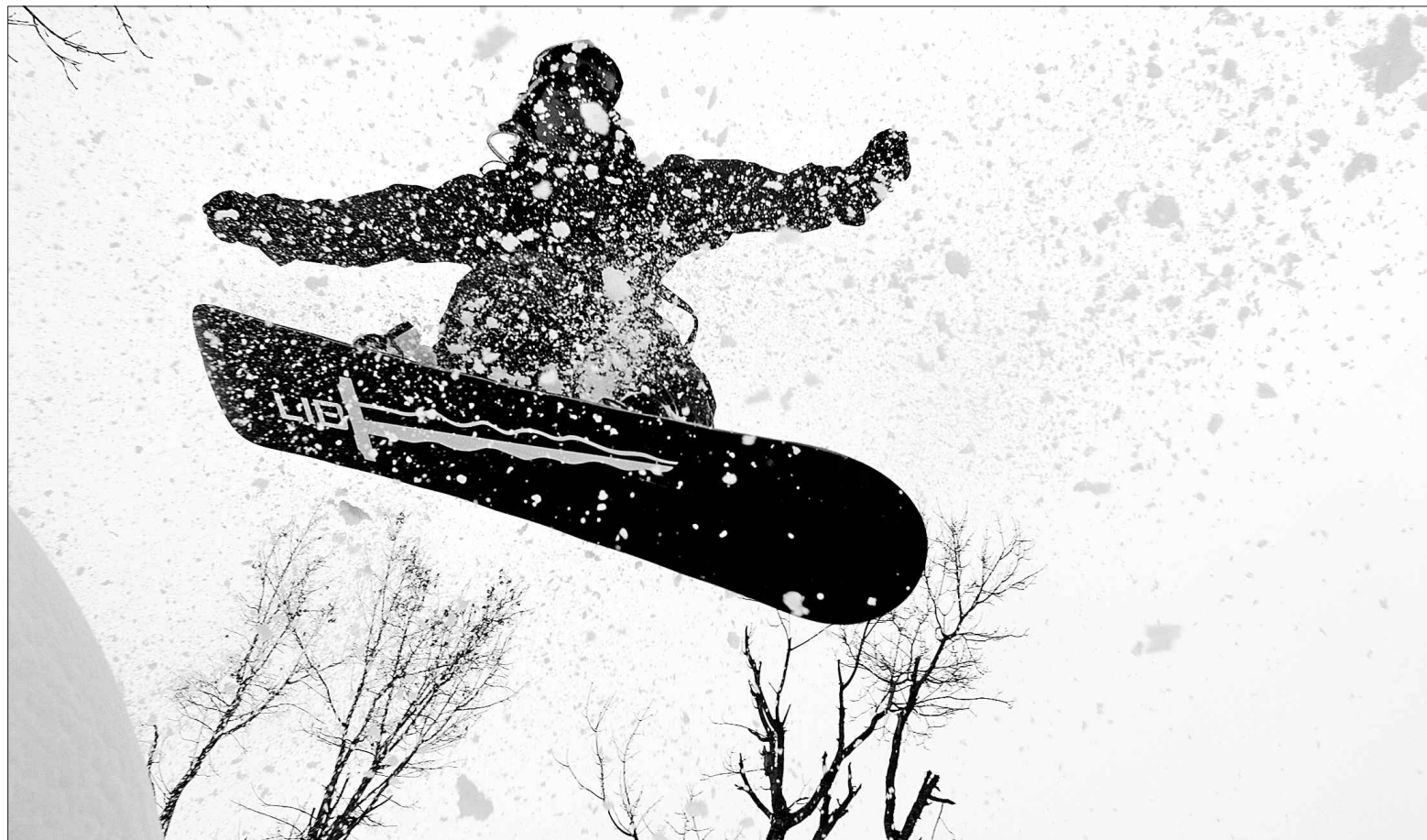
En dépit des efforts des stations de ski pour se prémunir contre les aléas de la nature, la météo demeure un facteur clé dans le désir d'aller skier. Et s'il y a des écarts entre les prévisions des bulletins météo et la réalité, les conséquences sont fâcheuses pour les stations.

Début décembre, les principaux centres de ski ouvrent leurs portes. Bien sûr, la grande majorité a préalablement fabriqué de la neige à l'aide de systèmes d'en-