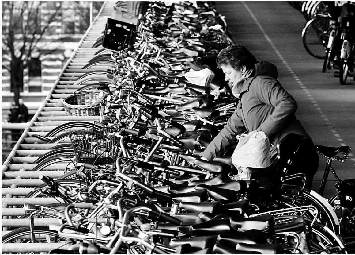
Quiconque a visité de grandes villes néerlandaises comme Amsterdam a remarqué les imposantes rangées de vélos stationnés près des gares. En fait, les Pays-Bas comptent 18 millions de bicyclettes pour 16,5 millions d'habitants.

Un cycliste sportif a ainsi été condamné le 17 juin à 80 heures de travaux d'intérêt général à la suite du décès d'une femme de 82 ans qu'il avait bousculée en la dépassant.