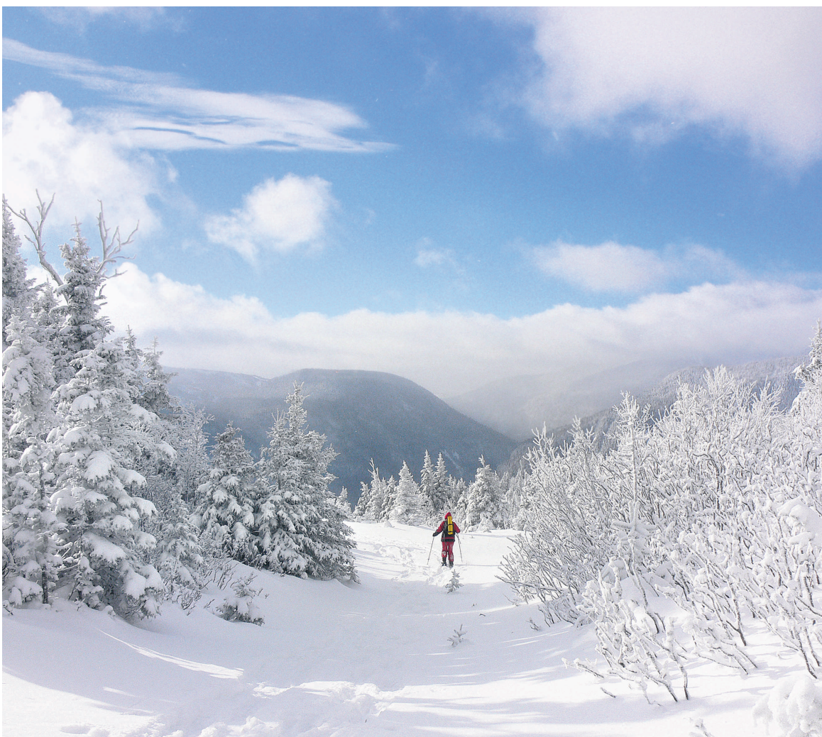
Les Chic-Chocs offrent à coup sûr un paysage enneigé pour les amateurs de sports d'hiver. L'an dernier, alors que l'hiver a été doux, la région a reçu six mètres de neige.