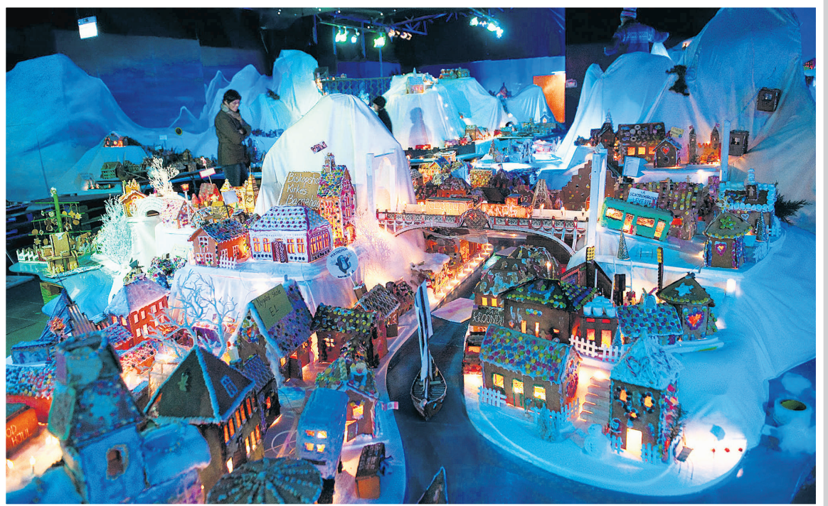
À Bergen, en Norvège, les touristes peuvent admirer un village de 1000 maisons... de pain d'épices!

OFFRE À DURÉE LIMITÉE. RÉSERVEZ AVANT LE 10 DÉC. 2010 ACHETEZ-EN 1, OBTENEZ LE 2 e à 1/2 PRIX