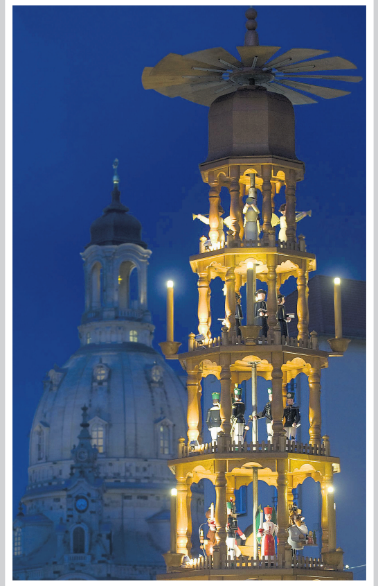
Haute de 14 mètres et toute en bois, la tour de Noël de Dresde se découpe devant la cathédrale de la Sainte-Trinité. Ce marché de Noël, qui se tient depuis 1434, serait le plus vieux du genre.