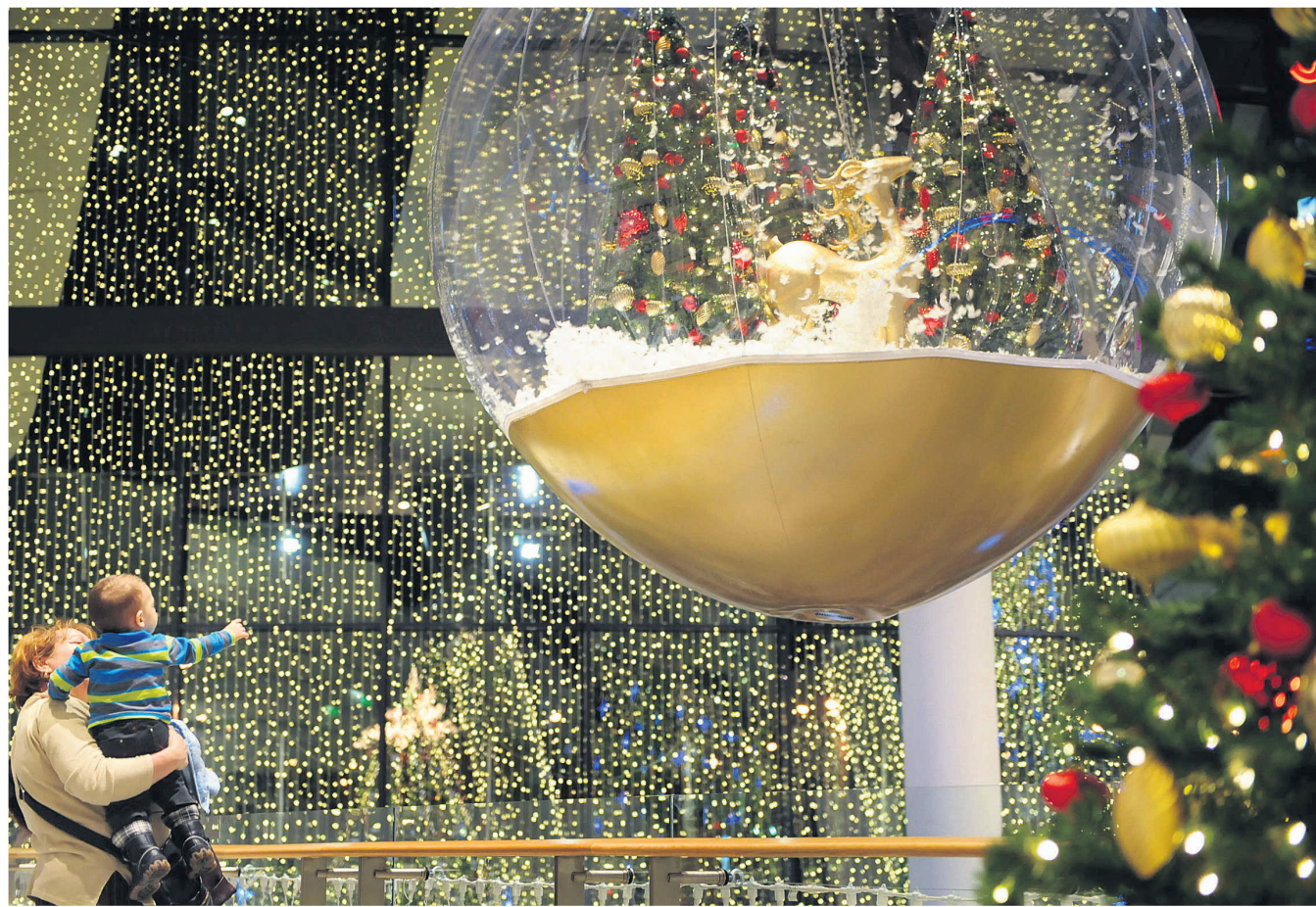
À Bucarest, un centre commercial s'est paré de tous ses feux pour s'inscrire dans le livre des records Guinness, avec un mur de lumières de 449 658 ampoules.