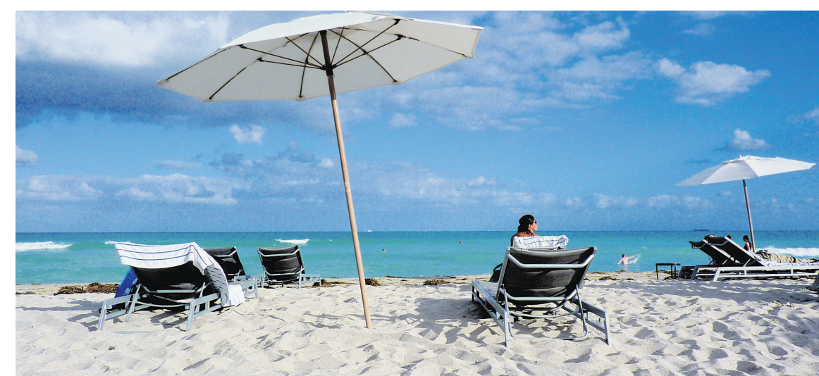
Un séjour à Miami serait incomplet sans une pause sur les plages de South Beach.