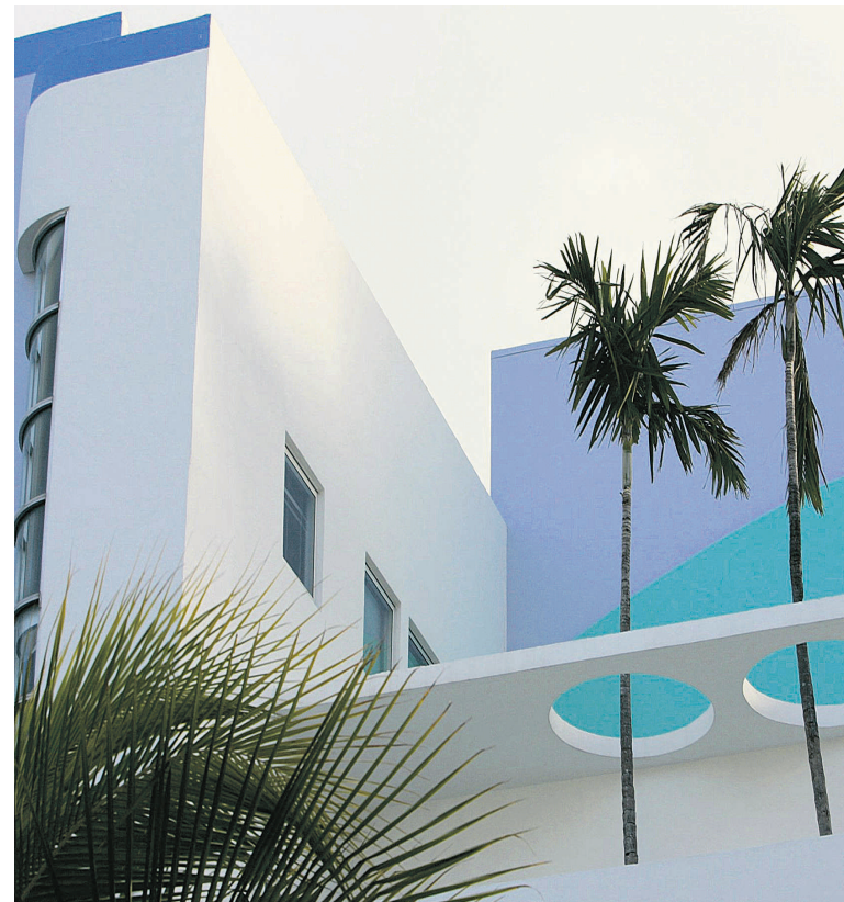
Le visage du centre-ville de Miami a radicalement changé ces dernières années; de vieux bâtiments ont été démolis pour faire place à des édifices design.