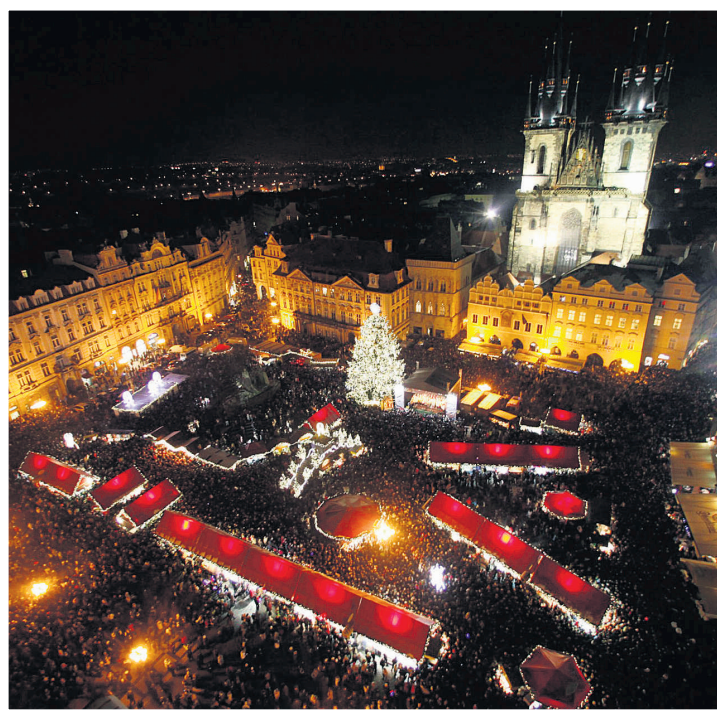
Dans la Vieille Ville de Prague se tient chaque année un imposant marché où l'artisanat tchèque est à l'honneur.