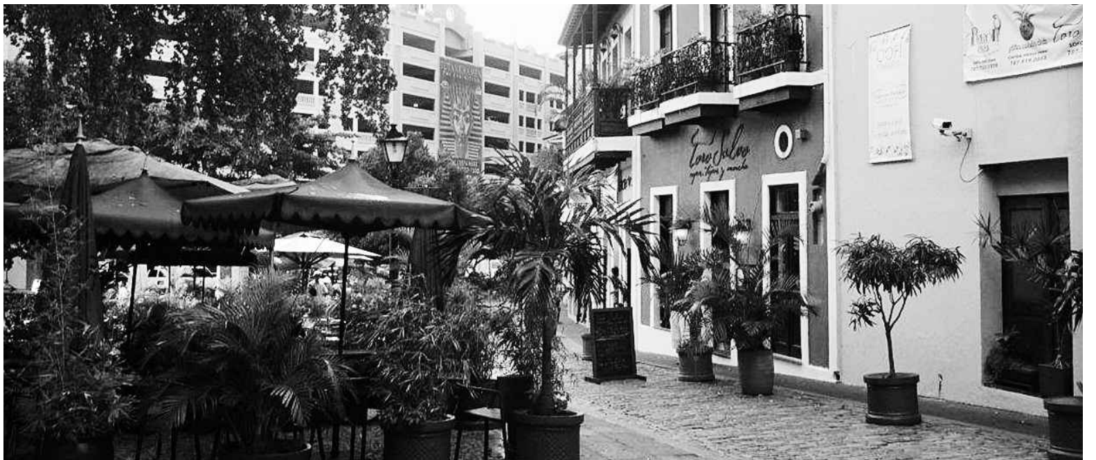
PHOTO DE LA PAGE PRÉCÉDENTE : le Vieux-Port de San Juan est plutôt récent, ayant été complètement réaménagé pour mieux recevoir les croisiéristes à la fin du XX e siècle. CI-DESSUS : une belle petite place typique du Vieux-San Juan; Colon Plaza ou place Christophe-Colomb, en l'honneur du fondateur de la ville. Les maisonnettes colorées et les balcons brodés de fer forgé font tout le charme de la ville.

Mais là où la comparaison devient plus intéressante, c'est lorsqu'on sait que le Vieux-San Juan est une cité sur deux étages. Comme Québec. Qu'on y trouve deux citadelles ouvertes aux visiteurs dont une ressemble à s'y méprendre à celle de Québec, soit celle de San Filipe del Morro; qu'on y parle deux langues officielles dont l'anglais mais que c'est l'espagnol qui prédomine partout, comme le français à Québec; que la monnaie portoricaine, le dollar américain, est maintenant au pair avec la monnaie québécoise, le dollar canadien; que la religion catholique est de très loin la plus populaire; que les petites rues du Vieux-San Juan sont autant pentues que celles du Vieux-Québec; que la ville est entourée de murs qui ressemblent énormément à ceux de Québec; que leurs voitures sont autant américaines que les nôtres; qu'on y décèle un petit mouvement indépendantiste qui aimerait bien voir un jour un Porto Rico libéré de toute entrave américaine; et que finalement, le maire de San Juan, Jorge Santini, est à peu près autant extroverti et apprécié que celui de Québec.