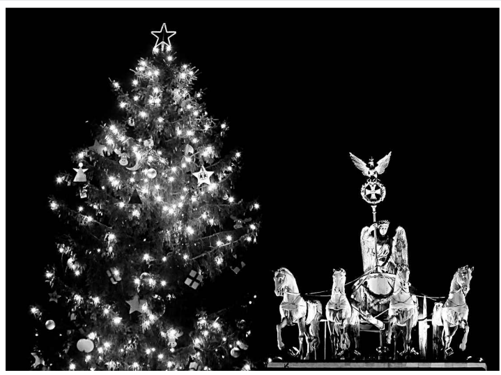
À côté de la porte de Brandebourg, à Berlin, s'élève un sapin de Noël géant.