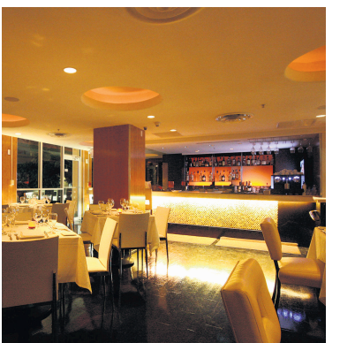
Le restaurant Ola se distingue dans la cuisine nuevo latino .

MIAMI — Quoi qu'en disent ses détracteurs, un séjour à Miami n'est pas complet sans une virée à South Beach. Puisque, en dehors des populaires boîtes de nuit, on y retrouve la plage, l'océan à perte de vue, les bâtiments art déco, d'excellents restaurants et des bars plus tranquilles. «Où manger?» et «où sortir?» sont les grandes questions que se posent chaque jour les visiteurs de South Beach, le quartier le plus branché de Miami Beach. Le choix ne manque pas. Cuisine cubaine, asiatique ou française, les restaurants sont nombreux et diversifiés.