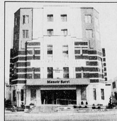
MANOIR SOREL 71, rue George (514)742-3303

PHASE III À Sherbrooke Vu la grande demande, nous avons ajouté de nouvelles unités de 3 1/2 avec porte patio et balcon disponibles à compter de maintenant. Déjà 85% de louées. Hâtez-vous!