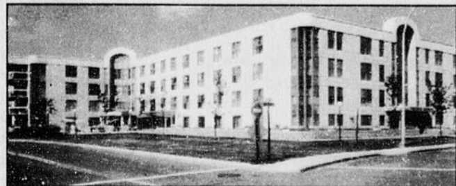
Manoir Boucherville 549, De Verrazano (514)449-1516

Des Vacances à l'année... à partir de 650$ occupation double 790$ occupation simple incluant 3 repas servis à volonté et toutes les commodités