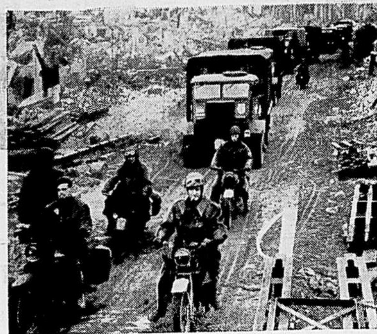
ENTREE DES BRITANNIQUES A STADTLOHN

L'ARGENT QUI NOUS PRO-FITE LE PLUS EST CELUI QUE L'ON DEPENSE CHEZ SOI.