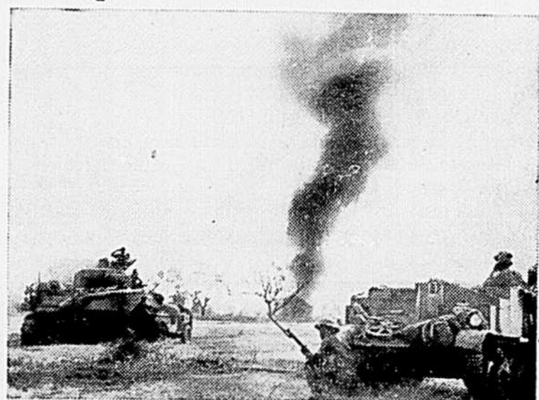
La photo montre des troupes britanniques motorisées en garde, tandis que la foule indigène regarde la fumée qui s'élève d'une explosion.

On peut obtenir copie de la nouvelle loi en s'adressant au bureau des publications, ministère de l'agriculture, Québec, au basse-cour, n'est pas tenu au classement de son produit. La McGill, Montréal.