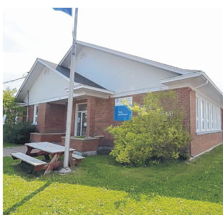
L'école Bon Pasteur de Sainte-Thérèse.