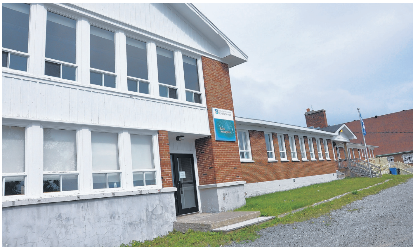
L'école de Val d'Espoir est fermée mais la CS entretient quand même le bâtiment.

Dans un document de la CS intitulé « Projet de modification d'acte d'établissement entraînant la