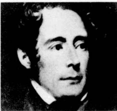
Alphonse de Lamartine