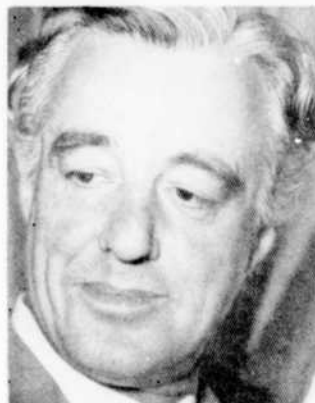
Vittorio de Sica