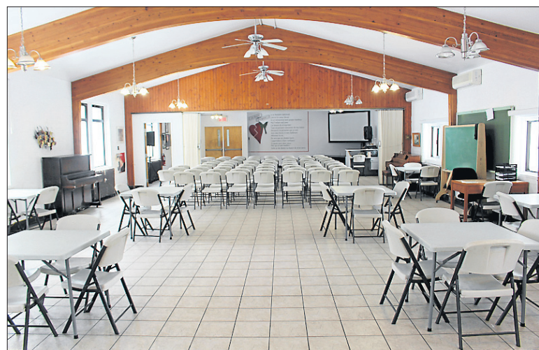
Un des lieux de regroupement des bénéficiaires de la Maison Carignan.

L'objectif principal est d'apporter un changement aux comportements d'assuétudes et par la suite d'apporter une aide quant à la réhabilitation sociale de l'individu. De plus, le fait d'apporter un changement au comportement de l'individu en lui faisant prendre conscience de ses comporte-