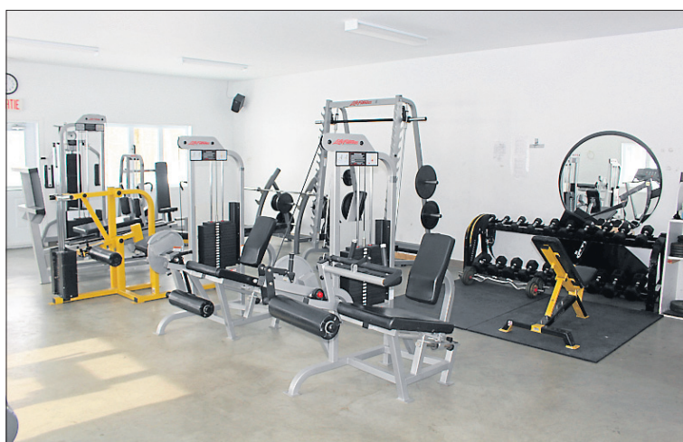
Le Pavillon Breen LeBoeuf abrite un centre d'entraînement bien équipé, servant à la remise en forme des résidents.