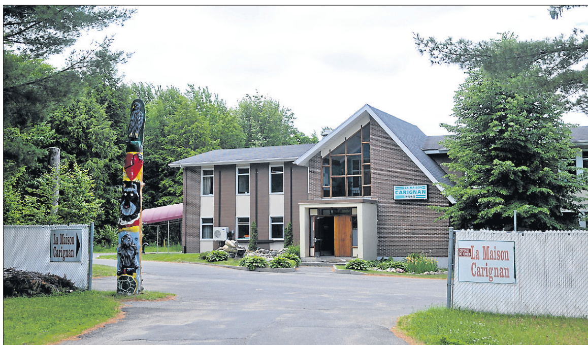
La Maison Carignan est accessible 7 jours sur 7 et 24 heures sur 24.

ments et des conséquences qui s'y rattachent, font partie des aspirations de la Maison Carignan. Les individus seront amenés à prendre conscience