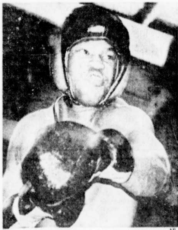
Larry Holmes essaie d'avoir l'air un peu plus méchant en faisant une grimace.