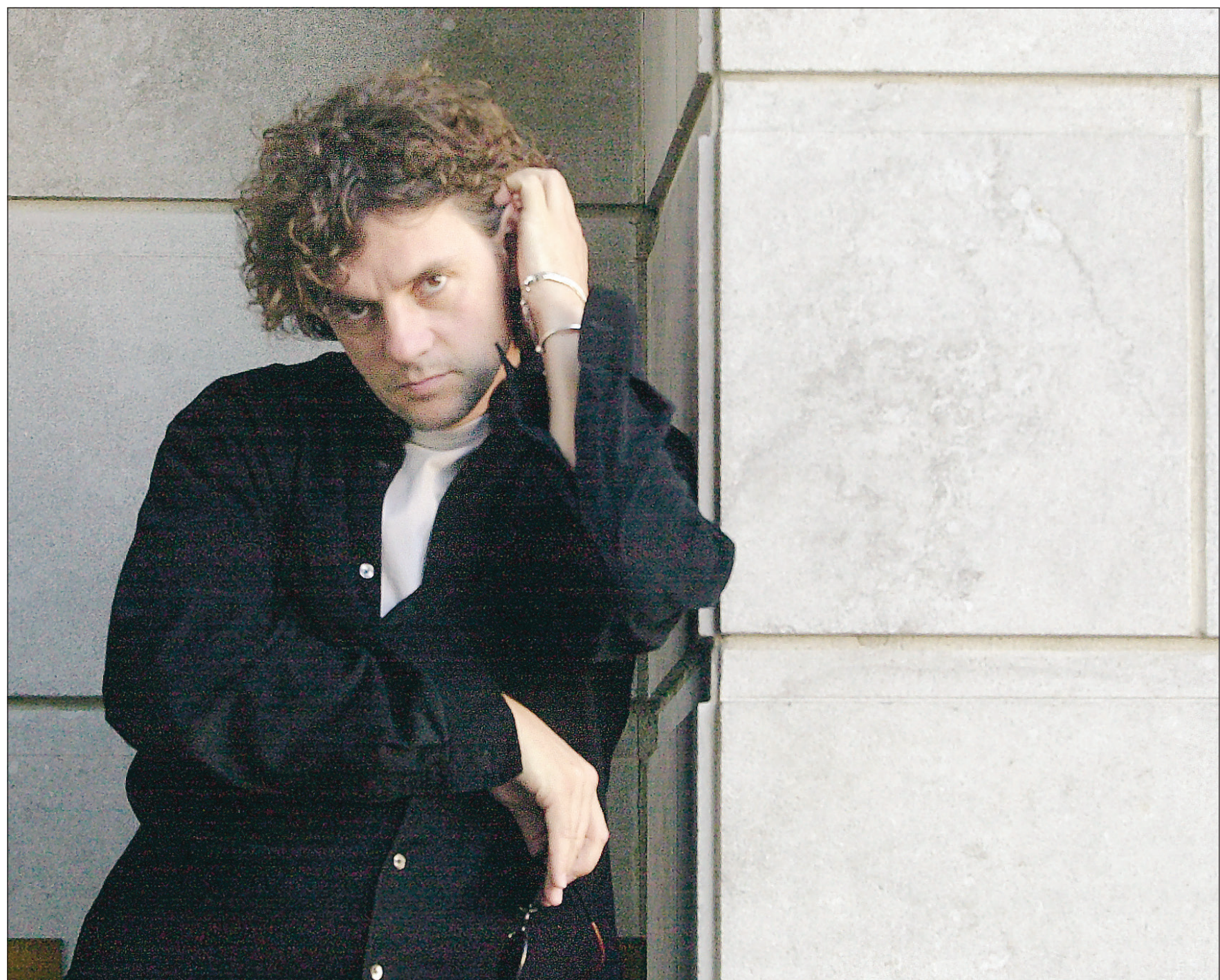
Dès l'automne prochain, le cinéaste François Girard ( Le Violon rouge ) ajoutera trois mises en scène à son parcours : un Kafka au Théâtre du Nouveau Monde, un oratorio moderne au Brooklyn Academy of Music, avec le collectif Bang on a Can, et un Wagner ( Siegfried ) à Toronto.

« Les gens qui ont fait les adaptations ont tous eu la prétention de terminer l'oeuvre. J'ai une attitude plus humble par rapport au roman et non seulement je l'accepte dans sa structure et dans son contenu, mais je n'ai pas cherché à le transformer complètement en objet théâtral, à en faire une pièce selon tous les critères du théâtre. Pour moi, c'est important d'amener le théâtre dans le livre au même titre que d'amener le livre dans le théâtre. On présente la pièce en chapitres. Il y a toutes sortes de manifestations littéraires. Le texte sera projeté sur des écrans, sur les personnages. Alors, on n'a pas la représentation de lieux réalistes.