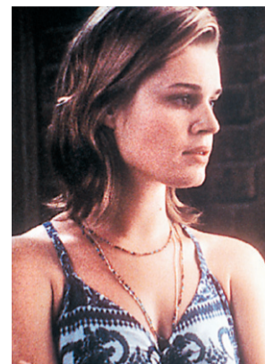
Rebecca Romijn Stamos