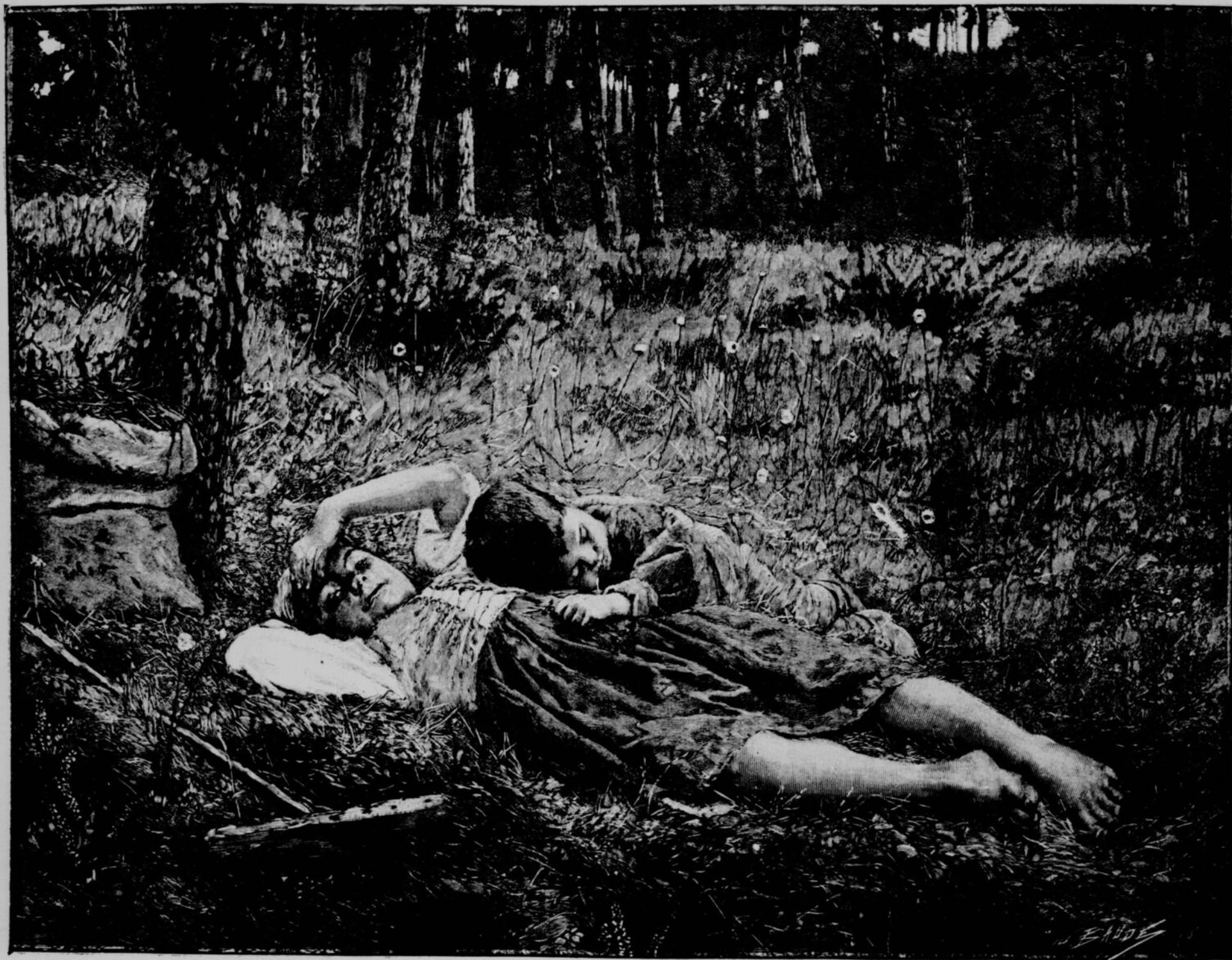
BEAUX-ARTS. -- DANS LES BOIS. —TABLEAU DE M. S. PINTO