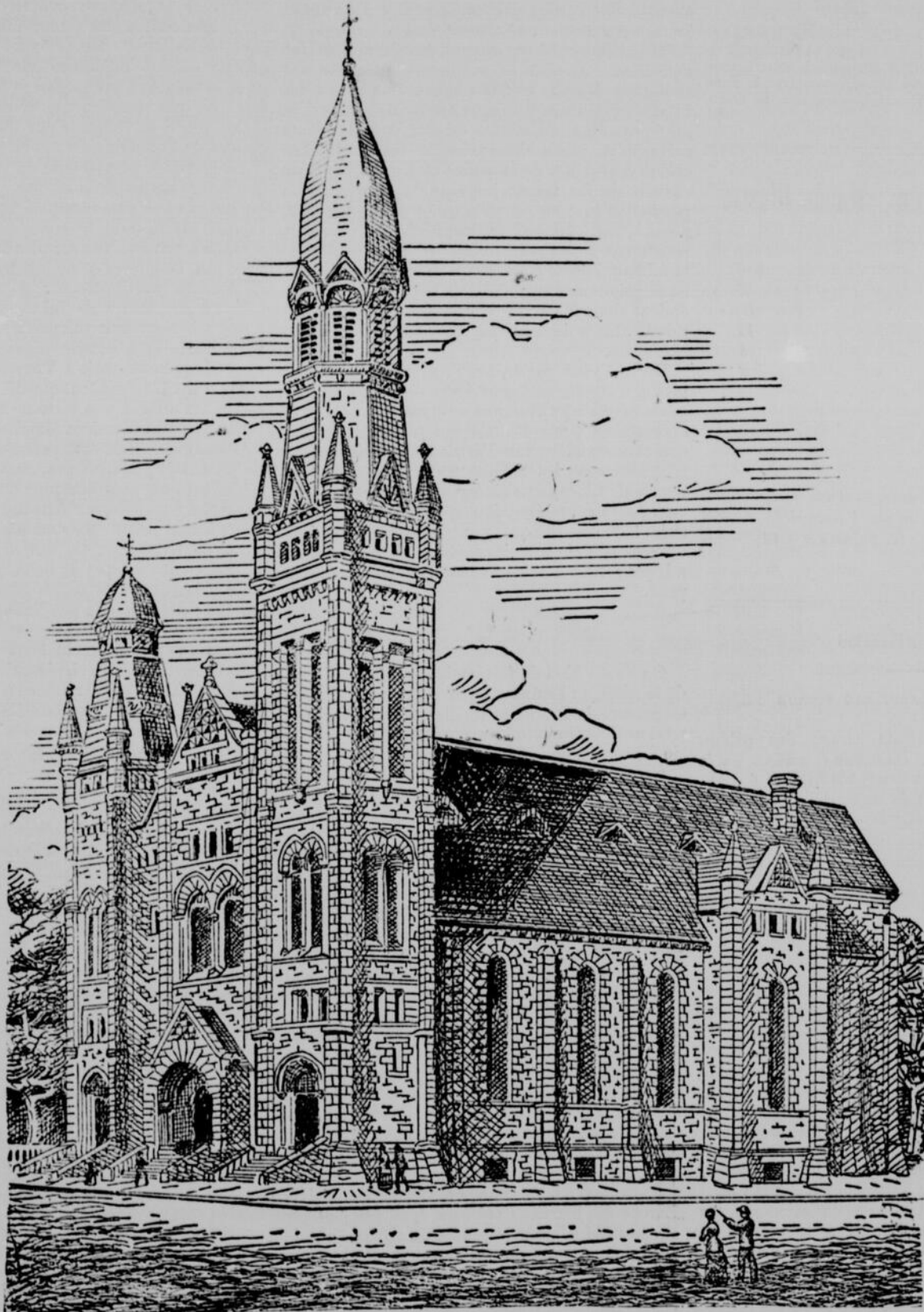
L'ÉGLISE SAINTE-BRIGITTE D'OTTAWA

La ligne, par insertion - - - - 10 cents Insertions subséquentes - - - - 5 cents Tarif spécial pour annonces à long terme