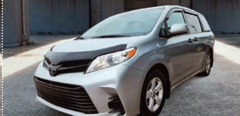
Toyota Sienna 2019

Ⓜ Automatique Ⓢ 64 450 KM # 24515A 34 995$ 32 995$