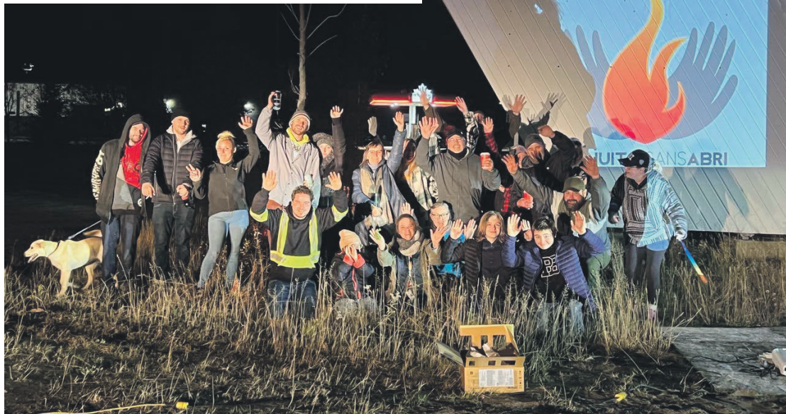
Une vingtaine de personnes était présente à la Nuit des sans-abri le 20 octobre à Forestville.