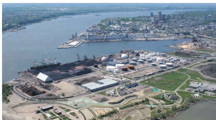
Port de Québec

Environ 80 % des biens de consommation sont livrés par navire. La congestion dans certaines zones stratégiques du globe et les changements climatiques ont cependant un impact sur les chaînes d'approvisionnement. Tant d'un point de vue économique, environnemental que social, on doit viser le bon mode de transport, au bon moment.