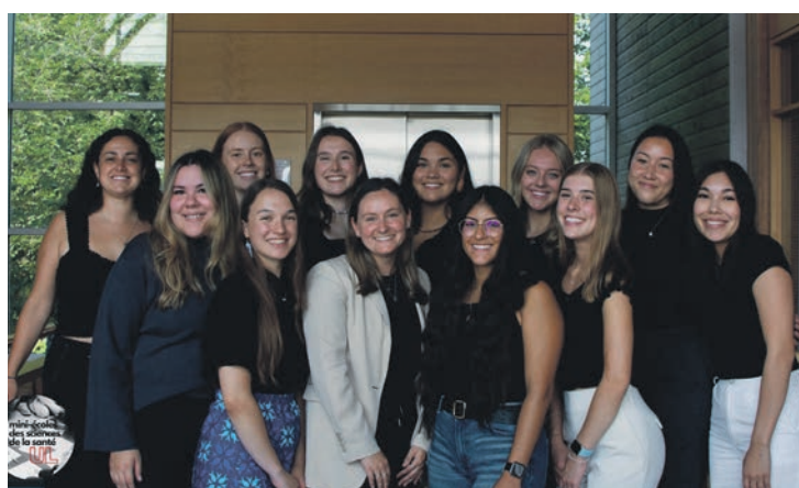
Le comité de la mini école permet de faire connaître les programmes de la faculté de santé de l'Université Laval aux jeunes autochtones de la province.

Le comité fait plusieurs visites dans les commu-