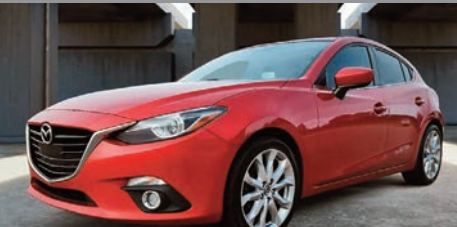
Mazda3 GT Hatchback 2016

Ⓜ Manuelle Ⓢ 111 465 KM # U-649A 19 995$ 16 495$