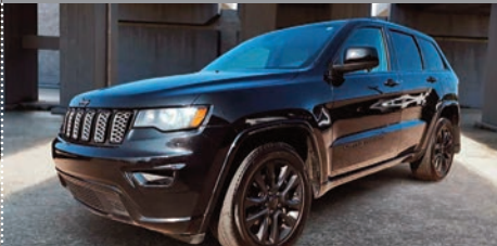
Jeep Grand Cherokee Altitude 4x4 2021

Ⓜ Automatique Ⓢ 86 835 KM # 23016A 39 995$ 37 995$