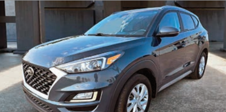
Hyundai Tucson Preferred AWD 2021

Ⓜ Automatique Ⓢ 60 448 KM # 23090A 32 995$ 28 995$