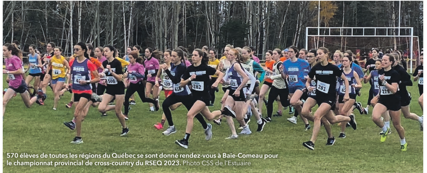
570 élèves de toutes les régions du Québec se sont donné rendez-vous à Baie-Comeau pour le championnat provincial de cross-country du RSEQ 2023.

En ce qui concerne la Côte-Nord, 56 athlètes a parcouru les sentiers du Cégep de Baie-Comeau dans l'espoir de monter sur le podium. Au total, huit catégories de cou-