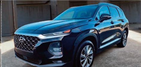
Hyundai Santa Fe 2.0T Preferred AWD 2020

Ⓜ Automatique Ⓢ 91 175 KM # 24007A 31 895$ 28 995$