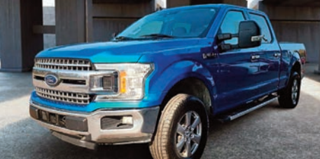
Ford F-150 XLT SuperCrew 2019

Ⓜ Automatique Ⓢ 163 000 KM # U-628 39 995$ 29 995$