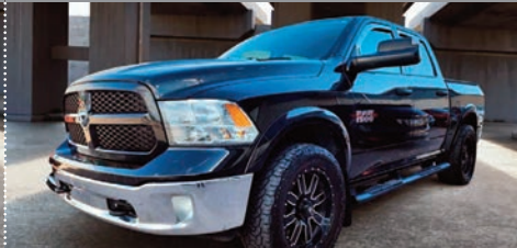
RAM 1500 Outdoorsman Crew Cab 4x4 2016

Ⓜ Automatique Ⓢ 122 676 KM # 23105B 26 995$ 24 995$