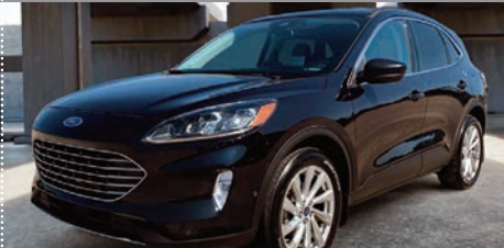
Ford Escape Titanium hybride AWD 2021

Ⓜ Automatique Ⓢ 32 524 KM # 21214B 37 495$ 33 995$