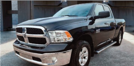
RAM 1500 SLT Quad Cab V6 4x4 2017

Ⓜ Automatique Ⓢ 81 841 KM # U-654A 33 995$ 27 995$