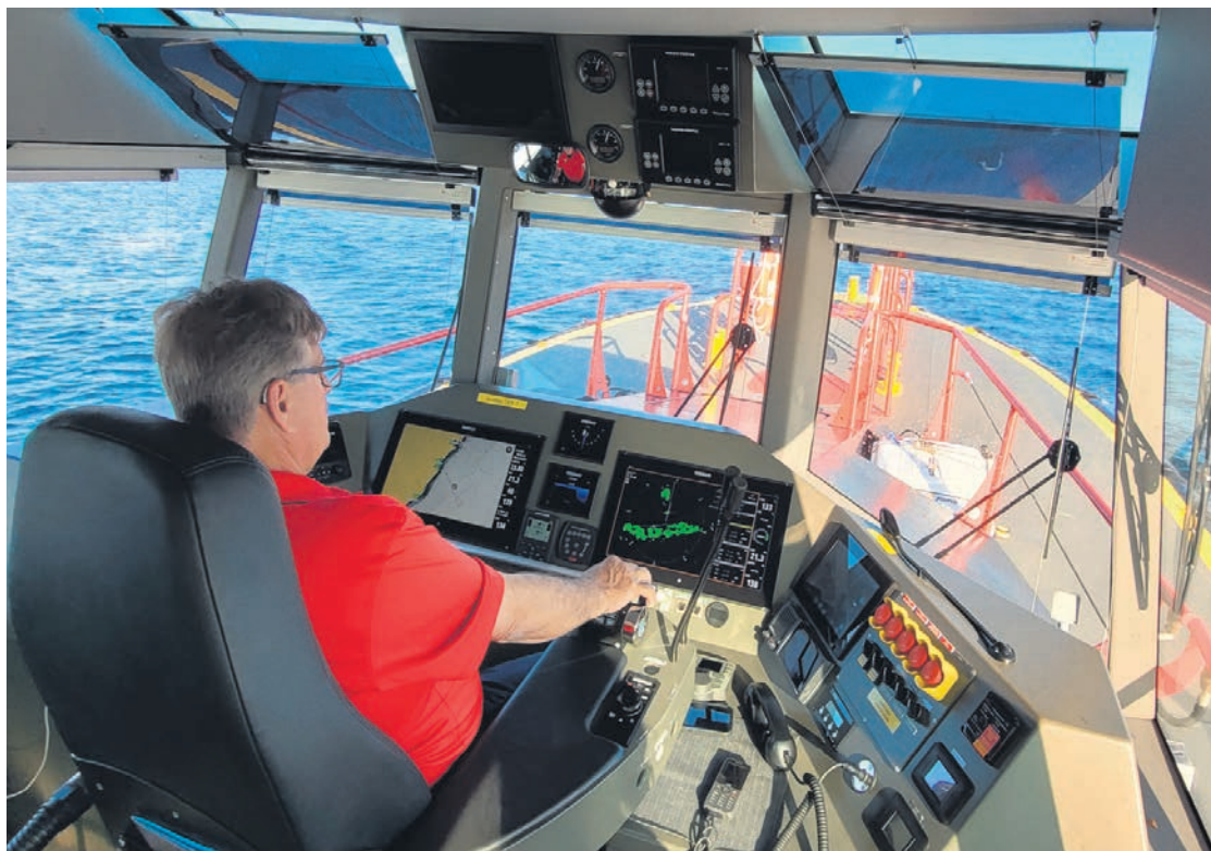
L'APL intervient maintenant dans un écosystème sophistiqué.