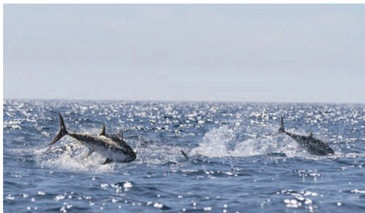
Les thons rouges sont de plus en plus observés dans l'estuaire du Saint-Laurent.

«Le thon rouge migre de façon saisonnière dans le golfe du Saint-Laurent à la