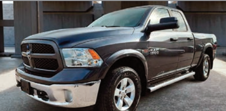
RAM 1500 Ecodiesel Outdoorsman 2018

Ⓜ Automatique Ⓢ 85 787 KM # 23002A 34 995$ 28 995$