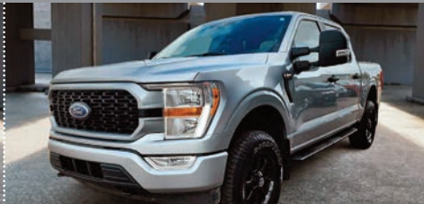
Toyota Sienna 2019

Ⓜ Automatique Ⓢ 50 925 KM # U-657 49 995$ 46 495$