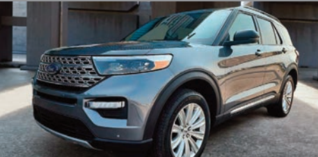
Ford Explorer Limited AWD Hybride 2021

Ⓜ Automatique Ⓢ 49 178 KM # 5243 54 995$ 45 995$