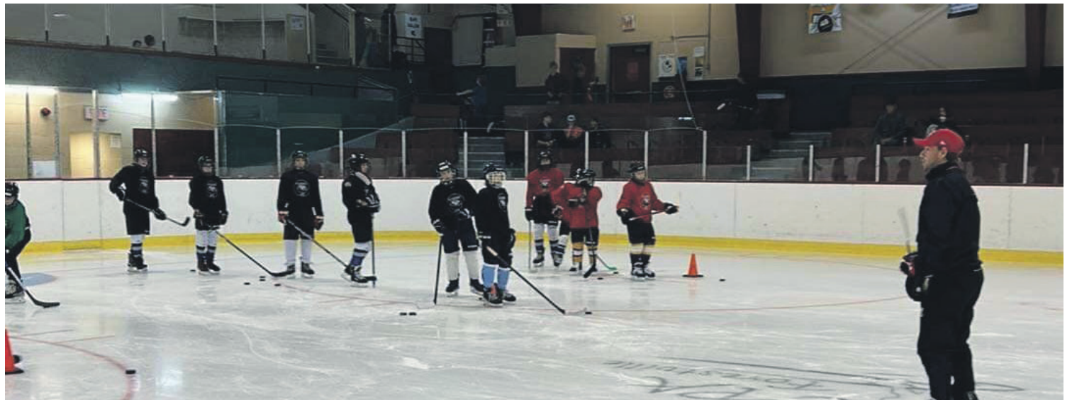
Les camps de sélection ont eu lieu, la formation des équipes sera dévoilée sous peu.

» On a cherché plusieurs solutions et après de nombreuses discussions entre