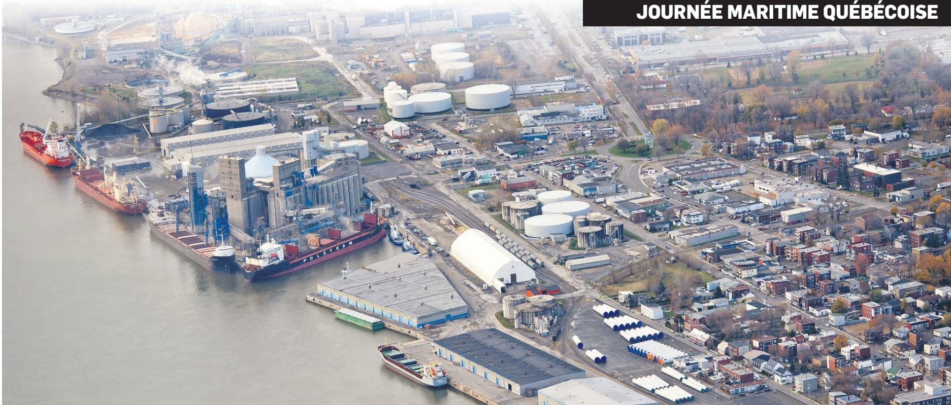
Port de Trois-Rivières