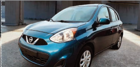
Nissan Micra S 2018

Ⓜ Automatique Ⓢ 59 190 KM # 23105A 16 995$ 14 995$