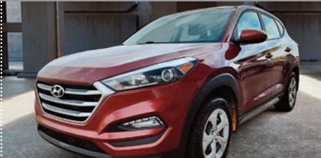
Hyundai Tucson 2.0L AWD 2018

Ⓜ Automatique Ⓢ 92 939 KM # 23127A 20 995$