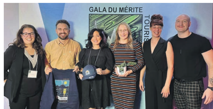
Le Manoir du Café de Baie-Comeau a remporté le prix dans la catégorie Tourisme durable lors du Gala du mérite touristique de la Côte-Nord.

Le prix coup de cœur du public pour lequel le grand public a pu voter a été remis