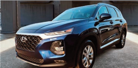
Hyundai Santa Fe 2.4L Essential 2019

Ⓜ Automatique Ⓢ 43 718 KM # 24004A 27 495$ 25 995$