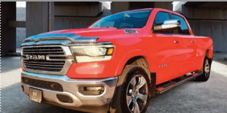
RAM 1500 Laramie 4x4 2019

Ⓜ Automatique Ⓢ 88 500 KM # U-669 47 495$