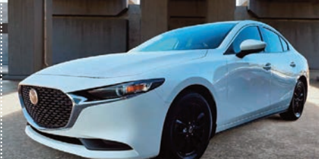
Mazda3 GS AWD 2022

Ⓜ Automatique Ⓢ 33 800 KM # 23131B 31 995$ 28 995$