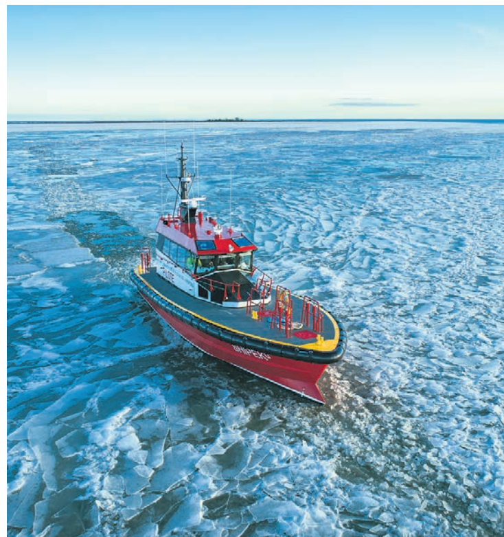
L'organisation offre un service de pilotage à la fois résilient, intelligent et durable.