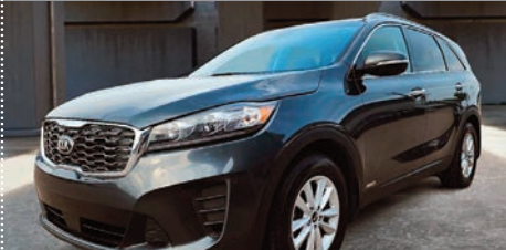
Kia Sorento LX+ V6 AWD Edition Limitée 2020

Ⓜ Automatique Ⓢ 67 800 KM # 23647A 31 495$ 27 495$