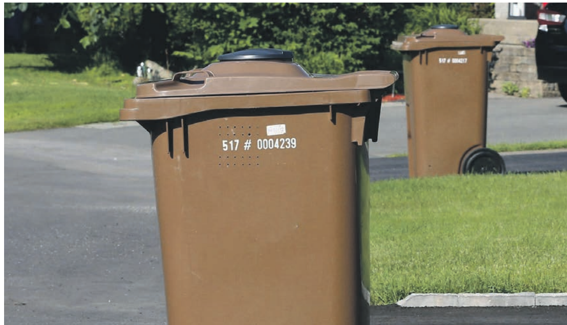
Bien que plusieurs pratiquent déjà le compostage, l'instauration universelle des bacs bruns n'est qu'une question de temps pour les citoyens de la Haute-Côte-Nord.

Deux entreprises ont déposé une soumission dans les délais prescrits, mais une seule s'est qualifiée et a répondu aux critères d'admissibilité, soit GFL Environnemental Inc. de Montréal pour la somme de 1 121 465,59 $ plus taxes applicables, ceci pour la période du 16 octobre 2023 au 31 décembre 2025.