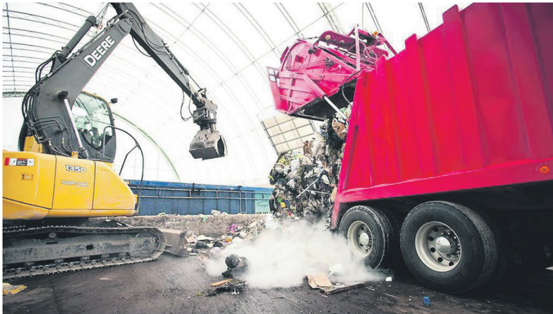
La disposition des matériaux à partir de l'écocentre des Bergeronnes avant le transport.

En 2021 (année du précédent contrat attribué dans ce secteur), le transport des ordures à Ragueneau a coûté 763 290 $. En 2023 selon l'adjudication du récent contrat, il en coûtera 1 375 000 $, une augmenta-