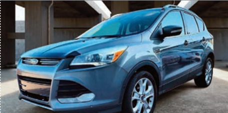
Ford Escape Titanium AWD 2014

Ⓜ Automatique Ⓢ 232 038 KM # 2769 24 495$ 22 995$