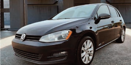
Volkswagen Golf 1.8 TSI 2017

Ⓜ Manuelle Ⓢ 132 664 KM # U-644 18 295$ 15 995$