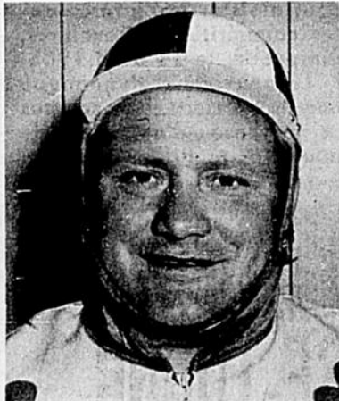
JEAN PAUL GAUTHIER

Gemini Frost Miss Butch Denny Boy Party Sweet Moligan Gift Man Honey Reed Jewel's Knight Pleasant Lad Adios Mars Swanton Girl Sadie Shore Hondo Tag J Byrd Melody Richelieu Janet's Irish Rose