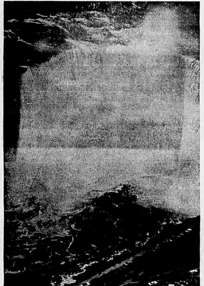
LE SPECTACLE DU NIAGARA—Les eaux tonitruantes des Chutes en Fer à Cheval rapetissent le "Maid of the Mist". Vous pouvez également obtenir des vues des Chutes du Niagara prises des tours sur le monticule et dans les parcs d'état et provincial voisinant les cataractes. Pour plus de documentation gratuite, s'adresser au Département INB, Chambres de Commerce, Niagara Falls, Canada ou Etats-Unis.