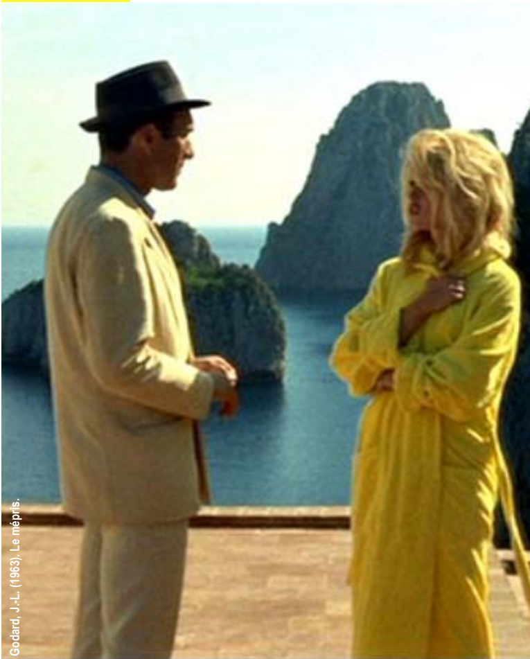
Godard, J.-L. (1963). Le mépris.