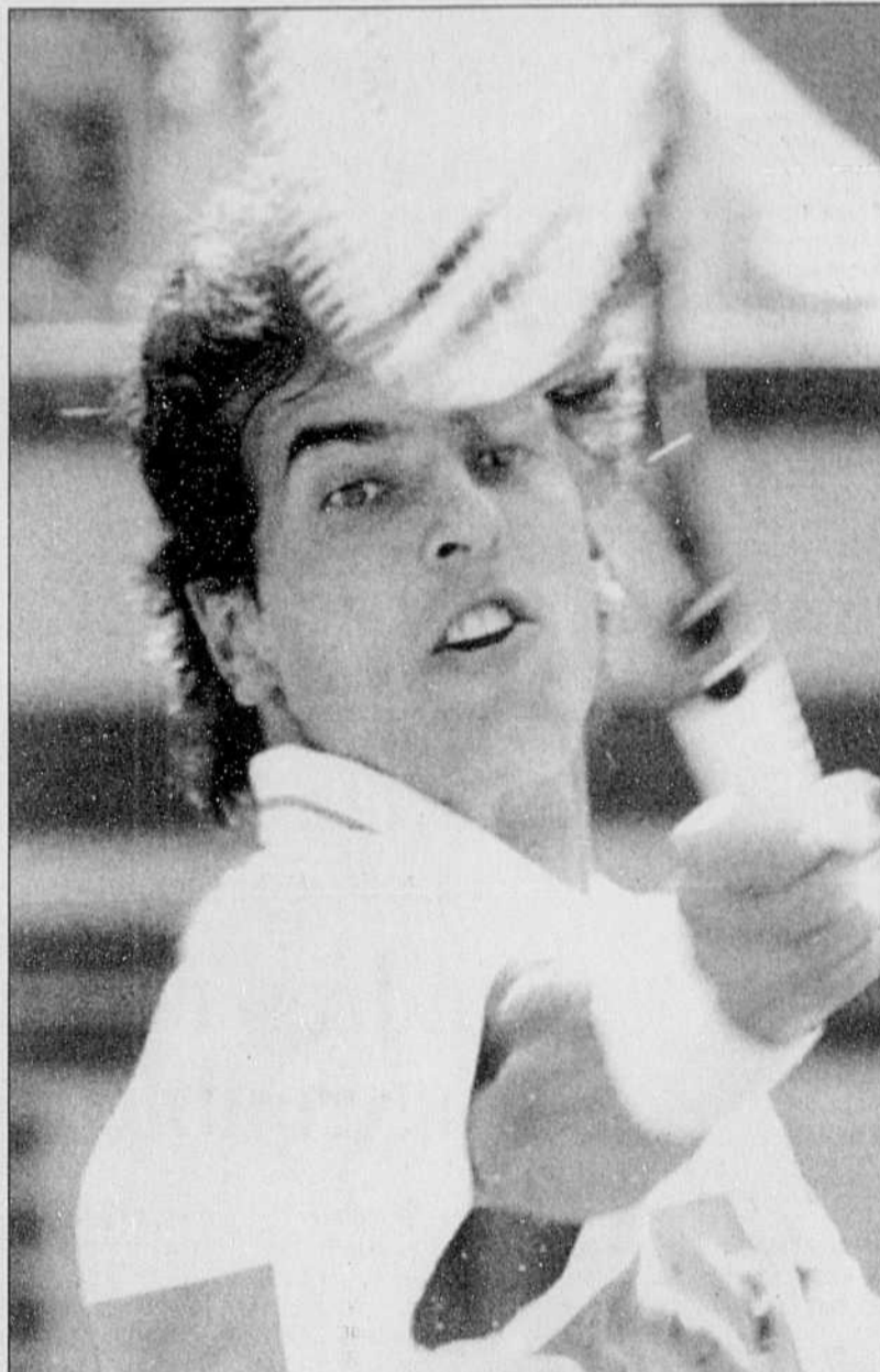
Le Français Cédric Pioline a baissé pavillon devant Michael Stich.

Michael Stich a connu moins de problème que Rosset pour vaincre un Cédric Pioline assez vite décontancé (6-4, 6-4, 3-6, 6-2) après seule-