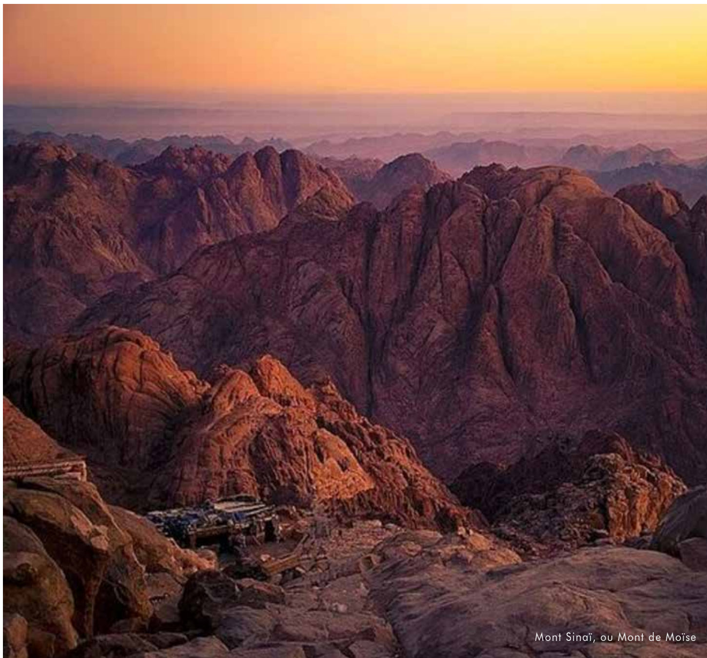
Mont Sinaï, ou Mont de Moïse