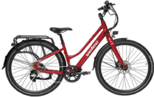
Citi 500 vélo électrique très léger 23 kg Moteur de 500 watts

Plusieurs vélos démonstrateurs disponibles pour en faire l'essai avec un instructeur sur un parcours de 4 à 8 km lorsque la température le permet