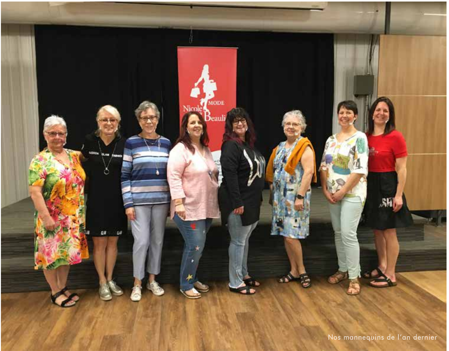
Nos mannequins de l'an dernier