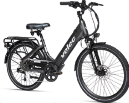
R48 moteur puissant de 500 watts et batterie 48 volts 10 ou 14 ampères