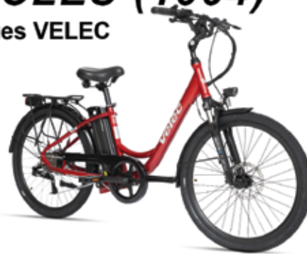
A2 vélo électrique 36 volts 10, 13 ou 17 ampères

Plusieurs vélos démonstrateurs disponibles pour en faire l'essai avec un instructeur sur un parcours de 4 à 8 km lorsque la température le permet