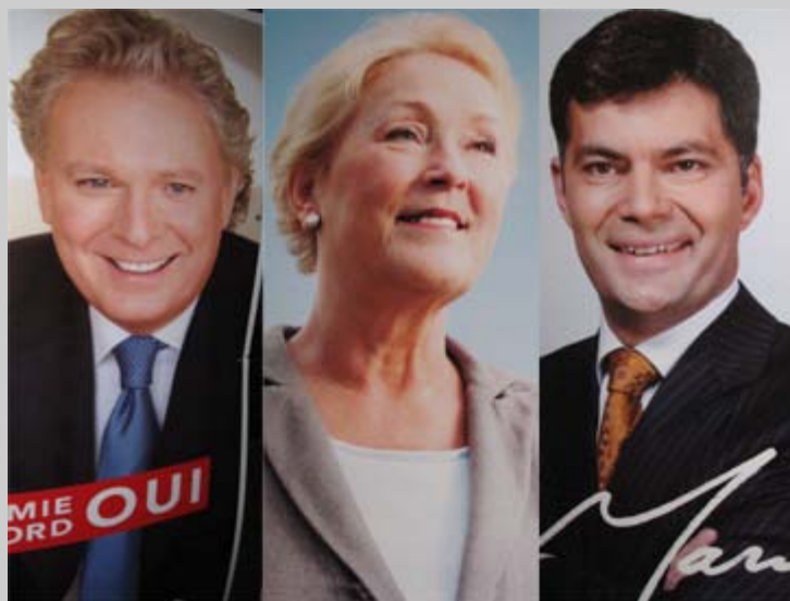
Jean Charest, Pauline Marois et Mario Dumont

La campagne électorale au Québec se jouera le 8 décembre. Tout indique que le Premier ministre sortant, Jean Charest, sera réélu mais la politique ressemble beaucoup au sport et rien n'est décidé tant que le vote n'est pas dans la boîte... Que le meilleur gagne! (Voir site Élections Québec)