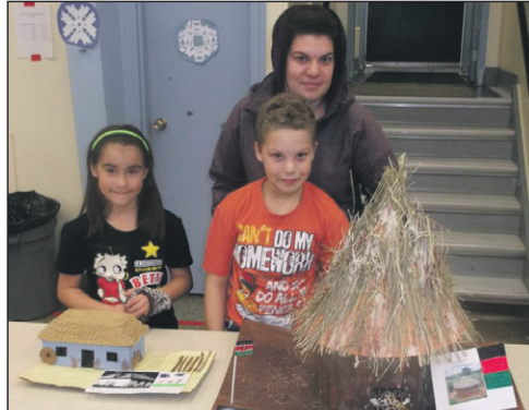
Australie et Kenya.