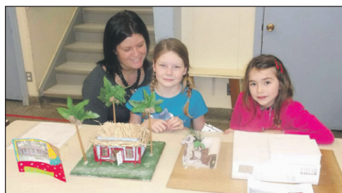
Cuba et Espagne.