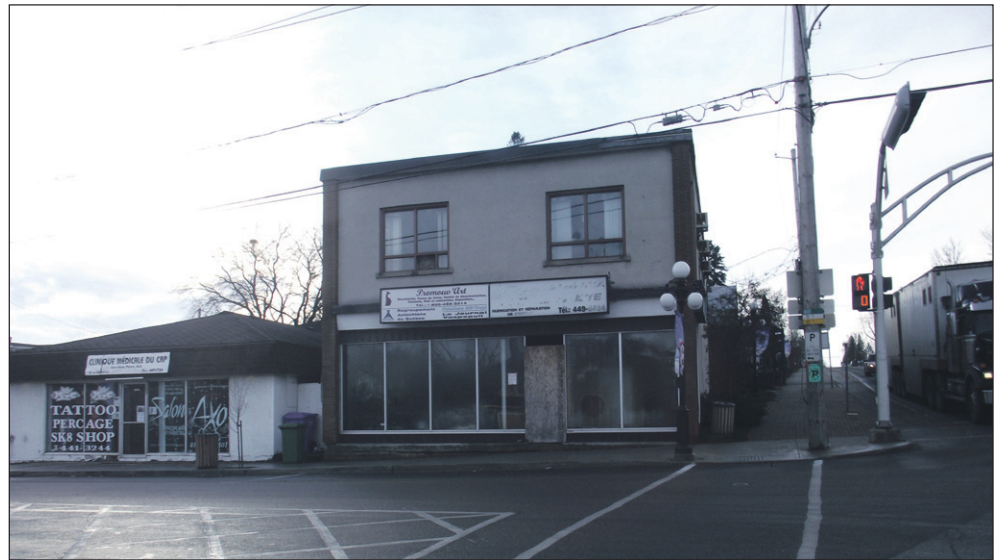
L'édifice situé au 151 rue Commerciale est à l'étude depuis plusieurs mois. L'immeuble sera mis en vente aux enchères en janvier 2013. L'acquisition sera conditionnelle à la démolition et la reconstruction à court terme.

Selon la définition de village-relais, une attention particulière doit être portée sur