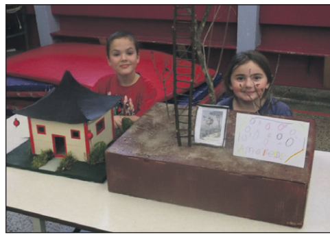
Chine et Nouvelle-Guinée.