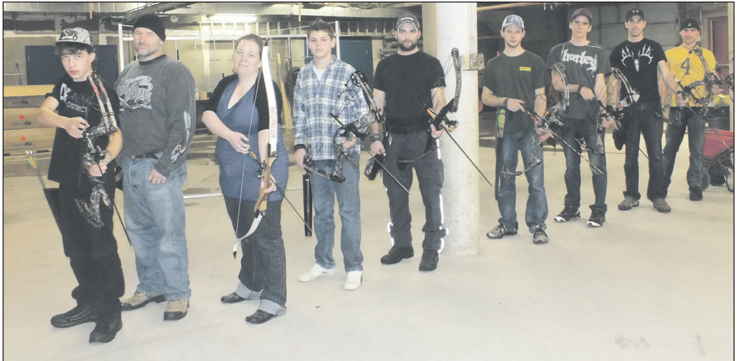
Les Archers de la Haute-Gatineau se retrouvent le mardi soir à la Cité étudiante.