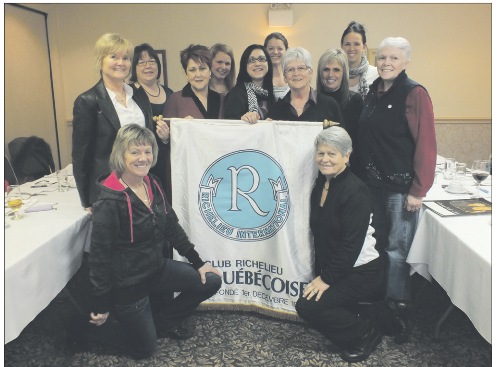
Les membres du Club Richelieu la Québécoise s'activent pour préparer la Pakwaun qui se tiendra du 24 au 27 janvier.

hommes, femmes et enfants. En invité spécial, Hugo Girard, l'homme le plus fort du Canada, sera présent.