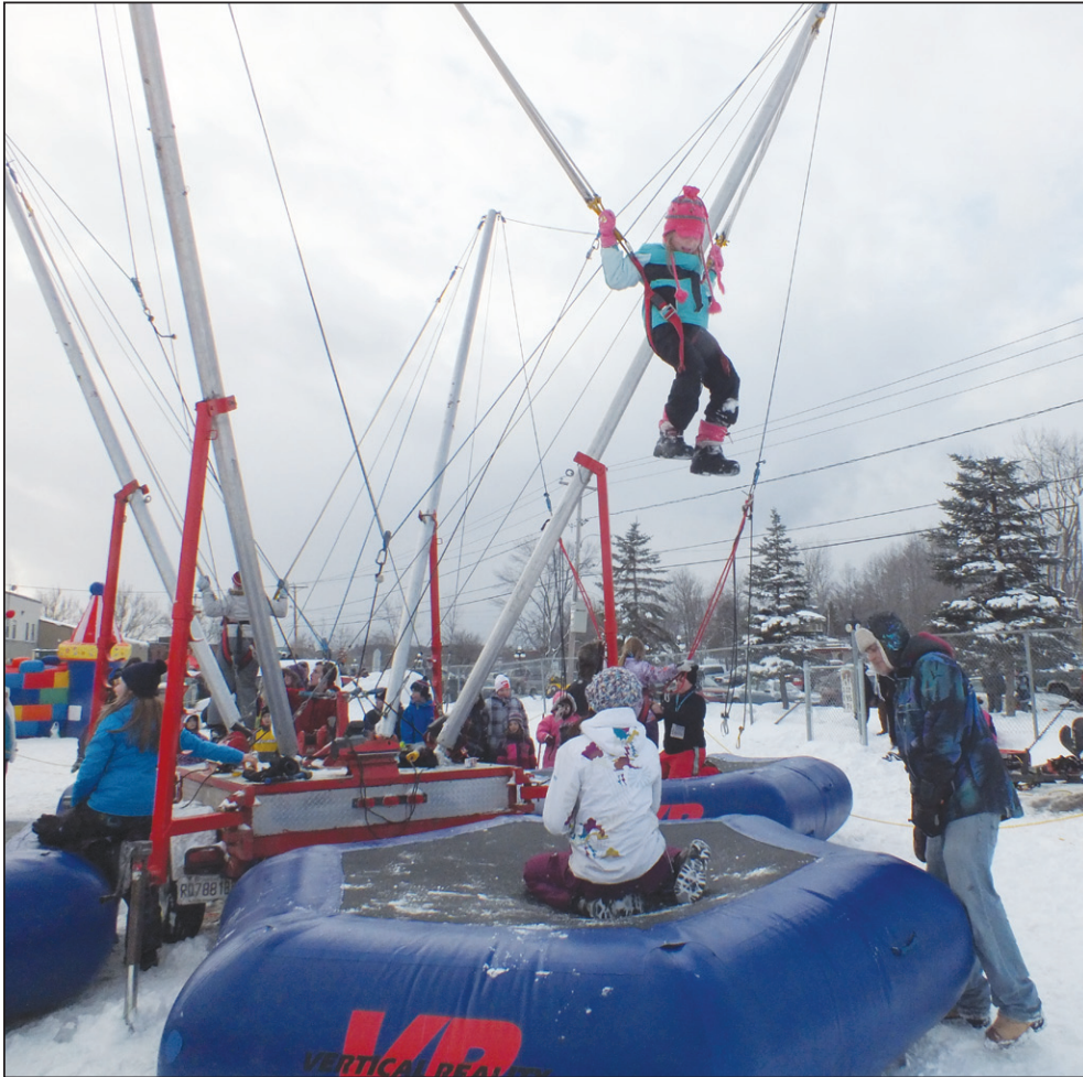
Une foule d'activités sont au programme de la Pakwaun 2013.

Le dimanche, il n'y aura pas de compétition d'hommes forts mais un Défi BMR, organisé par BMR Martel et fils. Une compétition plus grand public, ouverte aux