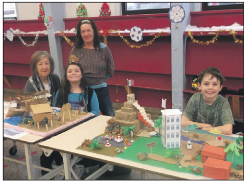
Vietnam et Mexique.