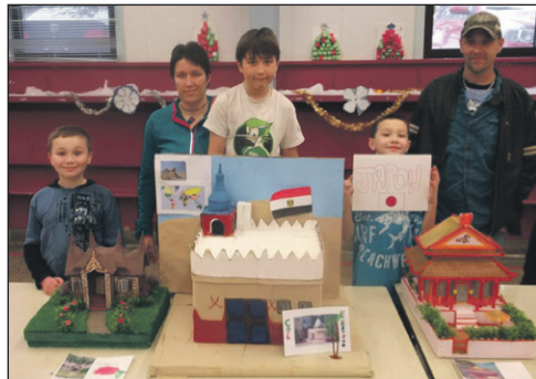
Indonésie, Égypte et Japon.