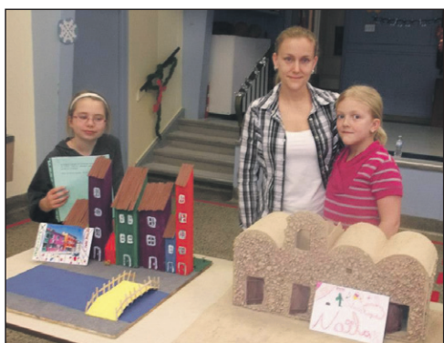
Venise (Italie) et pays sahariens.