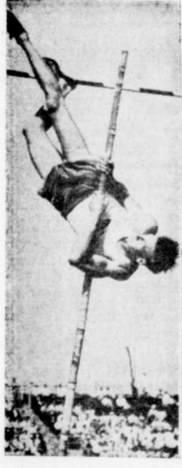
© Cornelius Warmerdam, du club Olympique de San Francisco a établi un nouveau record pour le tournoi annuel national de l'A.A.U., tenu à Randall's Island, N. Y., en clairant la barre à son premier essai, à 15 pieds et 3 1-2 pouces. Warmerdam détenait le record antérieur de 15 pieds établi par lui-même l'an dernier.