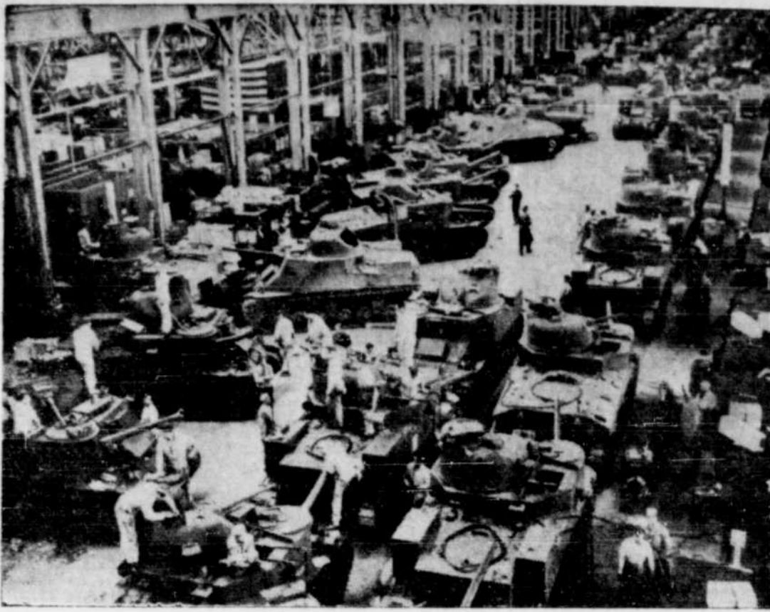
À peine six mois se sont écoulés depuis que le Japon a attaqué les Etats-Unis et voici les usines de tanks qui produisent des engins de guerre par centaines. La photo montre une partie de l'usine de tanks Chrysler à Detroit.