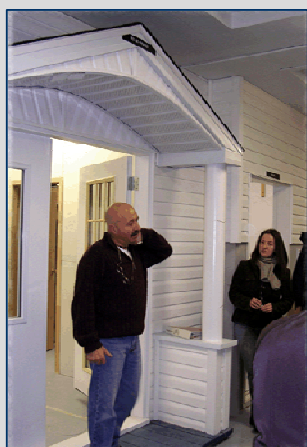
Installations du programme Entretien général d'immeubles