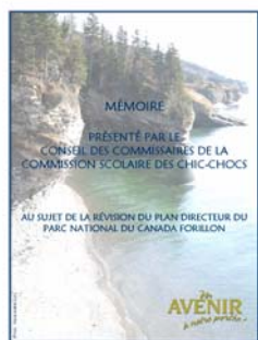
Commission scolaire des Chic-Chocs

Nous constatons que la formation professionnelle reprend peu à peu la place qu'elle avait perdue dans notre milieu. Nos élèves peuvent faire un choix éclairé et les formations offertes chez nous sont valorisantes. La séance d'information a confirmé que les élèves inscrits en formation professionnelle choisissent leur voie selon leurs talents et leurs idéaux. La visite s'est terminée par un social « Party garage du Nouvel An » où nous avons échangé. Un accordéoniste est venu agrémenter le tout par une musique entraînante. Il faut aussi souligner la collaboration de l'ensemble des enseignants et des élèves de la formation professionnelle pour l'organisation de l'activité. Si vous avez des idées de projets pour vos élèves, pour un ami ou pour vous, contactez-nous, nous sommes là pour répondre à vos besoins de formation.