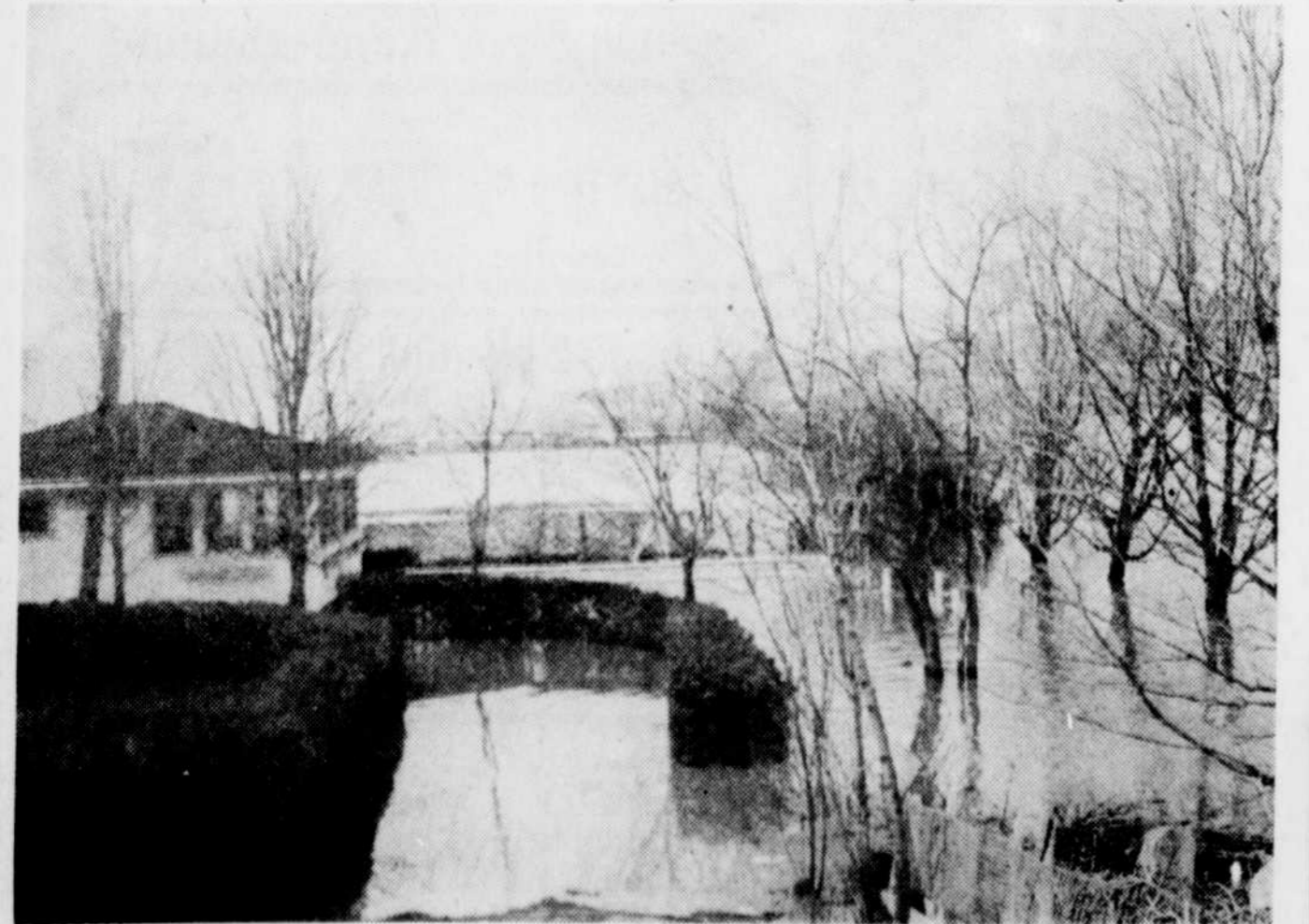
Les pluies diluviennes qui se sont abattues sur la région de la Beauce ces derniers jours ont forcé la rivière Chaudière à quitter son lit. Ainsi, plusieurs municipalités, dont Vallée Jonction, ont été inondées.