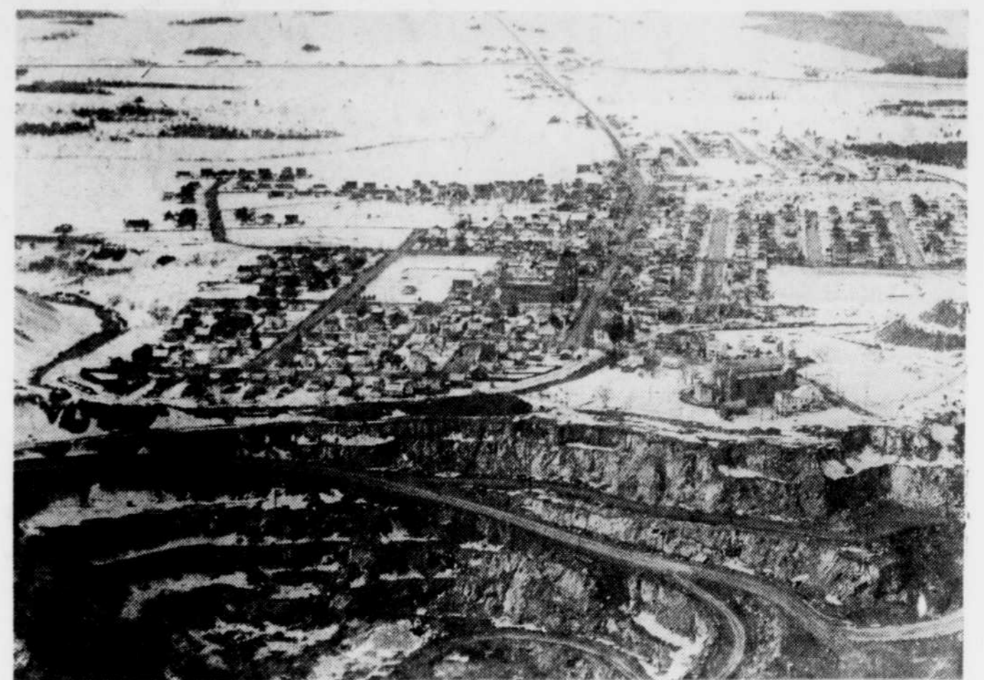
On voit ici une vue de l'ancien St-Maurice alors qu'il se trouvait toujours près du puits à ciel ouvert de la mine King Beaver, une filiale de l'Asbestos Corporation.

N.B.: Sout de déménagement du cimetière non inclus.