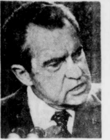
Le président Nixon