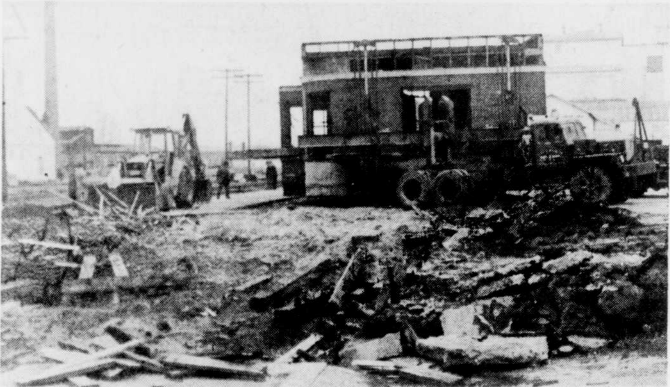
Une époque qui disparaît Se serait-on attendu au point de ne pas vouloir donner son coup de grâce à la gare devant M. tout le monde? Cela semble peu vraisemblable, mais il est pourtant évident, d'après cette photo, qu'on a décidé de transporter ce qui reste de l'ancienne gare ailleurs, avant de l'achever. Le camion auquel est fixée la bâtisse était d'ailleurs sur le point d'emporter le "monument" au moment où la photo a été prise.