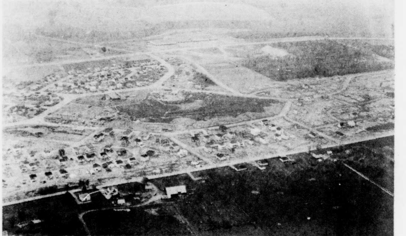
St-Maurice: Après le grand déménagement, des rues modernes, disposées selon un style nouveau et surtout, un environnement agréable dans un secteur résidentiel bien équipé en services. Le tout aura coûté $14.6 millions, le double de la somme initialement prévue.