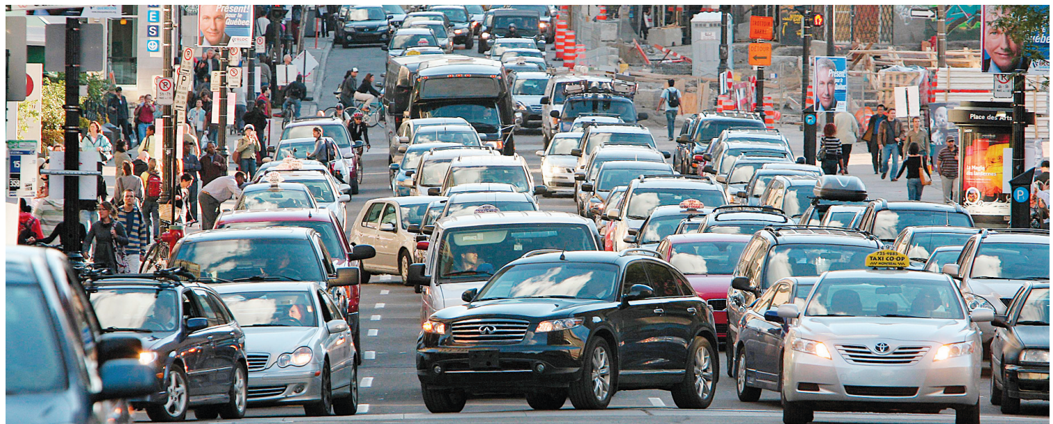
Le gouvernement fédéral veut calculer les émissions de gaz à effet de serre par véhicule tandis que Québec a choisi de faire une moyenne du parc automobile d'un constructeur.

■ Voir aussi en page A 7 le texte de l'Alliance de la fonction publique du Canada.